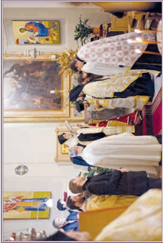
Ίερός Ναός Αγίου Θεοδώρου Ρώμης.