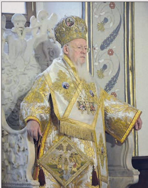
Ἡ Αὐτοῦ Θειοτάτη Παναγιότης ὁ Οἰκουμενικὸς Πατριάρχης κ. κ. Βαρθολομαῖος