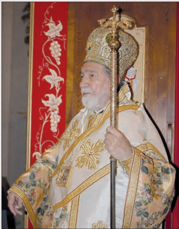
Ὁ Σεβασμιώτατος Μητροπολίτης Ἰταλίας καὶ Μελίτης καὶ Ἐξάρχος Νοτίου Εὐρώπης κ. κ. Γεννάδιος