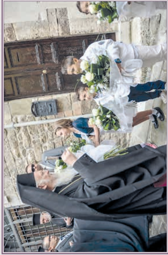
Ἵποδοχή τῆς Α.Θ.Π. τοῦ Οἰκουμενικοῦ Πατριάρχου κ.κ. Βαρθολομαίου ὑπὸ τῶν ἐλληνόπουλων τῆς Περούτζιας.