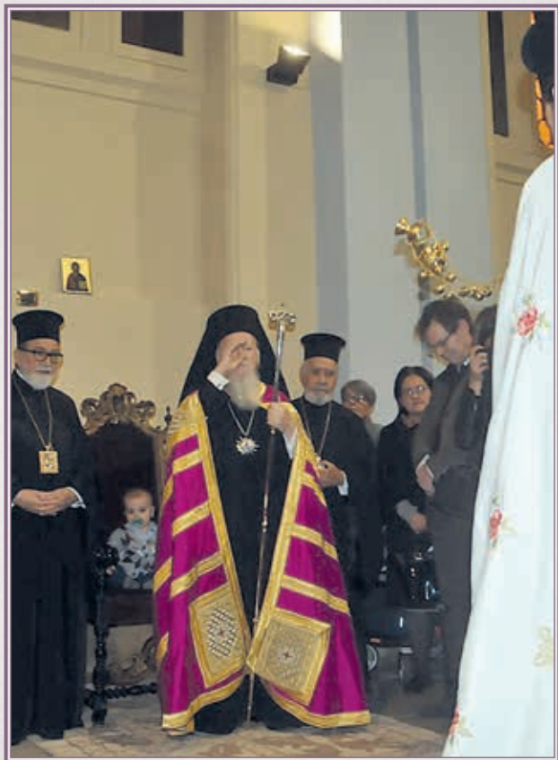
Έτερος Ναός Αγίου Νικολάου, εις Μπάρι.