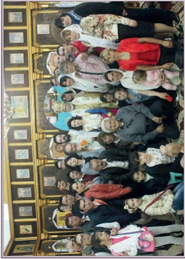
Τερός Ναός Όσιου Φαντίνου του Νέου, εις Σλαβονειαν Καλαβρίας.