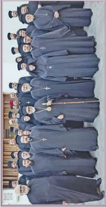
Κατὰ τὴν Ἱερατικὴν Σύναξιν εἰς Βολωνίαν.