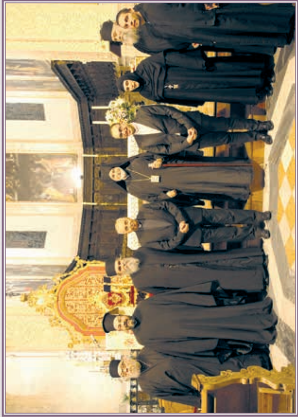
Κατὰ τὸ Ἀγιολογικὸν Συνέδριον εἰς Ἕνναν Σικελίας.