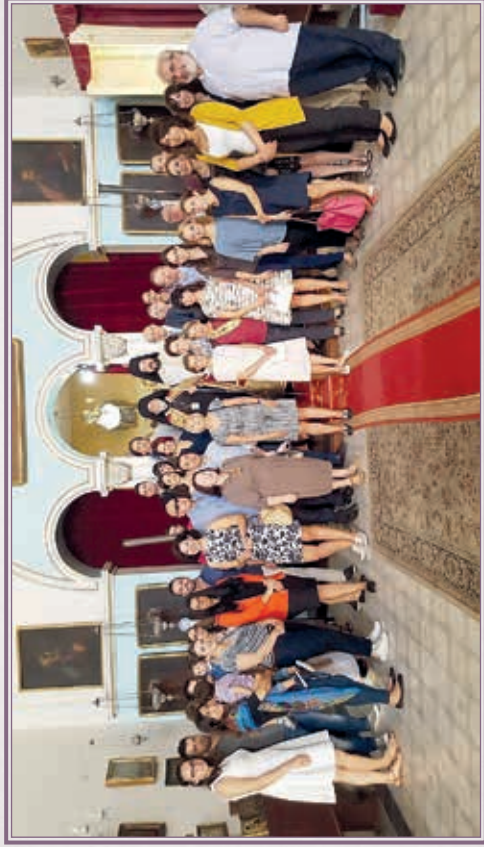
Ἱερός Ναός Ἁγίου Γεωργίου, εἰς Βαλλέτταν Μάλτας.