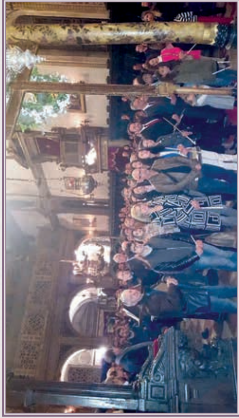
Πριν από την Ανάστασιν εις τόν έν Βενετία Μητροπολιτικόν Ναόν.