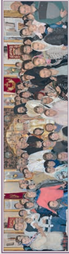
Ἱερὸς Ναὸς Ἁγίας Ἀναστασίας, εἰς Σιένα.