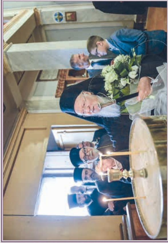
Ἱερός Ναός Ἁγίου Γερασίου Περουτζίας.