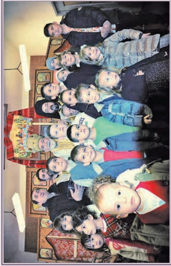
Ἰερός Ναός Ἁγίου Ἰωάννου τοῦ Νέου, εἰς Μοντροβί.