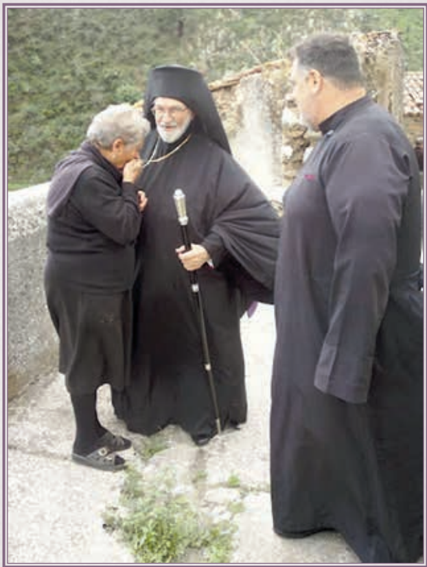
Εἰς τὸν Ἱερὸν Ναὸν «Παναγία τῆς Ἑλλάδος», εἰς Γαλλικιανὸν Καλαβρίας.