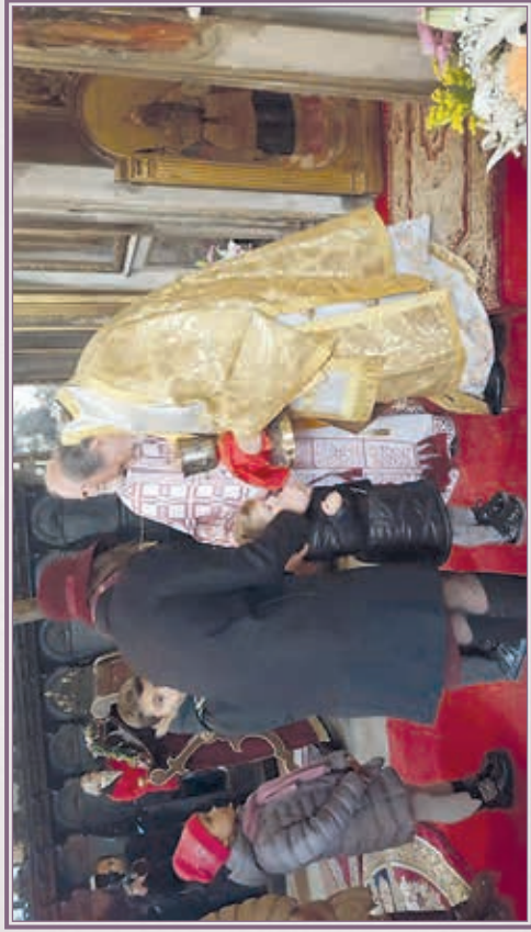
Μητροπολιτικός Ναός Αγίου Γεωργίου τῶν Ἑλλήνων Βενετίας.