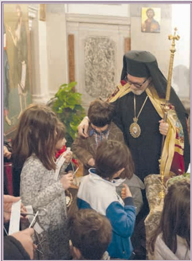
Ίερός Ναός Εὐαγγελιστοῦ Λουκᾶ Παδοῦης.