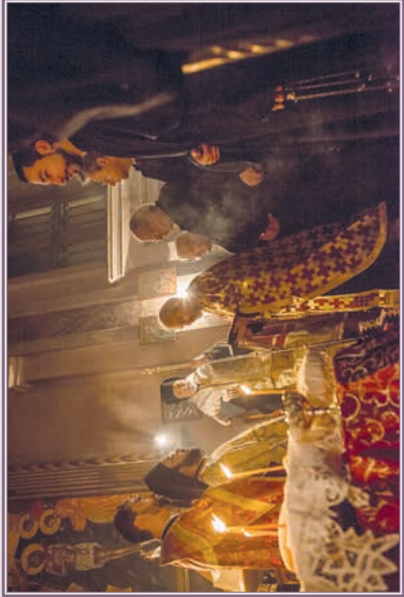
Τερός Ναός Τιμίου Προδρόμου Τορίνου.