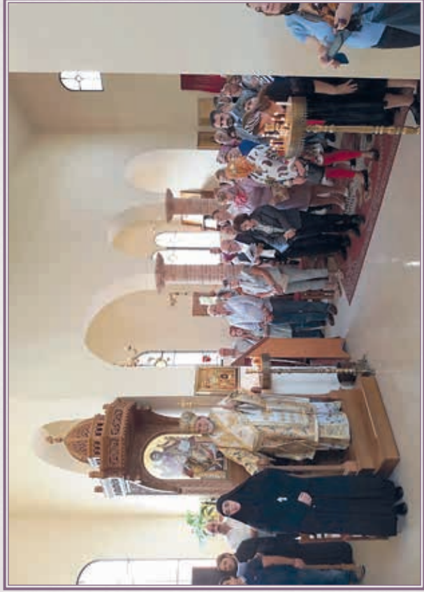
Ἱερός Ναός Ἁγίου Παύλου τῶν Ἑλλήνων, εἰς Ρήγιον Καλαβρίας.