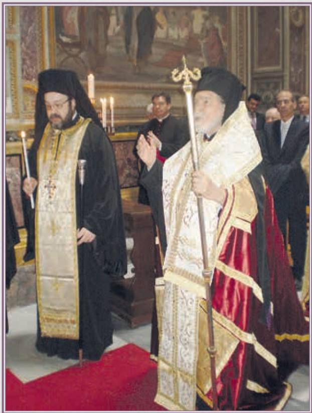
Ἐνώπιον τῶν ἱερῶν Λειψάνων τοῦ Ἁγίου Κυρίλλου, εἰς τὴν Βασιλικὴν τοῦ Ἁγίου Κλήμεντος ἐν Ρώμῃ.