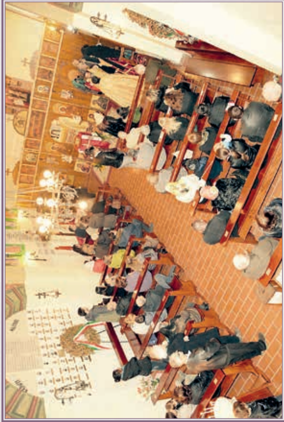
Ἐπὶ τὸς Ναὸς Ἁγίων Κωνσταντῖνου καὶ Ἐλένης, εἰς Κιέτι.