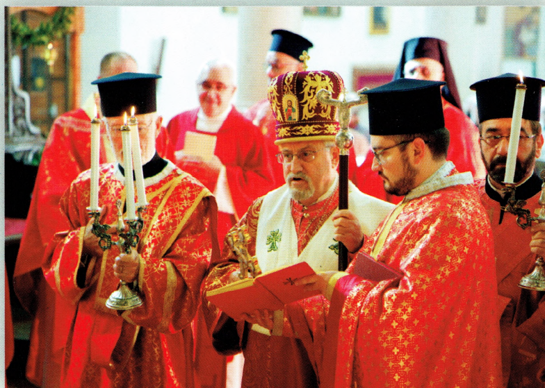
80° Anniversario della fondazione dell'Eparchia

80° ANNIVERSARIO DELLA FONDAZIONE DELL'EPARCHIA (1937 - 2017)