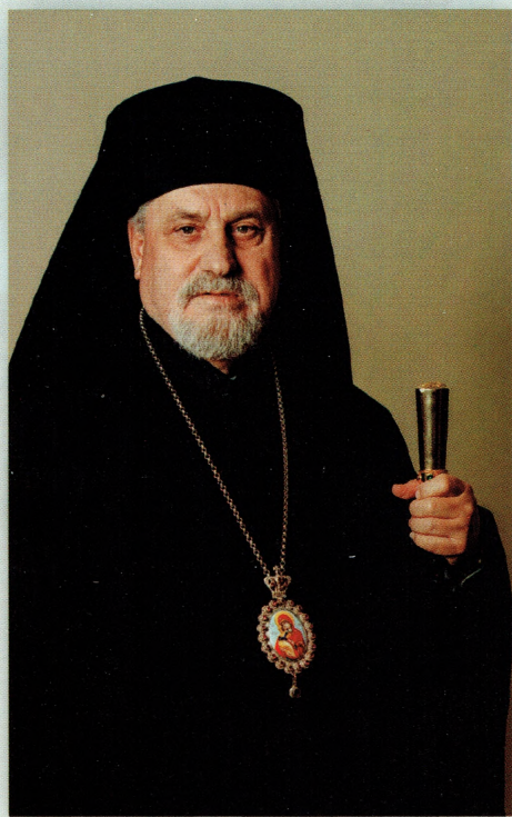
Mons. Giorgio Demetrio Gallaro