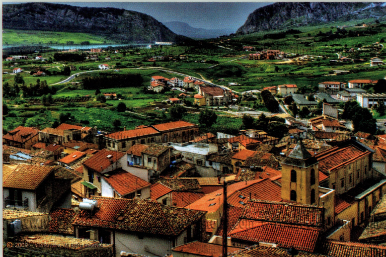
Piana degli Albanesi