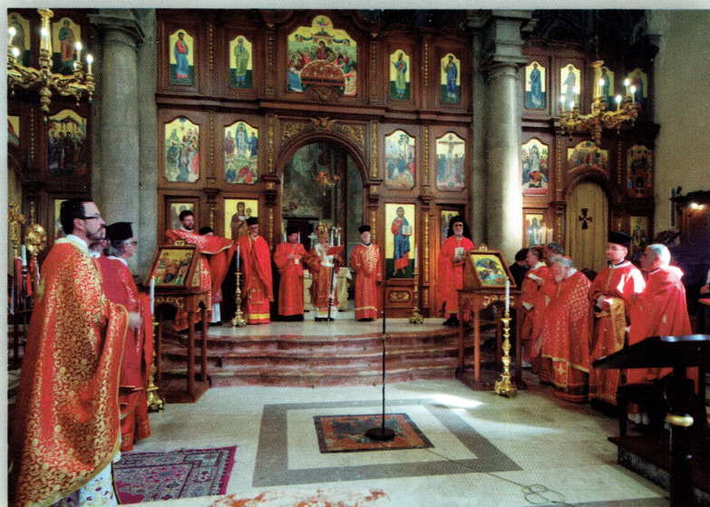
Cattedrale San Demetrio Piana degli Albanesi

80° ANNIVERSARIO DELLA FONDAZIONE DELL'EPARCHIA (1937 - 2017)