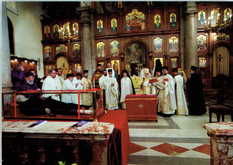
Chiusura processo eparchiale della causa di beatificazione di P. Giorgio Guzzetta

80° ANNIVERSARIO DELLA FONDAZIONE DELL'EPARCHIA (1937 - 2017)