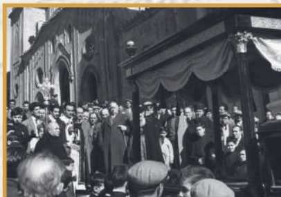
Un funerale con il carro funebre del Comune.