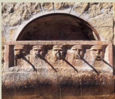
Quando alla Fontana Vecchia l'acqua scorreva da tutti i "canoli"