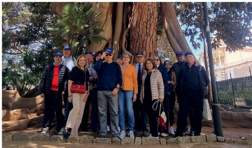
99esimo corso AUC a Palermo con le consorti

plemento, nel luglio del 1981, ognuno di noi ritornò nel proprio ambiente con un nuovo bagaglio di informazioni, di emozioni e di relazioni che sicuramente hanno arricchito e formato il nostro carattere. "Avanti è la vita", motto dell'8° Reggimento Guastatori del Genio nonché marcia musicale concertistica, ci ricorda di guardare sempre avanti nella vita con coraggio, speranza e armonia. I contatti si persero di nuovo! Allora, non esistevano ancora i telefonini ed i computer, né tantomeno Facebook o WhatsApp, e mantenere i contatti con i commilitoni ed amici era quasi impossibile. Le telefonate si facevano con il telefono di casa, per chi lo possedeva, o dalle cabine con i telefoni a gettoni e costavano abbastanza, specialmente quelle in teleselezione. I legami, con una cartolina, spedita al momento dal vicino tabaccaio, erano i più appropriati e tracciavano un indelebile segno di affetto per la persona a cui scrivevi.