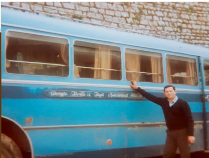
Anni sessanta, autobus ed autista della ditta Floria fotografati di fronte alle scuole elementari.