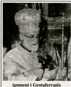
igumeni i Grotaferratës

Dopo 550 anni, i sacerdoti arbëreshë non possono tirarsi indietro - con i loro Vescovi in testa - e dire che da oggi in poi, dentro le Chiese arbëreshe, gli interessa solo il rito bizantino e non anche la lingua arbëreshe! Ambedue vanno difesi. Il rito bizantino e la lingua arbëreshe sono tutt'uno con la storia degli Arbëreshë. Carne e ossa dello stesso corpo.