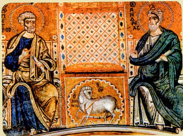
Basilica di Santa Maria di Grottaferrata - Iconografia liturgica del trono vuoto preparato per il giudizio (ai lati) gli Apostoli Pietro e Andrea, patroni di Roma e Costantinopoli - (mosaico dell'arco trionfale) - secolo XIII - particolare