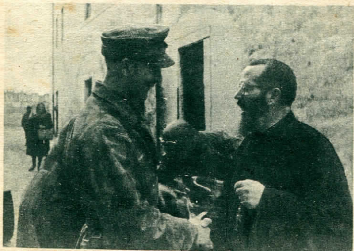
L'Abate ringrazia il soldato germanico e gli esprime tutta la sua gratitudine e ammirazione.