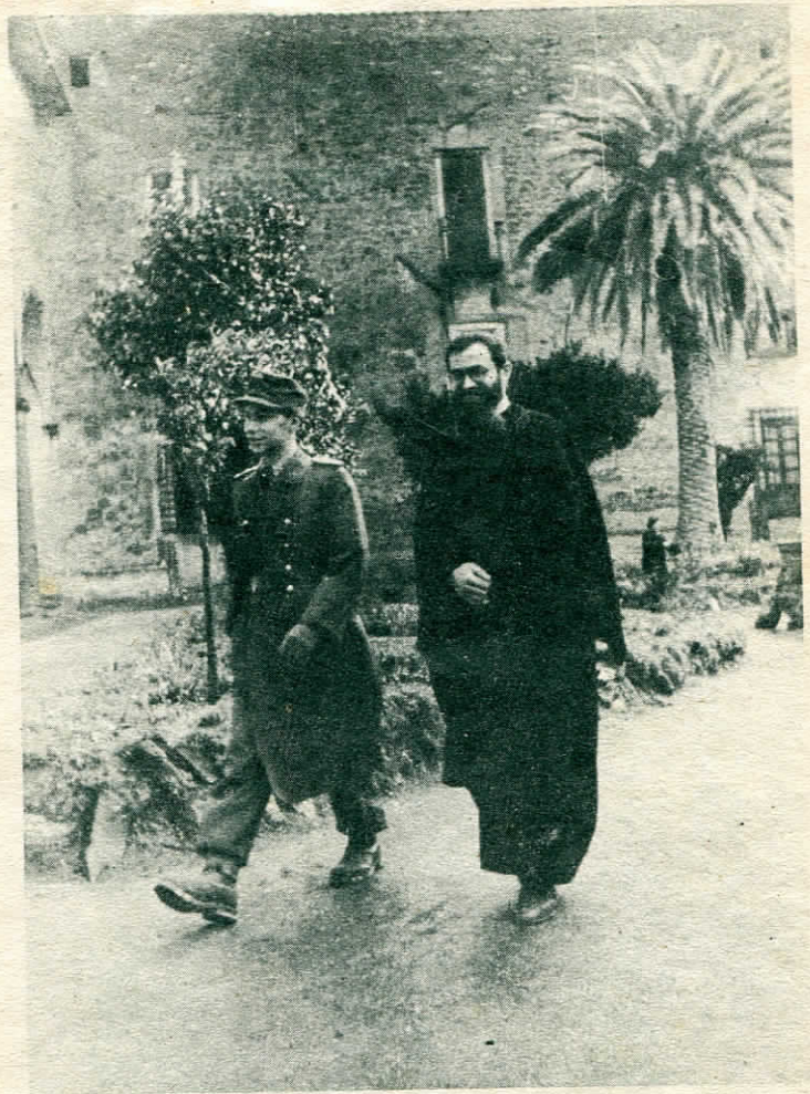
L'Abate accompagna l'artificiere germanico sul luogo ove giace la bomba inesplosa.