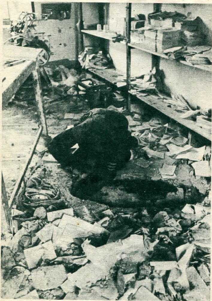
L'artificiere germanico, dopo aver constatato la posizione della spoletta, procede alla delicata e pericolosa operazione di disattivamento della bomba.