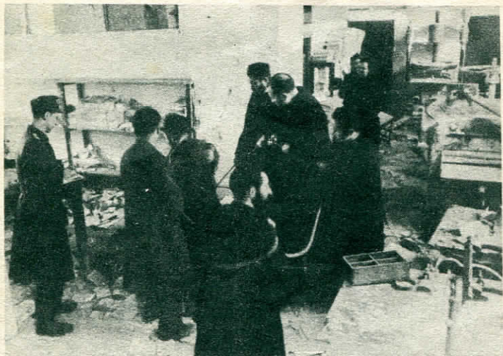
Monaci, e famigli, ormai assicurati aiutano il soldato a sollevare la bomba.