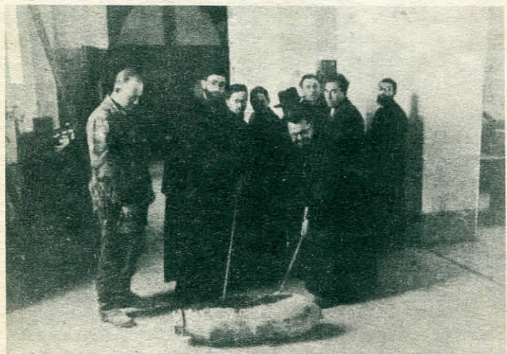
È una grossa bomba americana da 100 chilogrammi la cui esplosione avrebbe causato danni irreparabili.