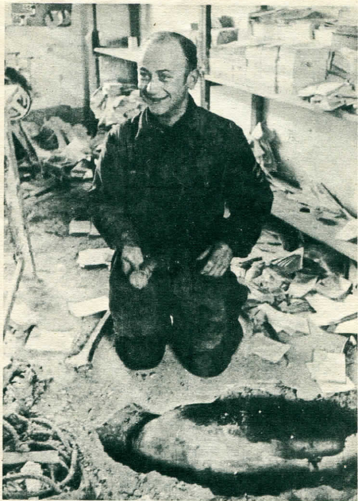
Fatto! La bomba è ormai innocua. Il soldato germanico sorride soddisfatto.