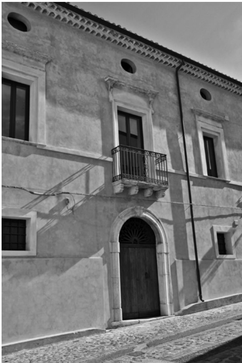
Palazzo De Rada, sede della Fondazione omonima.