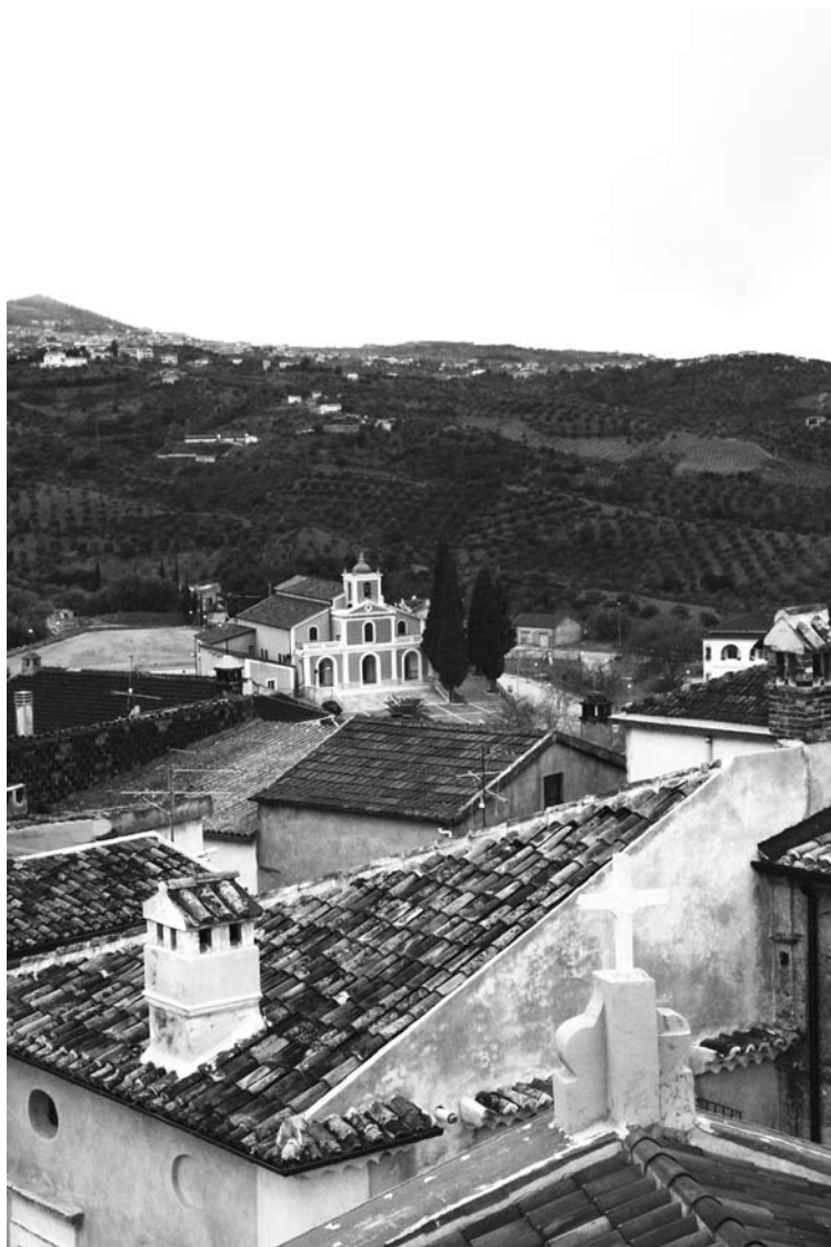
Il Santuario dei Santi Cosma e Damiano visto dal campanile della chiesa parrocchiale.