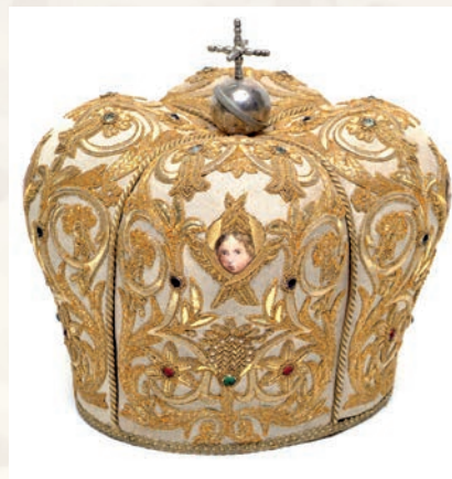
Fig. 2 - Manifattura romana, fine del XIX sec., Mitria, Mezzojuso, San Nicolò di Mira.

all'interno della custodia in cui c'è scritto: «G. Romanini/ Parati sacri e ricami/ Via Torre Millina 26 Roma», ed è cronologicamente da assegnare agli anni del vescovato del suddetto presule 12 .