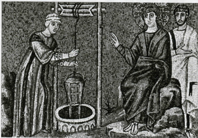
Colloquio di Gesù con la Samaritana - Ravenna, S. Apollinare Nuovo (Mosaico del sec. VI)

Santa Cinquantina. Si ispira direttamente al Vangelo di Giovanni letto in questa occasione (13) e che inizia con le parole: « a metà della festa, Gesù salì al tempio e vi insegnava ». La festa di cui si parla è la festa dei Tabernacoli (14). Questa festa durava alcuni giorni. Gesù sale al tempio il giorno centrale di questa festa e lì insegna. Il Vangelo presenta dunque un duplice ricordo, quello della festa ebraica evocatrice dell'Antica Alleanza, e quello dell'insegnamento che Gesù prodigava nel tempio in questa occasione. Severiano di Gabala (+ dopo 408) commenta il fatto dicendo: « Gesù salì al tempio ed insegnava... parlava nel tempio per adempiere la profezia che dice: e subito entrerà nel suo tempio il Signore, che voi cercate, l'Angelo dell'Alleanza che voi sospirate » (15). Il testo evangelico riferisce dunque l'insegnamento di Cristo, Signore e Angelo dell'Alleanza Nuova, nei giorni della sua vita terrena. Teodoro Studita (+ 826), in una sua omelia sulla Mezzapentecoste, spiega il fatto: « a metà della festa, Gesù salì al tempio ed insegnava... Queste cose succedevano prima della Passione. Adesso, dopo la Risurrezione, Gesù appare ai suoi Discepoli e vive con loro e li inizia ai misteri più profondi » (16). L'insegnamento iniziato prima della morte viene ripreso ed approfondito e gli Apostoli, sotto la guida del Risuscitato, ne scoprono i significati più profondi, un po' come per i Discepoli di Emmaus: Egli spiegava loro ciò che si riferi-