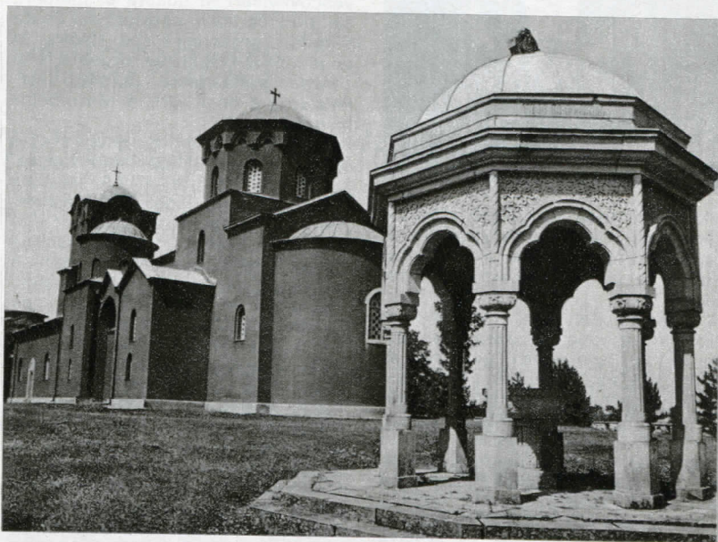
Antico Monastero di Zica (Jugoslavia)

Altri temi trattati sono stati quelli della incarnazione della fede nelle varie culture, della fedeltà alla tradizione vivente della Chiesa, dell'unità della fede e della varietà di espressioni di vita cristiana.