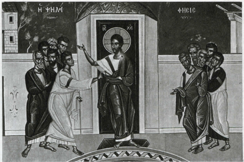
Apparizione del Risorto agli Undici: Tommaso tocca il Risorto Affresco di R. Kopsidis e G. Chochlidakis, Monastero di Christovogne-Belgio.

Vangeli dunque di iniziazione cristiana ai misteri della Fede, attorno alla Parola proferita da Cristo ed ai Segni da Lui compiuti. Occorre notare il significato battesimale delle pericopi evangeliche lette in questi giorni. Si ritrovano nella antica liturgia latina di preparazione al Battesimo durante la Quaresima nelle celebrazioni degli Scrutini o riunioni di preghiere catecumenali. Queste letture erano accompagnate da Prefazi speciali che ne indicavano il valore battesimale (21). Anche la catechesi battesimale primitiva conosceva questi Vangeli come risulta dagli affreschi dei più antichi battisteri paleocristiani. Così verso gli anni 230 a Dura Europos nel Patriarcato di Antiochia dove, accanto alla rappresentazione del Buon Pastore, si trovano anche la Samaritana ed il