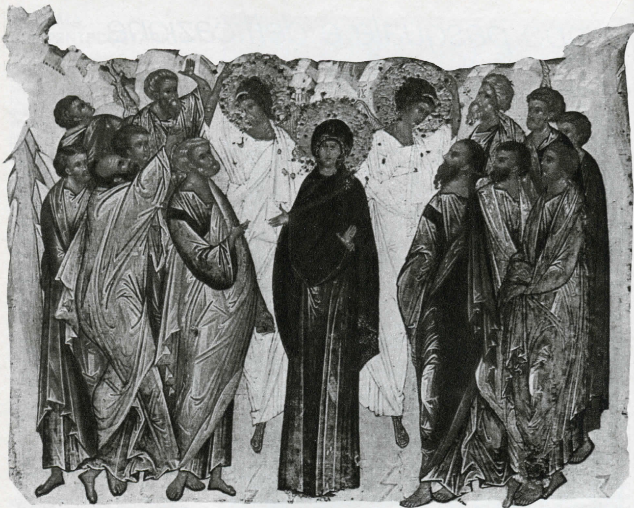
Ascensione (part.) - Scuola di Rublev, sec. XV (Mosca)