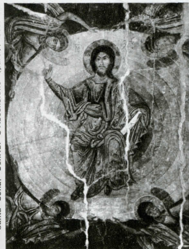
Santa Sofia, Ochrid: L'Ascensione (part.), sec. XI