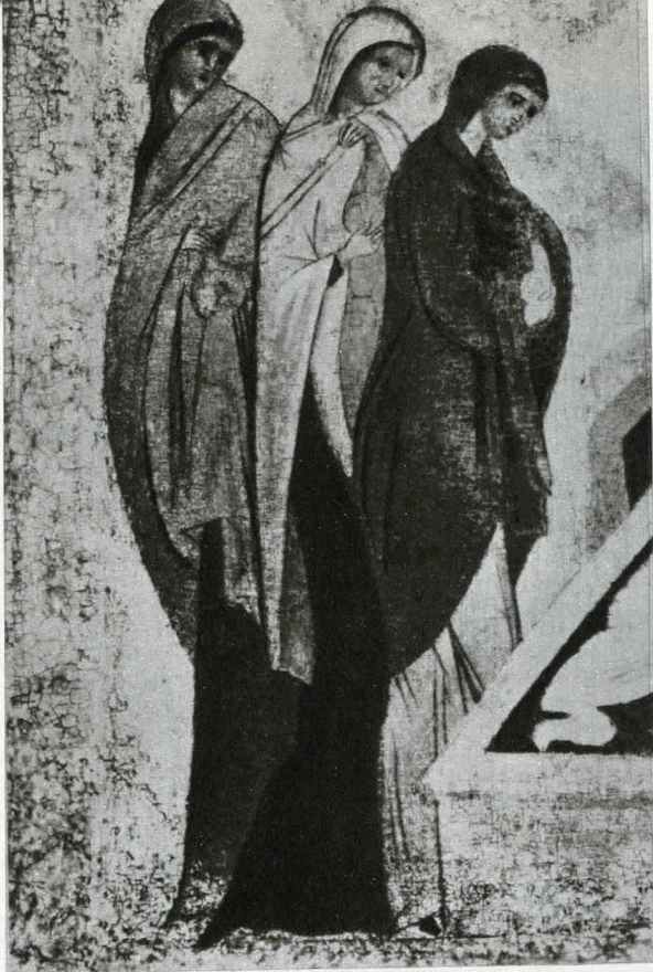
Le Mirofore (part.) Scuola di Rublev, Zagorsk, Cattedrale della Trinità

grande desiderio, conoscenza retta e gioia dell'anima», ecc.