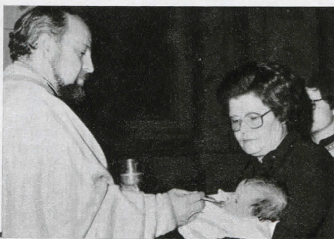
Foto: Sequenza sui Sacramenti di Iniziazione Cristiana - S. Atanasio (Roma): Chiesa italo-albanese.

sione dal battistero alla Chiesa riunita per celebrare l'eucaristia che li accoglieva subito prima della lettura dell'epistola con il canto: « Voi tutti che siete stati battezzati in Cristo, vi siete rivestiti del Cristo, Alleluia ».