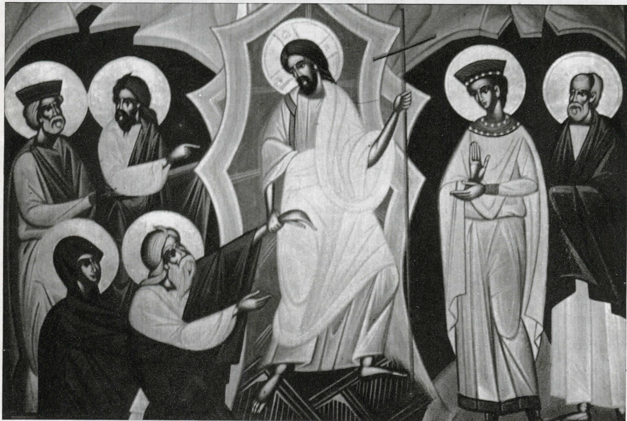
Icona della Resurrezione

Quando sei sceso nella morte, o Vita immortale, tu hai ucciso l'Ade con lo splendore della tua divinità; e quando hai risuscitato i morti dalle regioni sotterranee, tutte le potenze celesti gridavano: Cristo donatore di vita, Dio nostro, gloria a te!