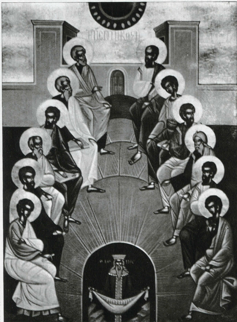
Icona della Pentecoste