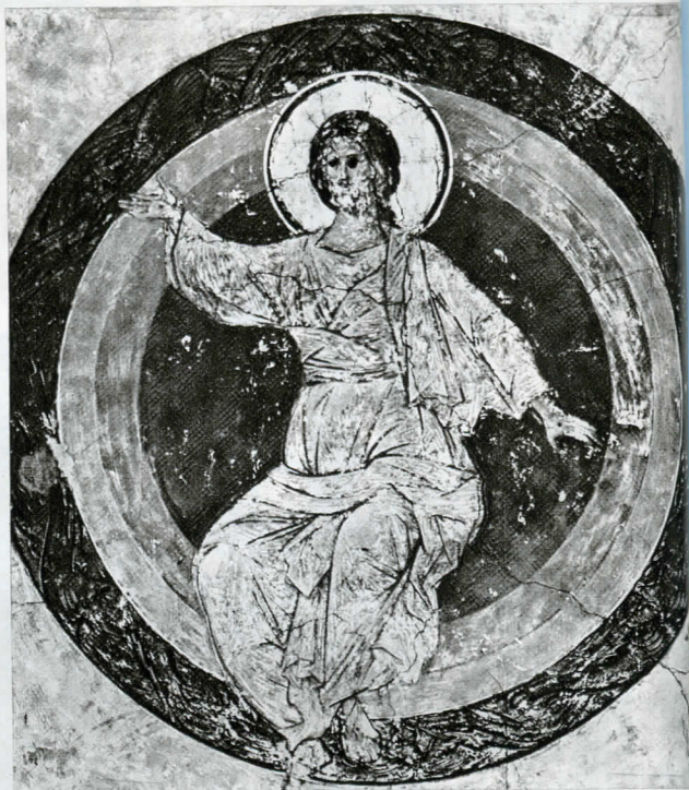
Il Cristo glorioso (Rublev)

Già Giustino (sec. II) poi Origene , S. Atanasio ,