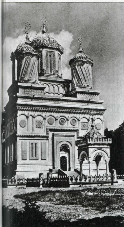
Romania: Chiesa del Monastero di Curtea de Arges (secolo XVI)

noi e per altro eredi privilegiati della tradizione orientale presso di noi, perché sono rimasti albanesi e sono diventati siciliani. Così che quando durante il nostro secolo l'animo cristiano di Sicilia ha colto l'urgenza di un rinnovamento della tensione ecumenica nella coscienza ecclesiale, essi sono stati tra i principali promotori di rivalizzazione ».