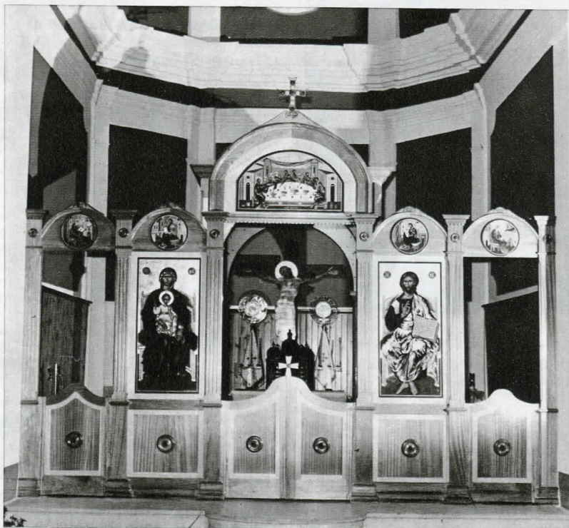
Nuovo Iconostasio in s. Giorgio Albanese - Eparchia di Lungro in Calabria

L'antichissima esperienza liturgica e la tradizione delle Chiese locali dell'Italia del Sud e della Sicilia, confrontata con la teologia dei Padri Greci e Latini della Chiesa indivisa, ha costituito la base ferma e immobile sulla quale è fondata tutta la vita ecclesiastica. Questa costante attenzione di queste Chiese alla tradizione ecclesiastica le ha fatte diventare solide nell'ortodossia della fede. Perciò queste Chiese, sia fino allo scisma sotto l'influsso del Trono di Costantinopoli sia in se-