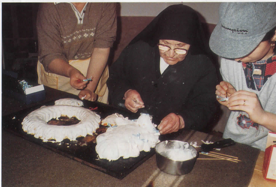
Si preparano varba, curuna e palumma