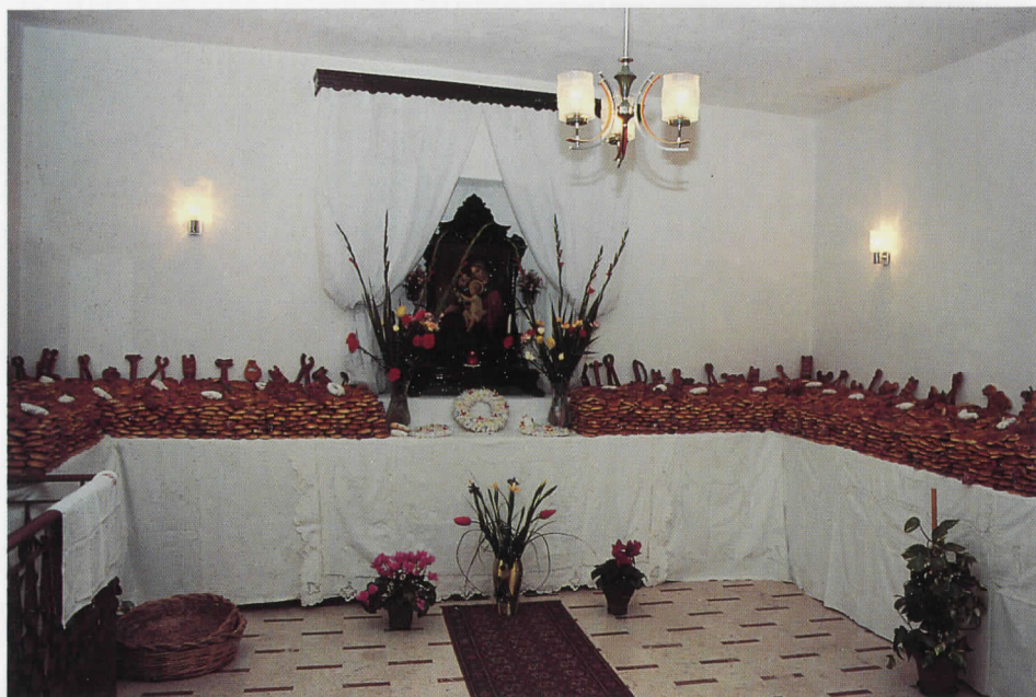
Altare con i "panuzza"