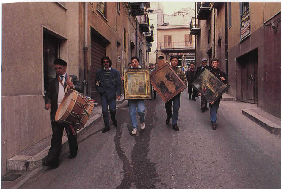
Distribuzione dei Quadri alle famiglie (foto Di Miceli, 1990)