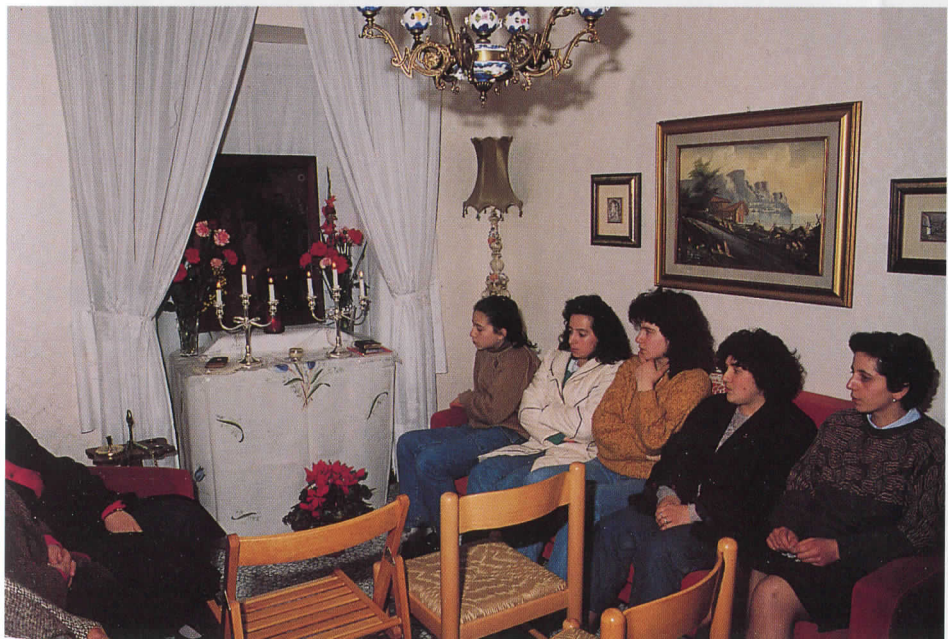
Canto del Rosario