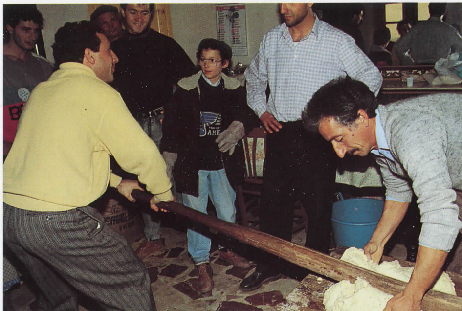
Uso della "Sbria" per la gramolatura della pasta dei "panuzza"