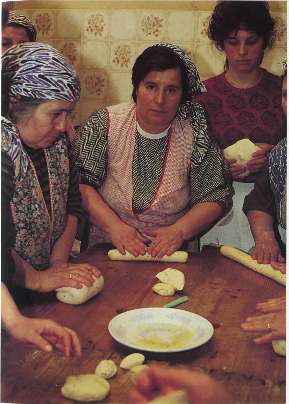
Preparazione dei "panuzza" (foto Di Miceli, 1988)