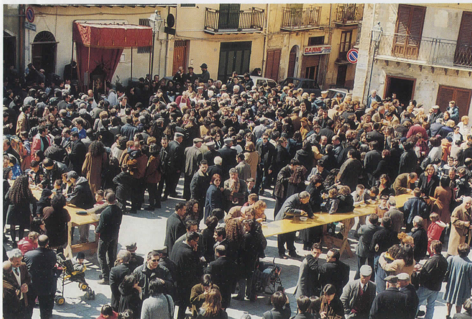
Distribuzione e consumazione della minestra