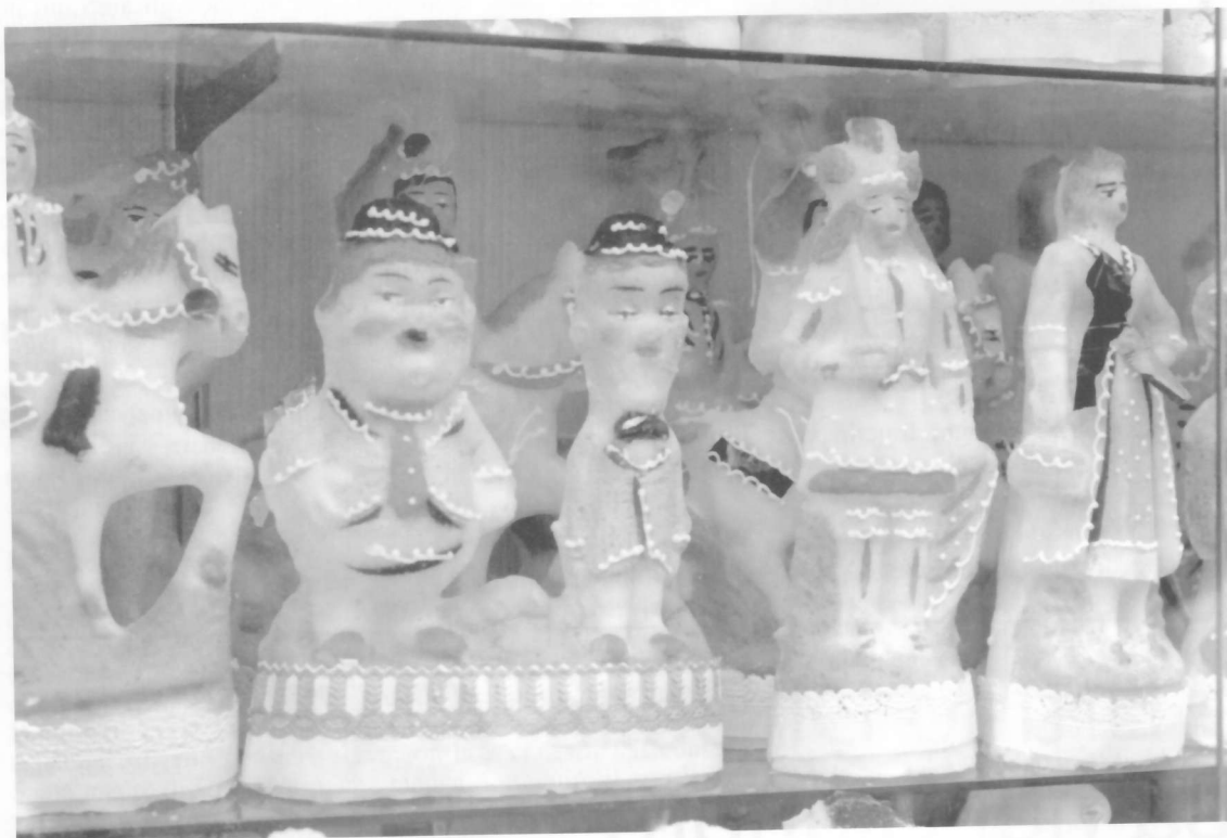
Mezzojuso, festa dei morti, 1985

morti vengono dalla terra o, meglio, da sottoterra, luogo in cui i semi sono, per così dire, "sepolti" e "restituiti" dalla terra sotto forma di prodotti commestibili. In tal senso le offerte fatte "ai morti" sono nel contempo fatte "dai morti". Fra i vivi ed i morti si instaura una sorta di reciproco scambio di offerte alimentari. Una caratteristica di questa festa è appunto il "commensalismo": vivi e morti, partecipando allo stesso banchetto, rinsaldano i legami di