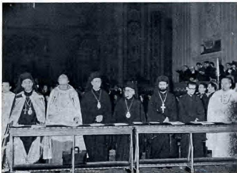
La Delegazione ort. costantinopolitana al Vaticano II - 7 dic. 1965.

Speriamo, dunque, che il Primate della nostra Chiesa smentirà le sue ultime dichiarazioni perchè altrimenti arrecherà un danno assai grave alla Chiesa e alla Nazione ellenica».