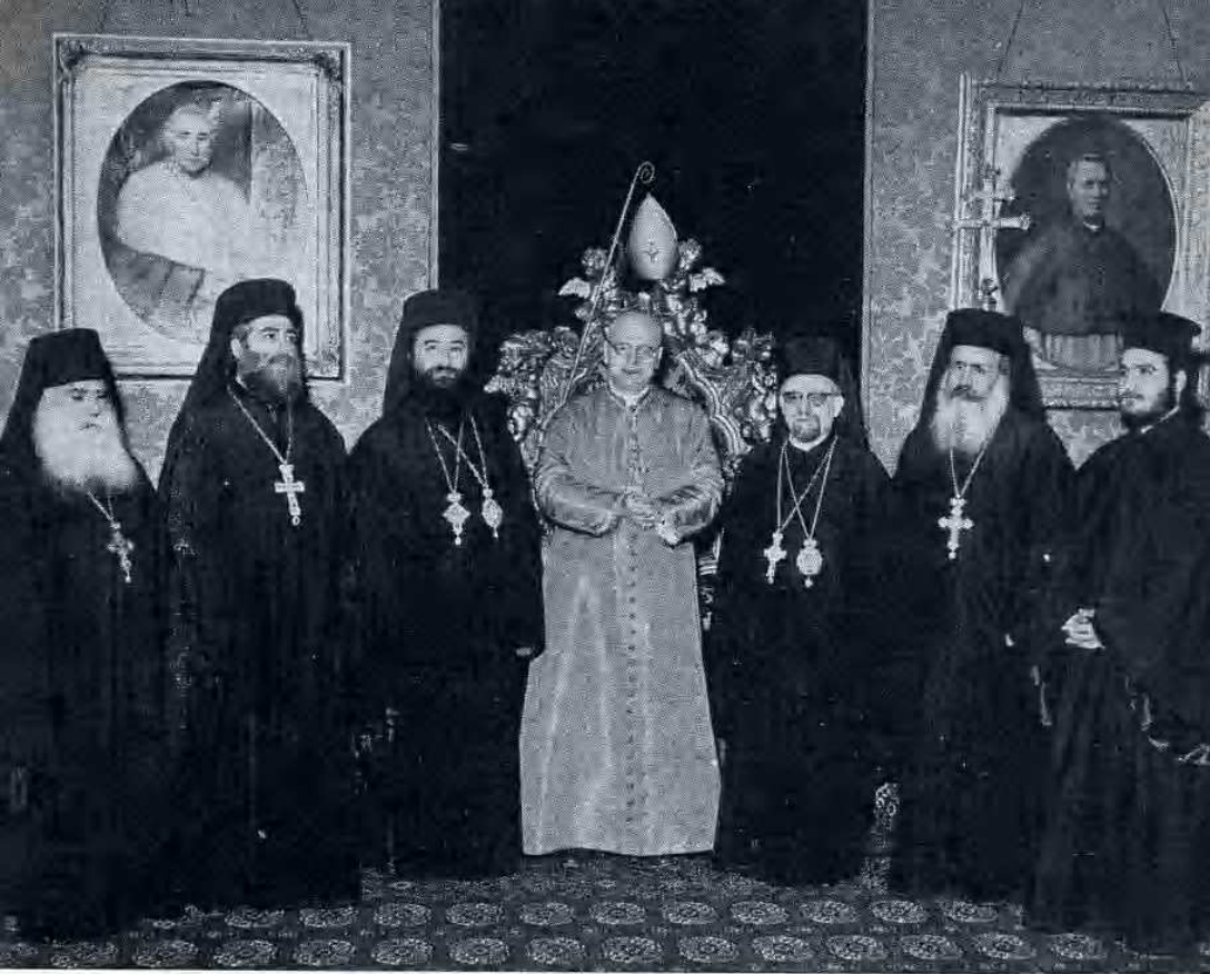
L'Em.mo Card. Urbani tra i membri della Delegazione ortodossa.

il monastero e costruì un piccolo oratorio dove innalzò un altare consacrato e quando riceveva la visita di qualche sacerdote gli faceva su esso celebrare la divina liturgia.