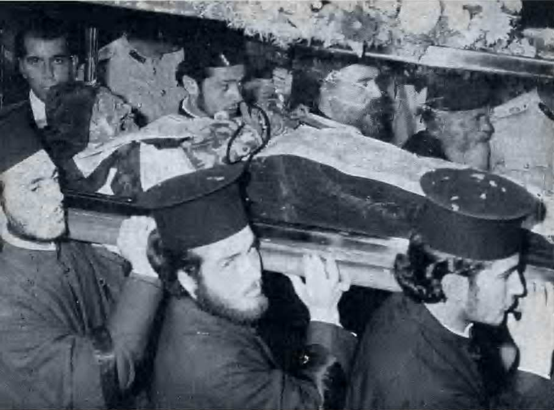
S. Saba portato a spalla per le vie di Gerusalemme.