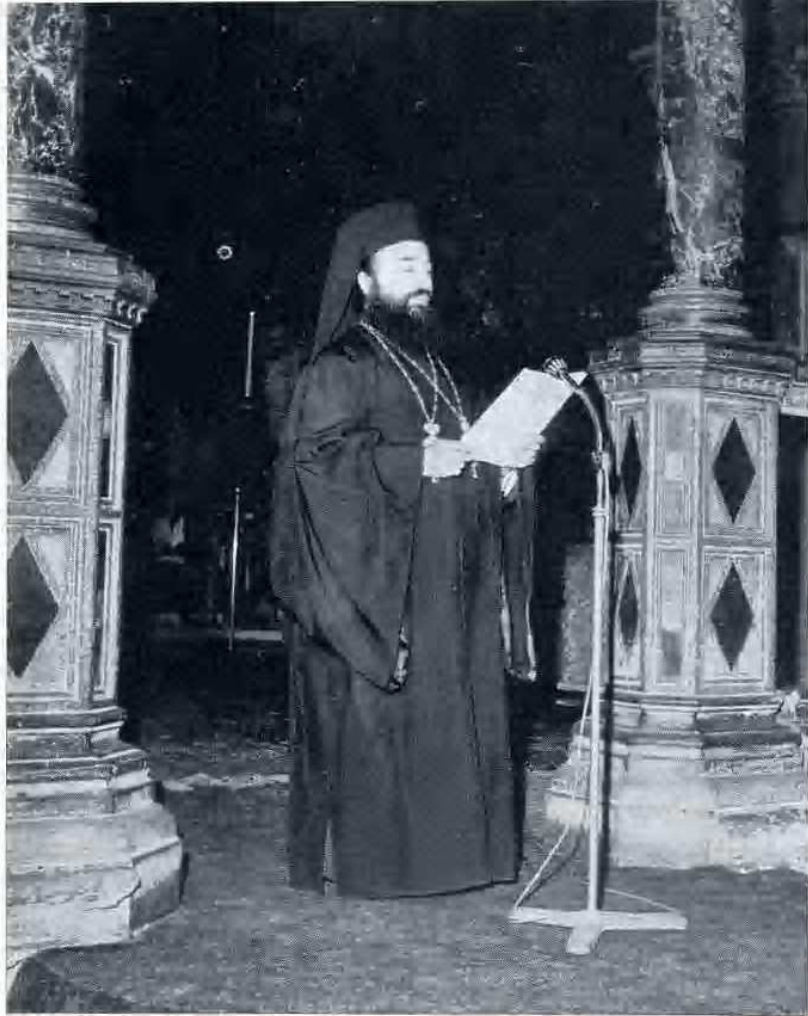
S. E. Mons. Basilios ringrazia per la consegna delle reliquie.

re, con quel denaro egli potè non solo provvedere alla costruzione delle celle per il monastero di Gerusalemme, ma anche costruirne altre nel cenobio di Castellion e in due altre località, una non lontana dalla torre di David e l'altra a Gerico. Nel frattempo provvide anche a costruire una grande