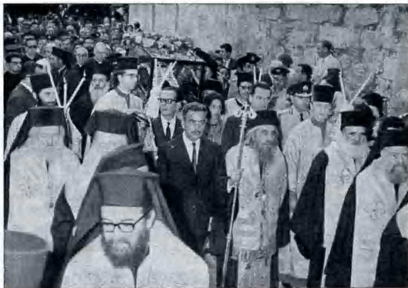
Per le vie di Gerusalemme. Col pastorale in mano S. B. Benedictos e alla sua destra il Governatore, Sig. Daoud Abou-Gazaleh.

re a perorare la causa della sua terra presso l'imperatore Giustiniano e ad invocare il suo intervento contro un gruppo di samaritani che avevano messo a soqquadro tutta la regione e provocato la giusta ira dell'imperatore.