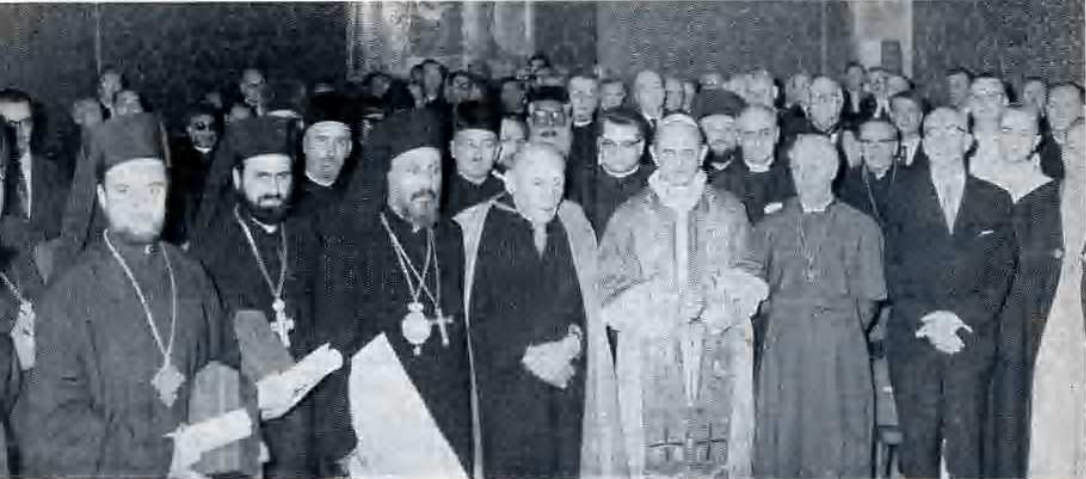
Il S. Padre, Paolo VI, fra gli Osservatori, dopo la celebrazione ecumenica in S. Paolo.

pellegrinaggio è la S. Scrittura e la Tradizione (paragrafo 14); anzi, a supremo conforto, è affermato poi — al paragrafo 21 capitolo III — che Cristo stesso dirige e ordina, pur sedendo alla destra del Padre, il Popolo del Nuovo Testamento nella sua terrestre peregrinazione verso l'eterna beatitudine.