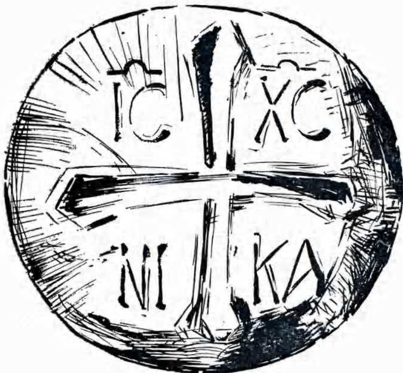
Il pane con impresse IC XC NI KA (Gesù Cristo vince).

che non conviene indagare il modo della trasformazione che rimane un mistero. Per rendere accettabile questo mistero, il santo dottore porta il paragone dell'assimilazione del cibo, come già S. Cirillo di Gerusalemme aveva portato l'esempio della trasformazione dell'acqua in vino alle nozze di Cana: « Un'altra volta, in Cana della Galilea, Egli ha mutato l'acqua in vino con un atto solo della propria volontà e perchè ora che cambia il vino in sangue non dovremmo credergli? » (37).