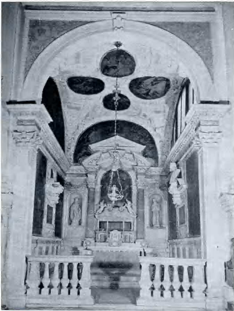
La Cappella di S. Saba in S. Antonin (Venezia) che ospitò per tanti secoli le venerate reliquie.

sua preghiera ed infatti, disceso, trovò l'acqua che usciva come da una sorgente. Da quel giorno la acqua non mancò mai e benché non fosse nè troppo abbondante di