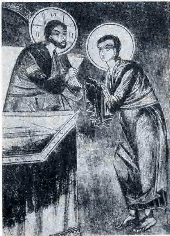
Comunione di S. Giovanni - Atene.

E' la stessa concezione dell'Eucaristia come cibo dell'uomo, cibo adatto alla sua vera natura originale, che richiede la transustanziazione di tutto il pane e di tutto il vino della santa offerta. Vi abbiamo già fatto cenno nel sacramento del battesimo. Per i Padri orientali, l'uomo è stato creato per essere rivestito di gloria, indirizzato verso l'alto, fatto per la vita soprannaturale, la vita della Grazia, per cui il suo vero cibo era l'albero della vita. Il cibo materiale, al pari della