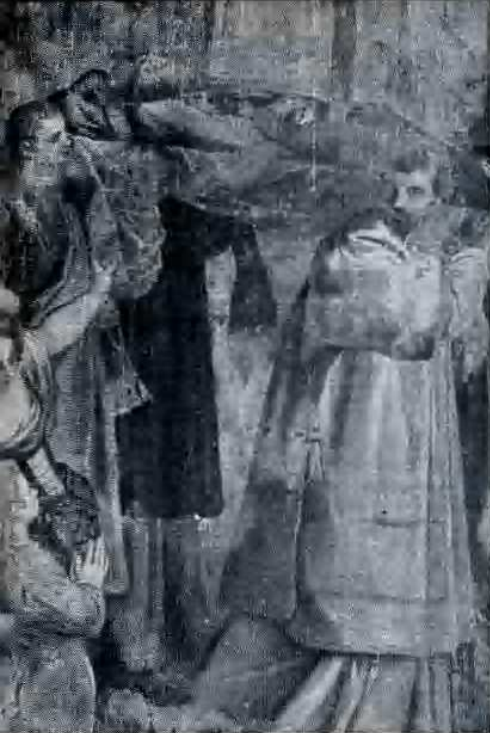
Affresco della Cappella di S. Saba in S. Antonin (Venezia).