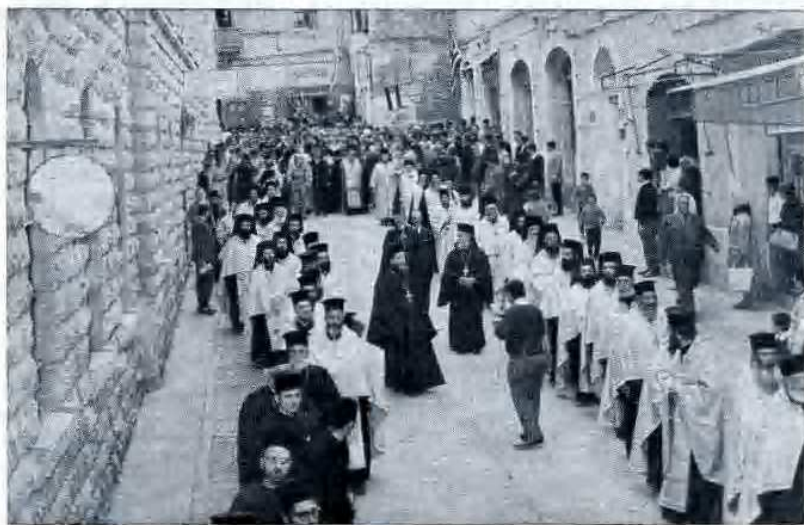
Il Clero sfilava in processione verso il S. Sepolcro.

a Scitopoli che dal vescovo di quella città, Procopio, gli venne presentato, un giovanetto di nome Cirillo, sul quale egli poggiando la mano disse: «Ecco il mio discepolo Cirillo». Quella mano posata sul suo capo fu continuamente ricordata da Cirillo, che, come dicemmo, descrisse poi e narrò nei minimi particolari la vita di San Saba, monaco ed asceta palestinese.