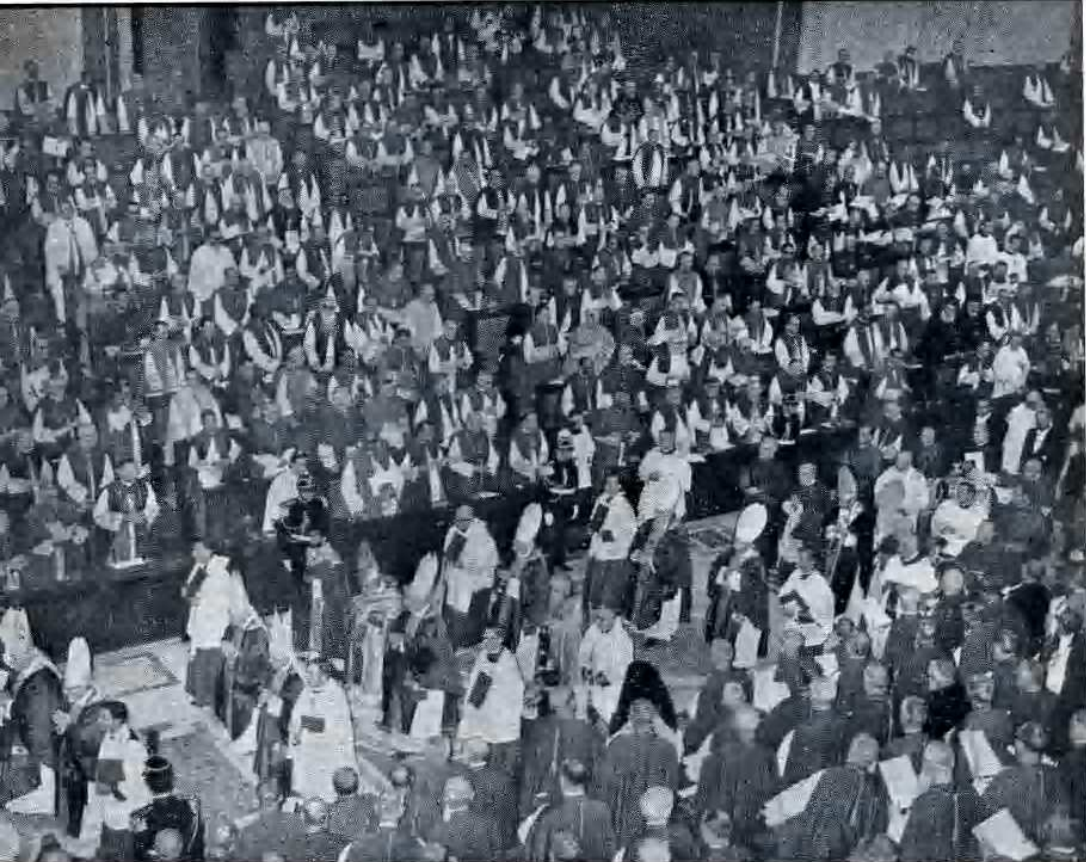
L'aula conciliare del Vaticano II, durante una Congregazione generale della IV sessione.

ecclesiale per antonomasia. Poter costatare ciò è cosa assai bella e significativa nell'ora che volge!