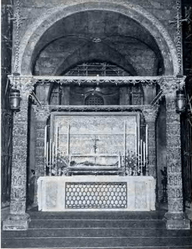
Il corpo di S. Saba collocato in S. Marco fra la Pala d'oro e l'Altare.

dispersi nei dintorni della Torre di David.