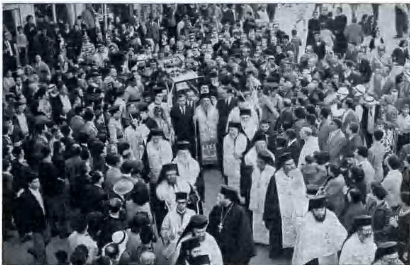
Processione verso il S. Sepolcro, presieduta dal Patriarca Benedictos.

Quando S. Saba con gli altri inviati arrivarono a Costantinopoli e fu annunciata la loro venuta all'imperatore, essi furono tutti invitati a recarsi al palazzo imperiale. Quando la delegazione venne fatta entrare, le guardie del palazzo, avendo visto per ultimo un uomo mal vestito e con le vesti rattoppate, pensando fosse qual-