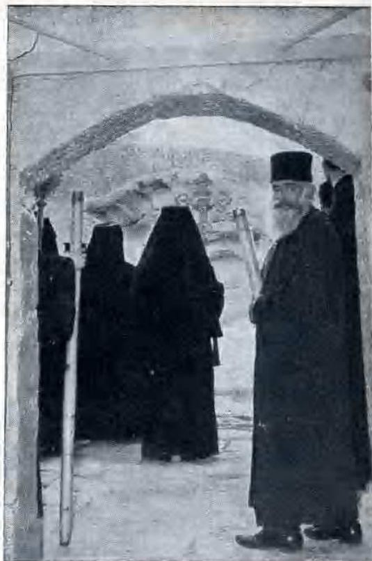
I monaci attendono il loro Fondatore e Padre.