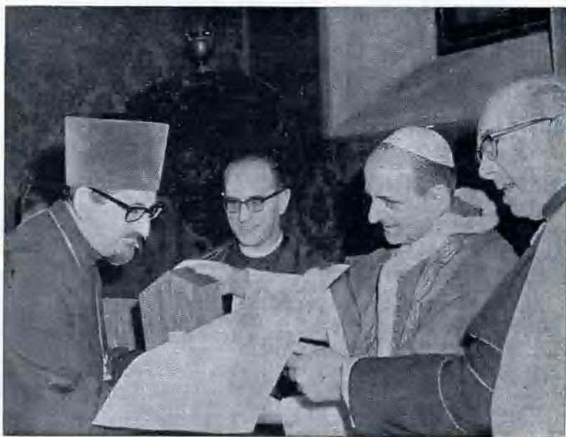
Paolo VI con l'Arciprete Borovoy, del Patriarcato di Mosca.

La Chiesa peregrinante si trova continuamente riunita e rinsaldata nella agàpe del banchetto eucaristico in cui il vescovo, circondato dal suo presbyterium nella koinonia della concelebrazione, è il « sacramento-persona » della Chiesa stessa. Infatti il vescovo è l'unico responsabile e guida di tutta la Liturgia sacrificale e