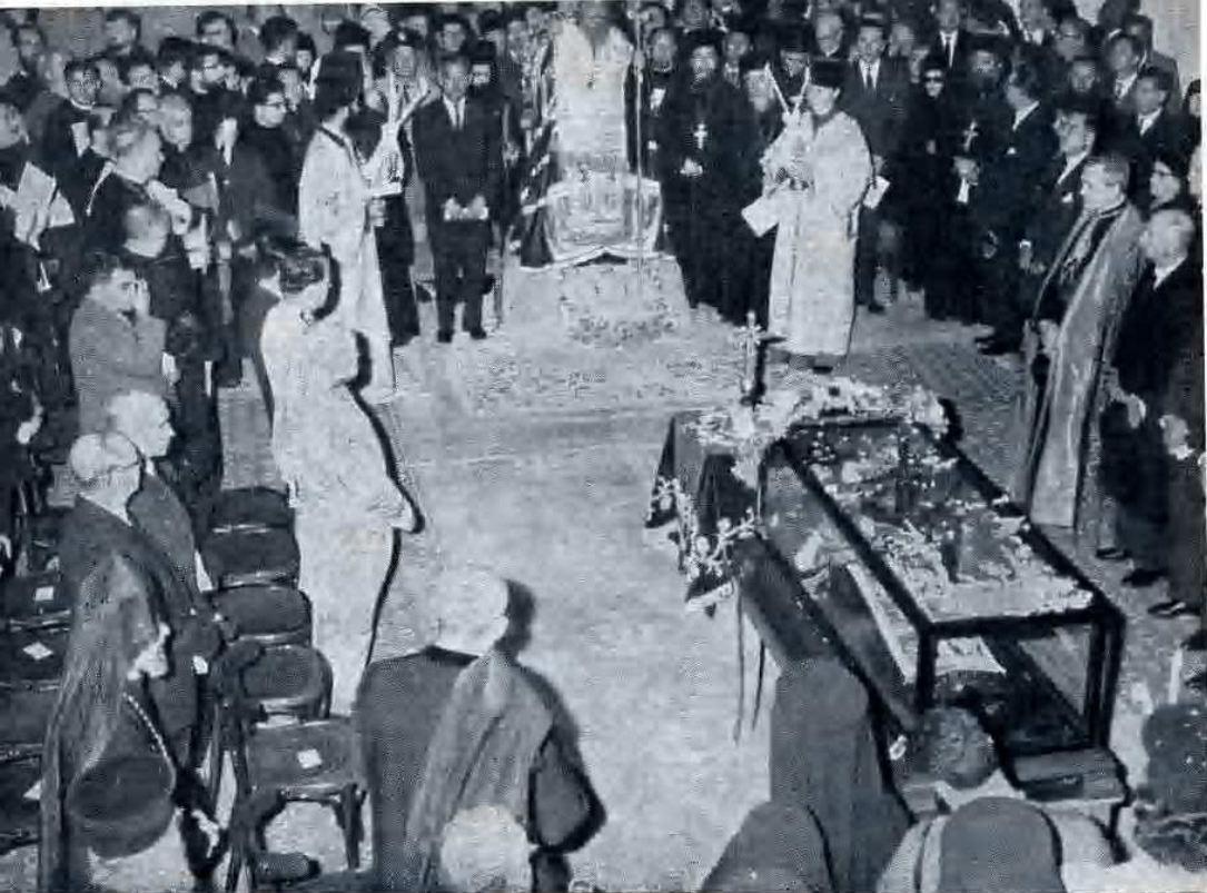
Solenne cerimonia religiosa al S. Sepolcro.

Il 22, alle ore 10.30, ebbe luogo la ricognizione ufficiale del corpo di S. Saba: alle ore 16, una conferenza stampa, organizzata dalla « Voce di S. Marco ».