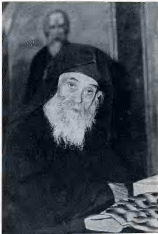
Tipica figura di monaco sabaita.

Egli segue la via maestra della Chiesa ortodossa e, per dirla se-