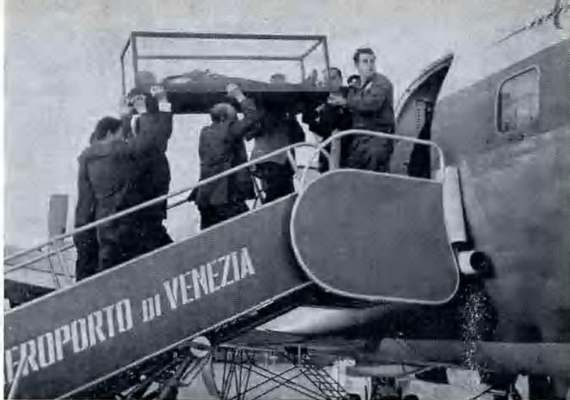
Le sacre spoglie di S. Saba portate sull'aereo che le condurrà nella sua patria palestinese.

no avvenne un contrasto fra i monaci che celebravano in lingua greca e i monaci Armeni, perchè questi ultimi nel cantare l'inno detto trisagio avevano aggiunto la formula « che è stato crocefisso per noi », formula rigettata dai greci perchè ritenuta eretica. Saba ordinò allora che questo inno venisse cantato solamente in greco e così il contrasto venne tolto.