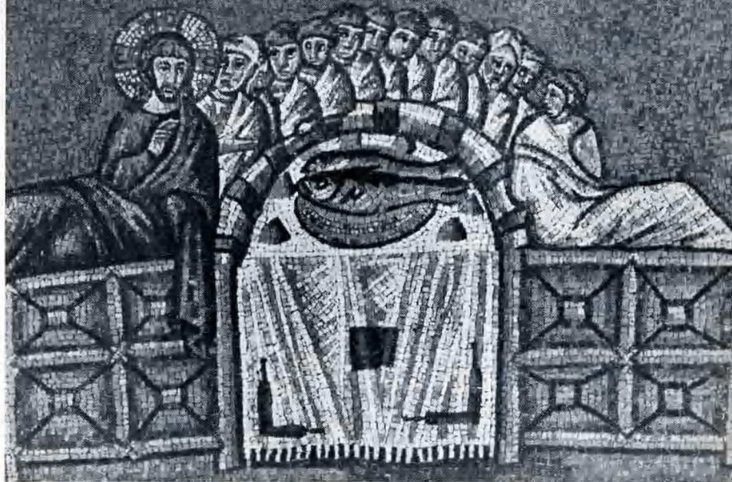
Mistica cena, Mosaico in S. Apollinare Nuovo - Ravenna.

Il pane per la liturgia ha nelle chiese bizantine forma rotonda, come il pane che si faceva in casa anche in Italia e si fa ancora in molte famiglie. Porta impresso un cerchio contenente una croce con le sigle IC - XC - NI - KA (Gesù Cristo vince). Viene preparato dai fedeli nelle famiglie, e portato quindi e da essi offerto alla chiesa per la celebrazione. Da un pane intero o da più pani — generalmente sono cinque — il celebrante toglie con una lancia quanto è necessario per la celebrazione, in dipendenza della comunione sua, dei concelebranti sacerdoti e diaconi e dei fedeli. Il pane della comunione, detto ἄμωζ, agnello è un pezzo unico e tolto da uno solo dei cinque pani offerti. E' necessario che tutti si comunichino dallo stesso pane, come già c'insegnava la Didachè e come sino ad oggi fa la Chiesa greca. Dopo la consacrazione e l'elevazione, il primo celebrante — vescovo o sacerdote — divide il pane consacrato secondo le necessità dei comunicandi. Dagli altri quattro pani vengono invece estratte le cosiddette Μερίδες particelle, una più grande in forma triangolare estratta dal secondo dei cinque pani (se il pane offerto è unico, in