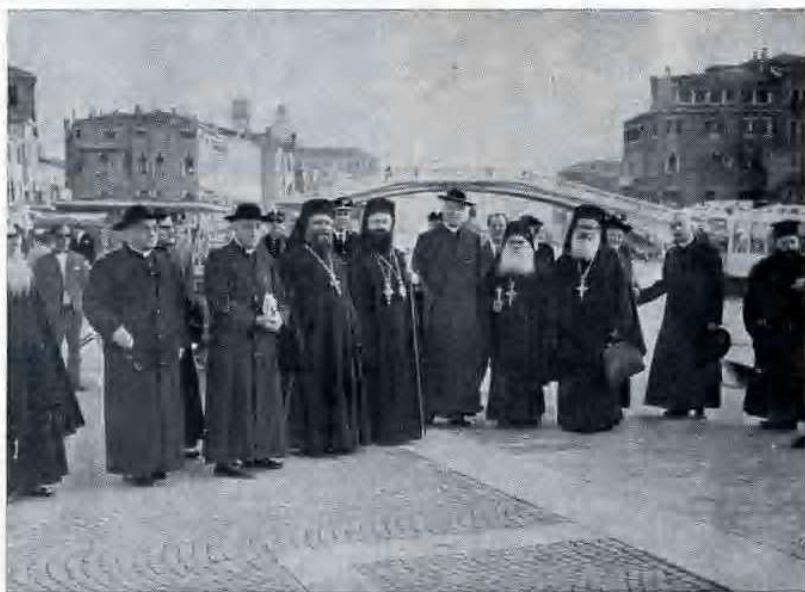
Arrivo a Venezia della Delegazione ort. gerosolomitana.

Per poter dare una conveniente ospitalità a tutti, egli ingrandì