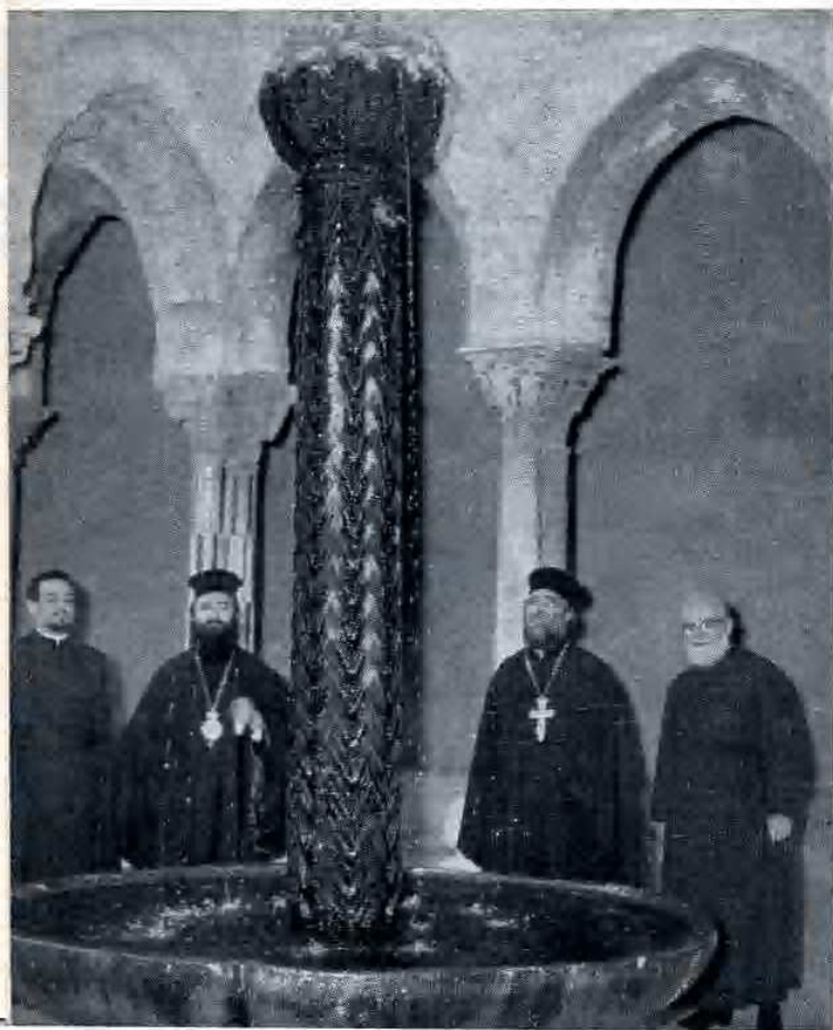
Una foto ricordo al Chiostro di Monreale.

A nulla valsero le insistenze dei suoi famigliari perchè lasciasse il monastero e si dedicasse invece alla cura delle terre paterne; tutto preso dal suo desiderio di solitudine e di raccoglimento, quivi rimase per circa dieci anni, precedendo tutti nella pietà, nell'ob-