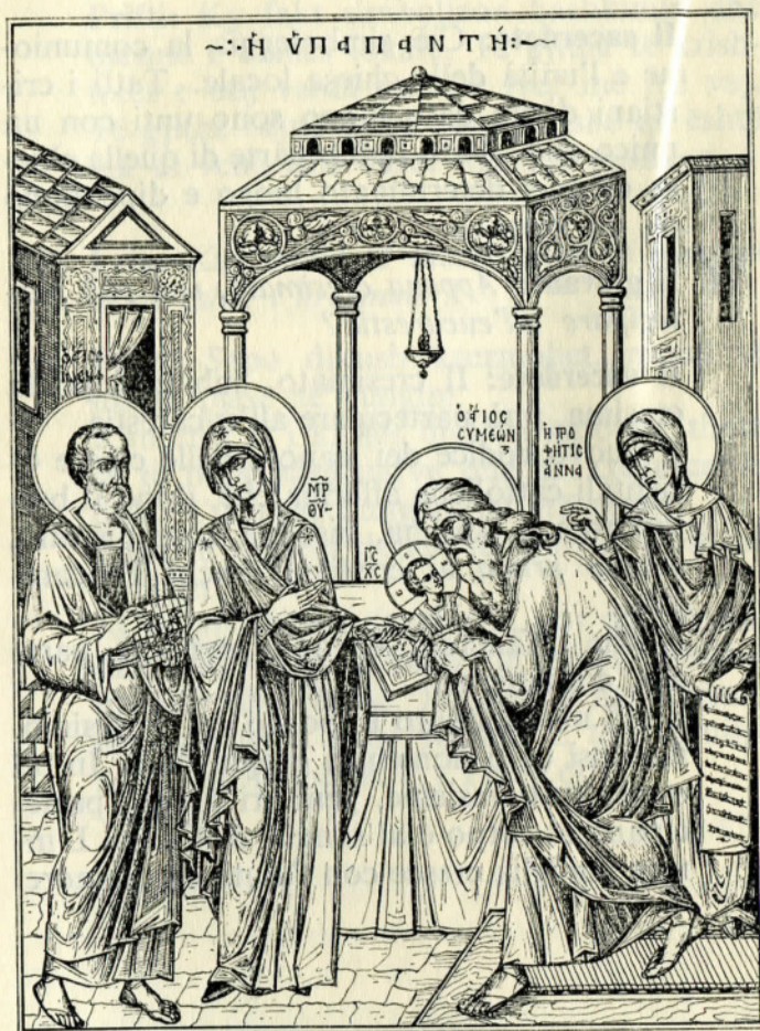
Paraqitja në Tempull e Zotit Krisht Presentazione al Tempio di Gesù Cristo