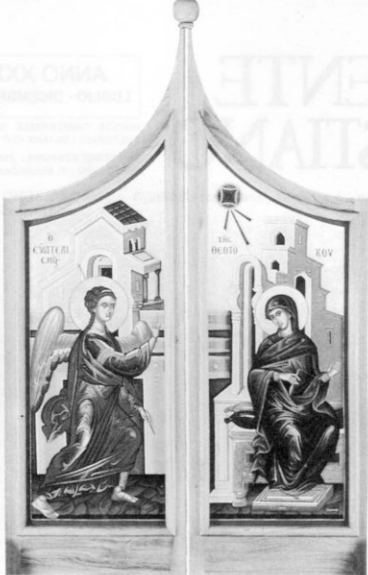
Le porte regali della nuova iconostasi della chiesa di S. Nicolò di Mira in Mezzojuso