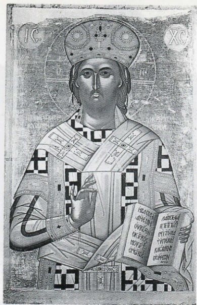
Gesù Cristo, Re dei Re e Sommo Sacerdote XV sec. Monastero Gôniás Kisámou - Creta