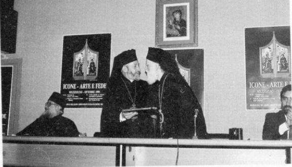
L'abbraccio fraterno e lo scambio di doni tra il Vescovo Sotir (a sinistra) e il Metropolita Ireneo (a destra).

professori e dai chierici. Da questo posto ringraziamo per l'invito e l'accoglienza e per l'onore e per l'amore tutti voi, tutti coloro che abbiamo incontrato e conosciuto fino a questo momento, l'eccellentissimo vostro vescovo, Sotir, il quale ieri sera ci ha accolti all'aeroporto ed insieme con noi ha continuato, insieme a tutti gli altri fratelli, che sono stati insieme a noi, a suscitare nostro stupore per la sua semplicità e cordialità. Esprimiamo la nostra gioia per questo convegno che ha per tema le icone, le quali da secoli sono il centro e il cuore della nostra teologia, dei libri e dei commenti dei cristiani ortodossi; speriamo che Dio benedica il presente convegno e coloro che lo hanno organizzato, il Vescovo e l'eparchia di Piana degli Albanesi, insieme alla commissione per il dialogo ecumenico della Sicilia e tutto il popolo d'Italia e di Sicilia.