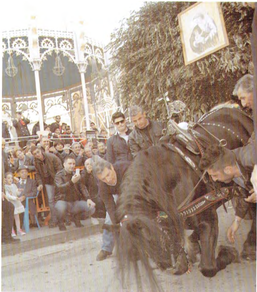
Momenti della Festa di San Giuseppe