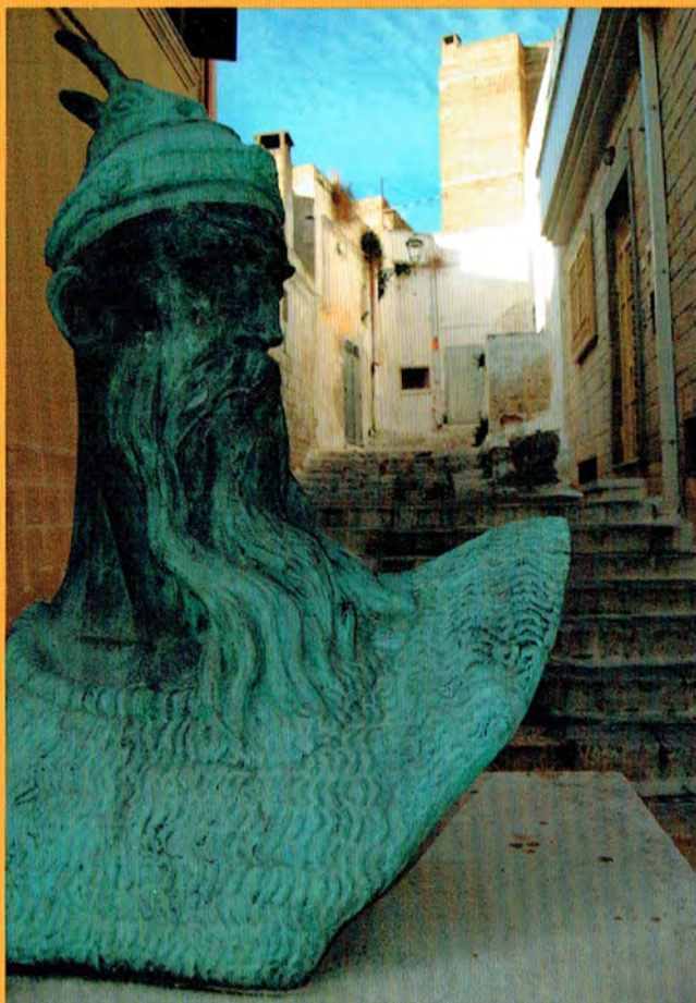
Busto Giorgio Castriota - Skanderbeg - Centro Storico S. Marzano