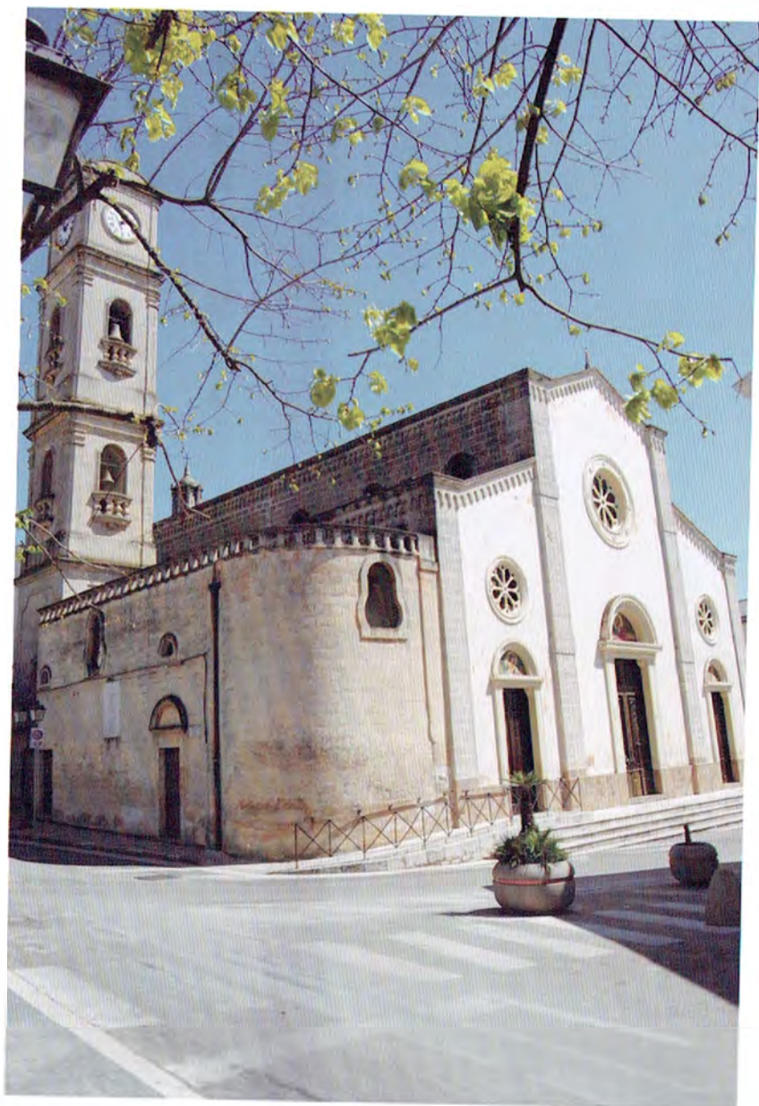
Chiesa Madre prima del restauro