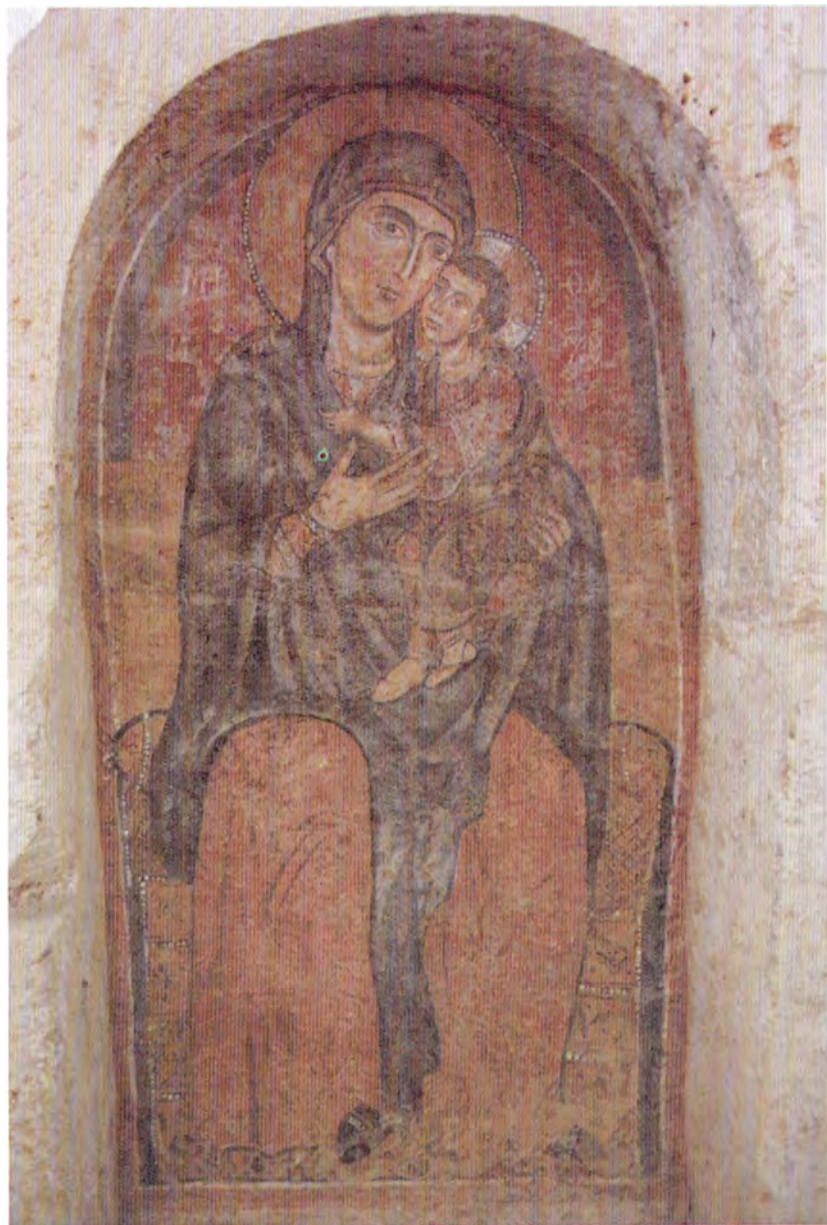
Madonna delle Grazie - San Marzano di S. Giuseppe