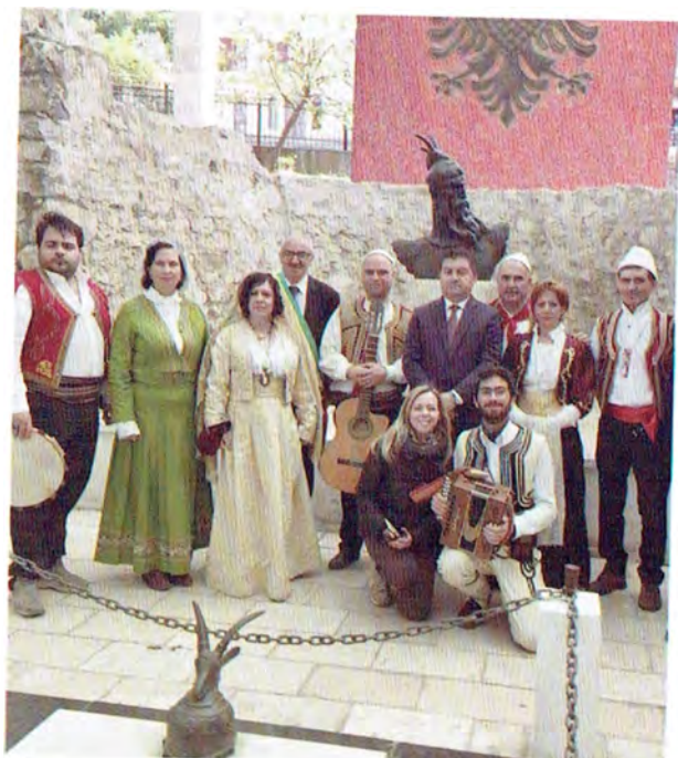
Rappresentanza San Marzano presso la Città di Lezha - Albania