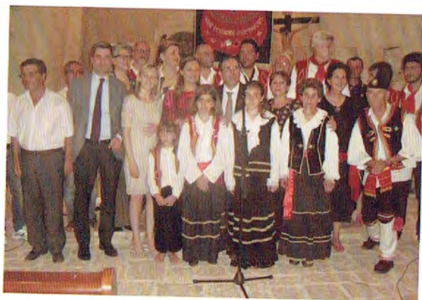
Visita del Ministro dell'integrazione europea Albanese presso il Santuario Madonna delle Grazie