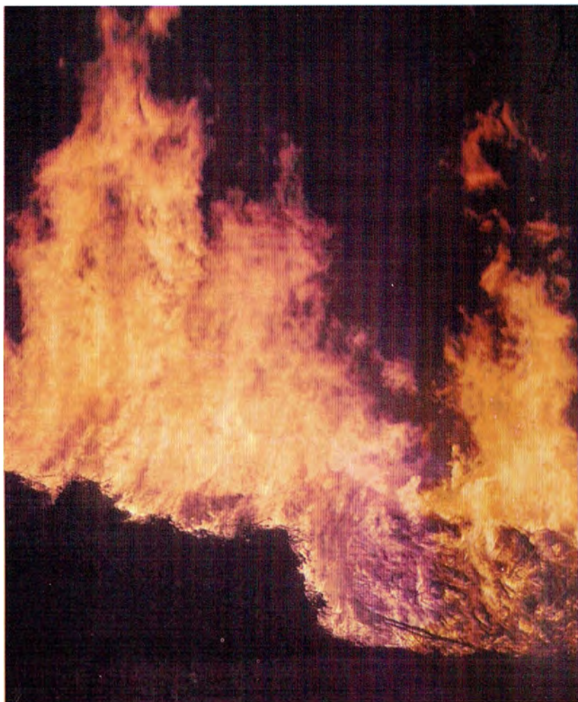
Falò di San Giuseppe