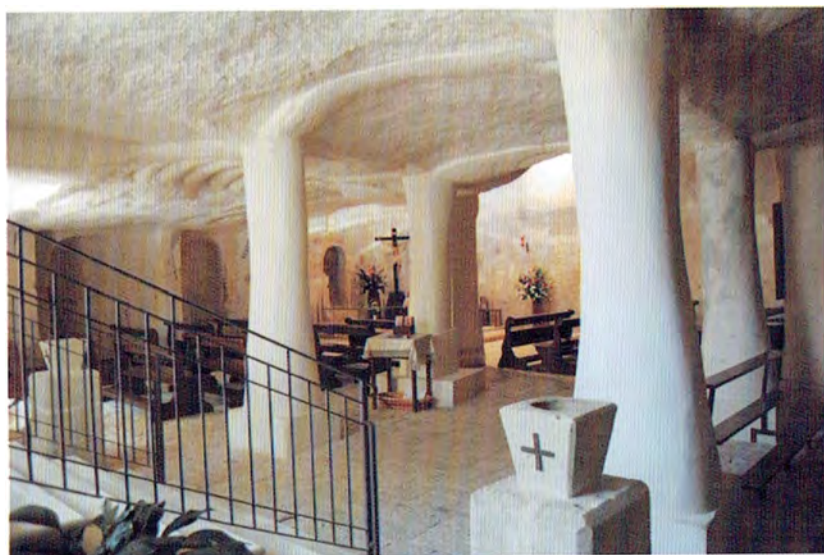
Santuario Rupestre Madonna delle Grazie - (interno)