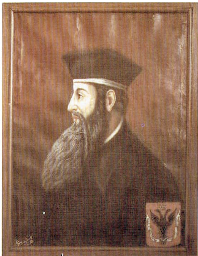
Giorgio Castriota - Skanderbeg - Casa Comunale