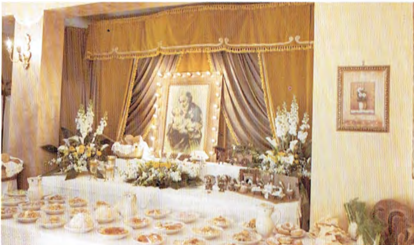
Tavole di San Giuseppe