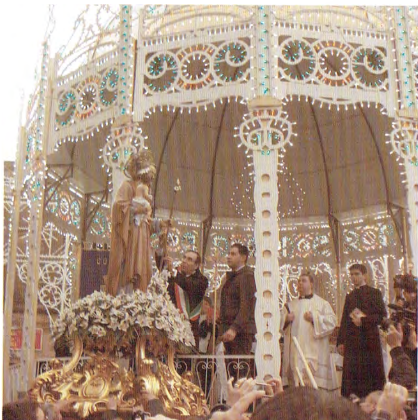
Il Sindaco consegna a San Giuseppe le Chiavi del Paese