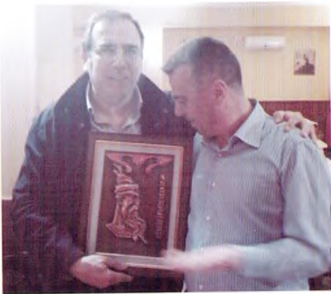
Accoglienza rappresentanza Scuola Albanese