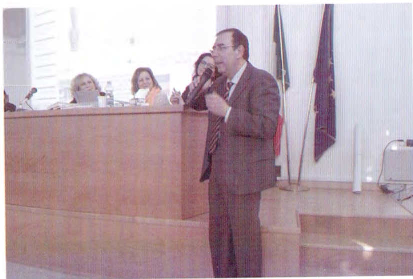
Attività Convegnistiche - Liceo Moscati