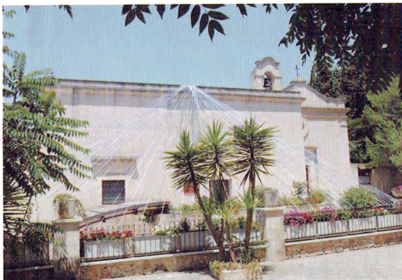
Santuario Madonna della Grazie (esterno)