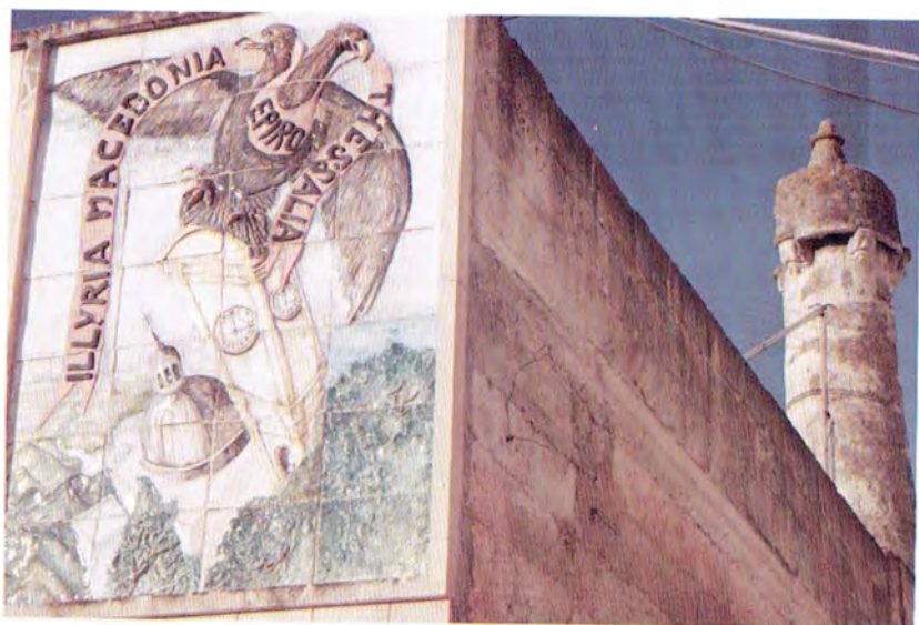
Comignolo Arbëresh - Centro storico