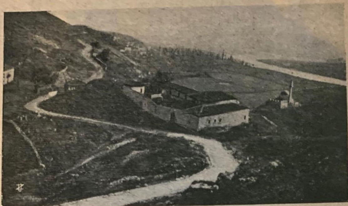
La valle della Bojana veduta dalla Fortezza Veneta di Scutari.