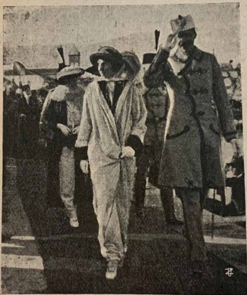
Il principe di Wied.

In mezzo, o meglio, contro questi tre uomini, le loro aderenze e le lor camarille, giunse il 1° marzo del 1914 il Principe Guglielmo di Wied, di quella