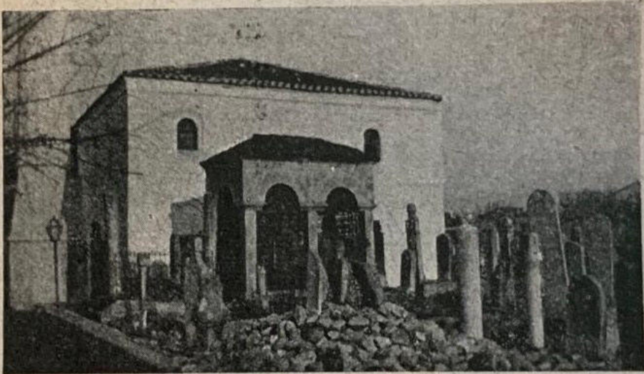
La moschea di Paruza.

sono sempre pronti e sicuri difensori e propagatori dell' Islam. Soltanto le tribù cattoliche dell' Alta Albania, i Malissori e i Mirditi non piegarono mai la testa al giogo musulmano, e da loro partì la prima scintilla verso nuove rivendicazioni, sia contro la Turchia, sia contro la Serbia e il Montenegro che ogni tanto strappavano anch' essi qualche brano di territorio all' Albania.