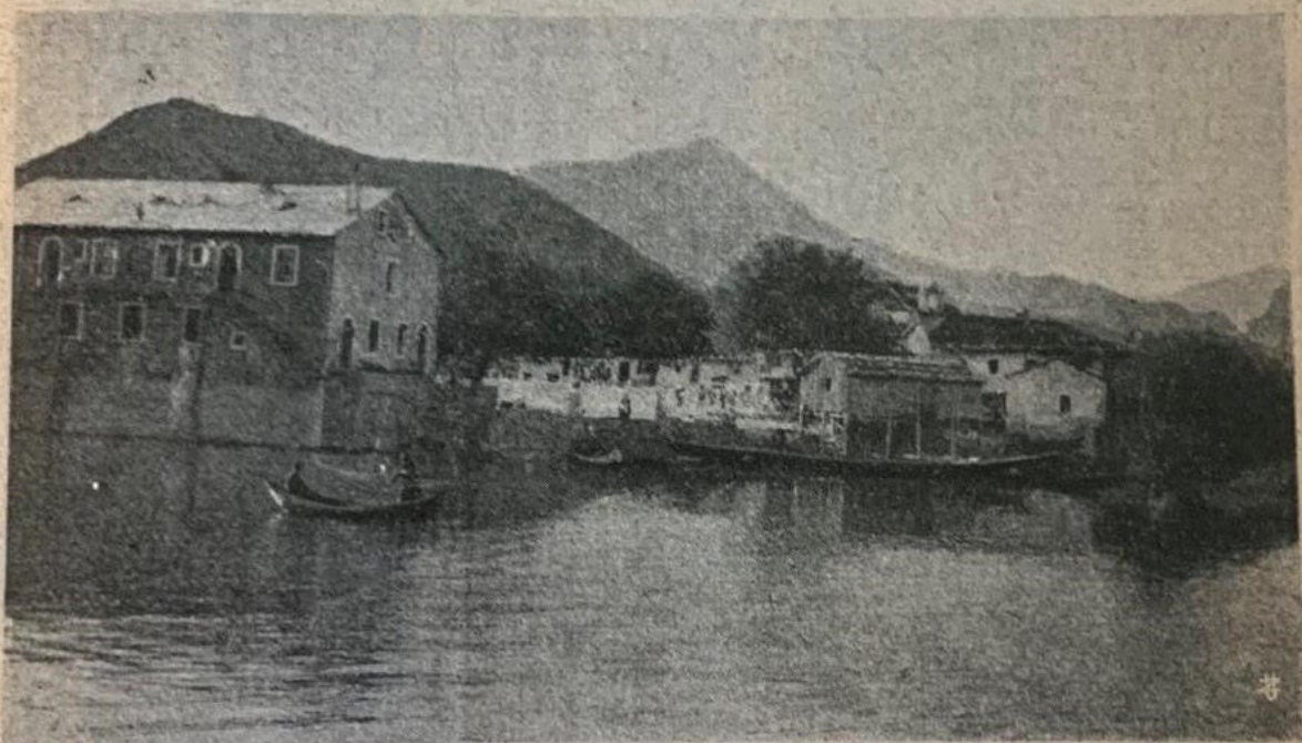
Vir Bazar sul lago di Sentari.

vista di porti, di insenature e di ripari, ma per lo stato del mare, quasi sempre agitato, di non facile approdo e di malsicuro ancoraggio. Sopra una estensione, in linea retta di men che due gradi, cioè di circa 100 miglia marine (168 km.), esse hanno uno sviluppo di quasi 200 miglia (336 km.) e contano da settentrione a mezzogiorno ben sei insenature: baia di Medua, baia del Drin, baia di Lules,