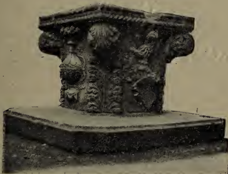
« Vera » veneziana a Scutari.

Veglia su te il cuore dell'Italia nuova.