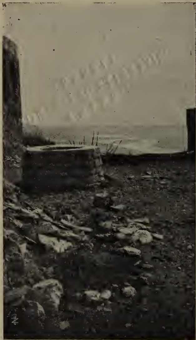
La pianura della Boiana vista dai monti.

Invasa infatti nel 604 a. C., dai Galli, condotti da Belloveso e da Ligoveso, un ramo di questa razza, i Liburni, si concentrò nella odierna Albania settentrionale e dette origine al regno illirico, che, posta la sua capitale a Scodra (Scutari) e la sua base marittima a Lissus (Alessio), raggiunse nel IV sec. a. C. il suo massimo splendore, stendendosi per