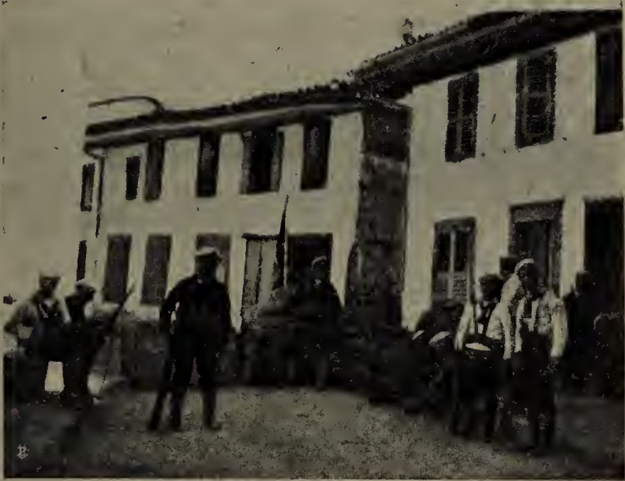
Marinai italiani alla difesa di Durazzo.

Nè alcuna parola è necessaria a cuore albanese per dimostrare il diritto della stirpe a quella indipendenza politica, che, grazie alla volontà del popolo italiano, essa ha finalmente raggiunta: tale