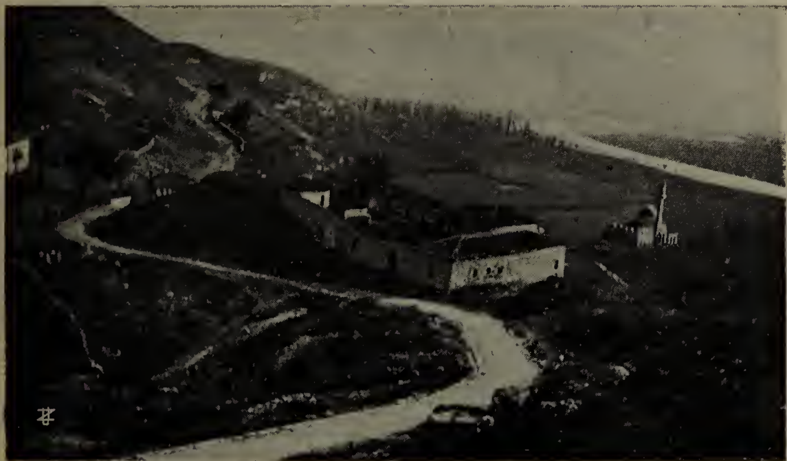
La valle della Bojana veduta dalla Fortezza Veneta di Scutari.

dinanzi ai delegati inviati dalle Potenze per stabilire la linea dei confini meridionali dell'Albania, dovettero a malincuore, sloggiare da più d'uno di quei paesi che avevano di sorpresa occupato.