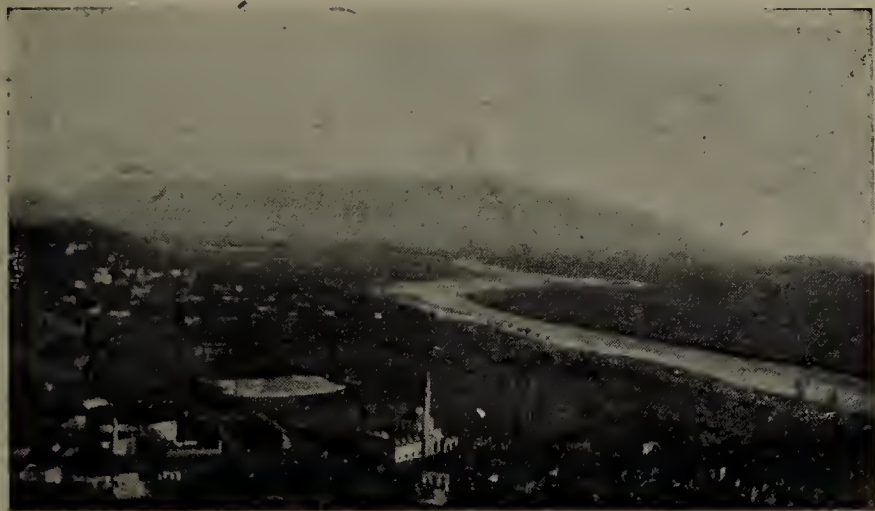
La pianura della Drinazà.

da sè a spiegare il miracolo del successivo assedio di Scutari, in cui poche migliaia di Veneziani tennero testa per mesi e mesi a duecentomila Turchi. Ecco l'aneddoto.