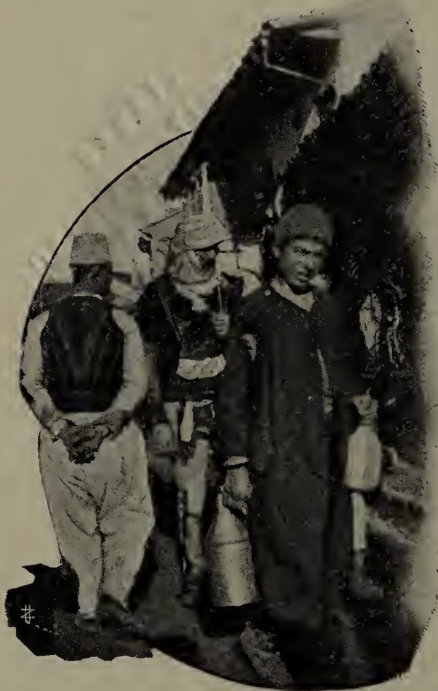
Mirditi e malissori.

meridionale e « toshi » nella settentrionale : la centrale si può dire egualmente abitata dagli uni e dagli altri. Quando le ferrovie correranno da Valona a Scutari, da Durazzo a Ocrida, queste differenze spariranno totalmente.