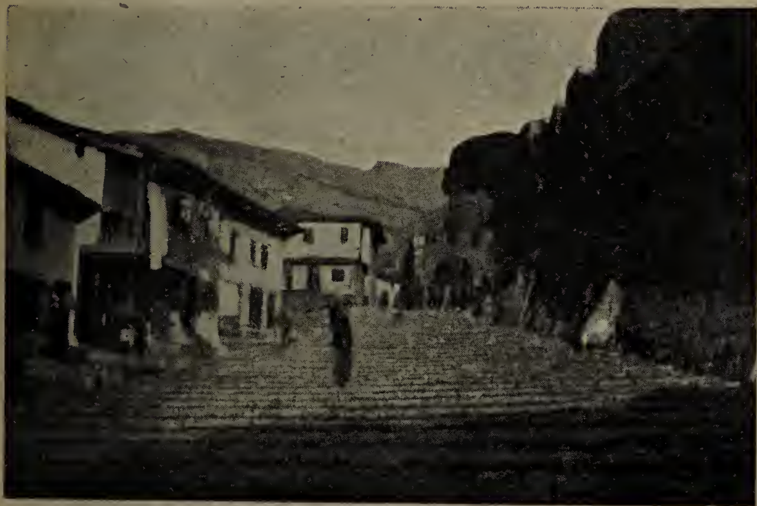
Ingresso alla fortezza veneziana di Antivari.

a Corfù, e, nonostante un nuovo assalto da loro dato a Durazzo nel 1185, il sogno normanno del dominio dell'Adriatico, è per sempre, per opera di Venezia, svanito.