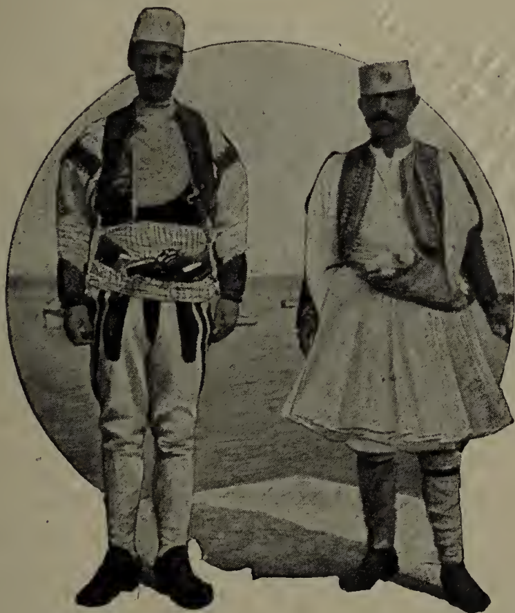
Ghego e Tosco.

divisi, secondo due criteri differenti, in diversi gruppi: secondo la religione che professano, in cattolici, ortodossi e musulmani; secondo le regioni che abitano, in « gheghi » e « toshi ».