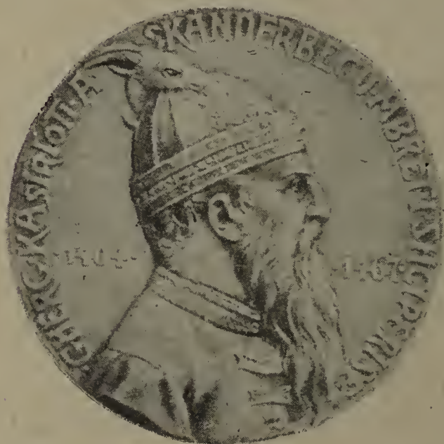
Giorgio Castriota, lo Scanderbeg.

nativa Asia, dove viveva senza legge e senza freno, si è rovesciato sulla civiltà europea, e mari e terre semina di rapine, di stragi, di nefandezze senza nome: il popolo turco. Sembra che suo unico scopo sia quello di fare di ogni terra un deserto, di abbat-