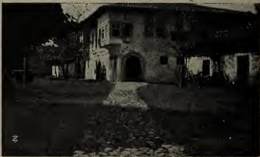
Casa albanese del Rinascimento.

Fu risparmiato, il piccolo Giorgio, ma fu strappato alla famiglia e alla Patria, e trasportato lungi a servire il nemico. La larghezza dell'intelligenza e la vigoria delle membra del giovinetto indussero i nemici a sperare di poterne fare un audace guerriero al loro servizio; ed infatti, avviato alla carriera delle armi, che già gli erano familiari, lo vediamo dai sedici ai ventott'anni combattere sotto le