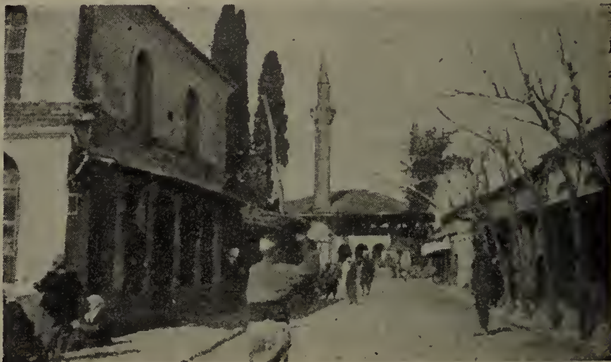
Una via di Tirana.

guerre di quei tempi e imbaldanziti dalla vittoria, marciavano su Croja. Ma la stella dello Scanderbeg non era tramontata, e, mentre gli Albanesi assediati in Croja, con frequenti sortite infliggevano al nemico gravi e continue perdite, il Castriota, accampato presso le foci dell'Ismi, iniziava una guerriglia così