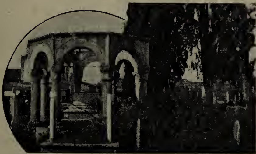
Tomba di Santo musulmano.

israeliti, che pur differiscono dagli altri cittadini non solo come religione ma come razza, perchè di origine non latina, hanno per la Patria la medesima devozione dei cattolici e sono dalla Patria egualmente stimati ed amati.