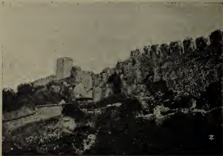
Mura veneziane a Durazzo, dove fu il campo di Cesare.

come della storia albanese fa parte la successiva contesa tra Antonio ed Ottaviano (31 a. C.), che ebbe fine col trionfo di questo nella battaglia navale di Azio (Prevesa): può anzi dirsi che l'Impero Romano fu fondato, e doppiamente, sulla terra d'Illiria.