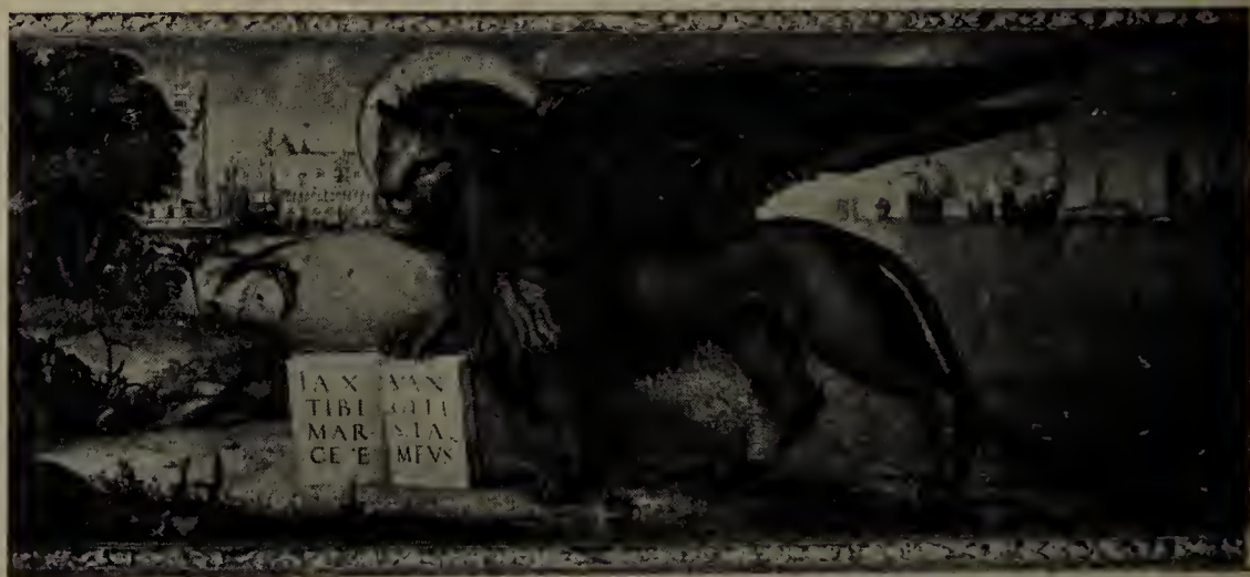
Il leone di San Marco.

nezia. Innamorati della libertà e decisi a morire piuttosto che perderla, marinai sapienti ed audaci, cittadini coscienti della eredità civile legata loro da Roma, in poco tempo, respinto sanguinosamente ogni tentativo di asservimento, avevan già intravisto, nella possibilità dei liberi commerci con l'oriente, la futura fortuna della loro Patria. Emblema il leone di San Marco, col libro di pace aperto per gli amici,