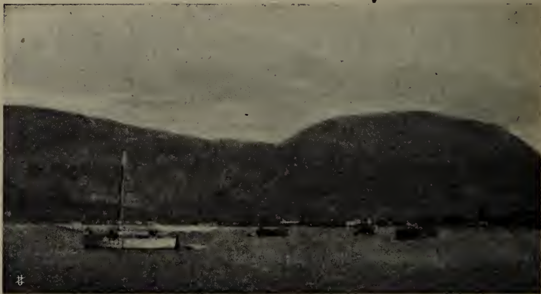
La baia di Antivari.

un giuramento terribile, che traeva seco la condanna di morte sopra qualunque di loro non compiesse intero il proprio dovere, affrontarono in nome della libertà della Patria, pochi e poveri, la lotta contro il Montenegro, la Grecia e la Turchia, e si opposero con pochi fucili agli stessi deliberati delle grandi Potenze d'Europa!