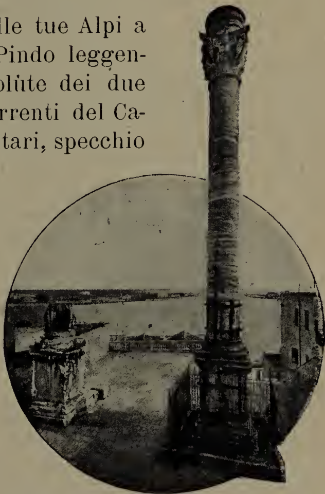
Colonna terminale della via Appia.

Dai picchi nevosi delle tue Alpi a gl'impervii gioghi del Pindo leggendario; dalle larghe volute dei due Drin alle impetuose correnti del Calamàs; dal lago di Scutari, specchio dei monti, a quello di Ocrida, specchio del vicino cielo; dai boschi ducagini e miriditi a gli oliveti di Valona, di Argirocastro e di Delvino, tutta l'Albania è una festa di monti, di acque correnti, di alberi e di erbe in fiore in ogni stagione. Il mare, che dagli scogli di Dul-