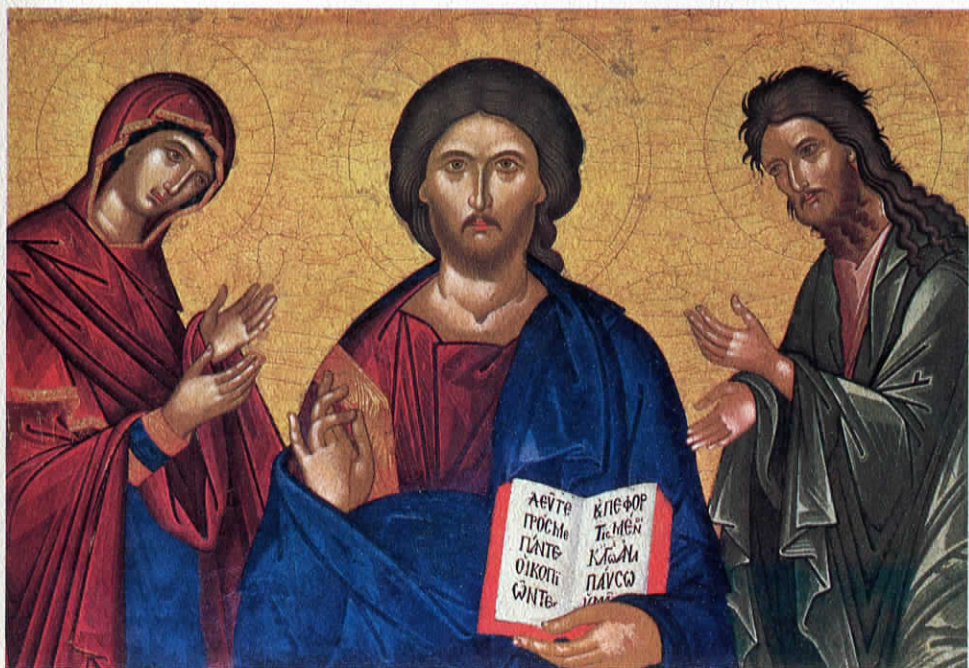
Δέσις. Κρητικὴ. Ὑστερος 17ος αἰώνας

Ἡ Ἐπαρχία τῆς Ρίανα προσφέρει μὲ τῖς εἰκόνες αὐτὲς ὅλη τὴν παρά- δοση τῆς πού τὴ συνδέει μὲ τὸν βυζαντινὸ καί τὸν ἀλβανικὸ κόσμο, μὲ τὸν ἔρχομὸ καί τὴν παρουσία τῶν παιδιῶν της στὴ Σικελία. Μ'αὐτὸ τὸν τρόπο ἡ Ἐπαρχία θέλει νὰ ἐπανασυνδέσει τὸν ἑαυτὸ της καί τὴ Σικελία μὲ τὴ χθισινὴ καί τὴ σημε- ρινὴ Ἀνατολή καί νὰ ἐκφράσει τὸ πνεῦμα τῆς ἀσβεστης ἀδελφωσύνης καί τῆς πολυπόθητης ἐνότητος.