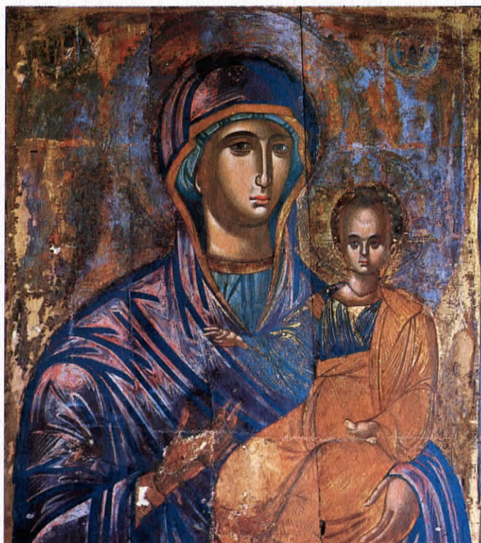
Παναγία ή 'Οδηγήτρια. Ήρομόναχος Ίωαννίνκιος Δεύτερο ήμισυ του 17ου αιώνα

Ο μητροπολιτικός τους ναός είναι στην Piana degli Albanesi, αλλά στο Παλέρμο υπάρχει και άλλος μητροπολιτικός ναός, που είναι ή εκκλησία της S. Maria dell'Ammiraglio γνωστή με την όνομασία της Martorana.