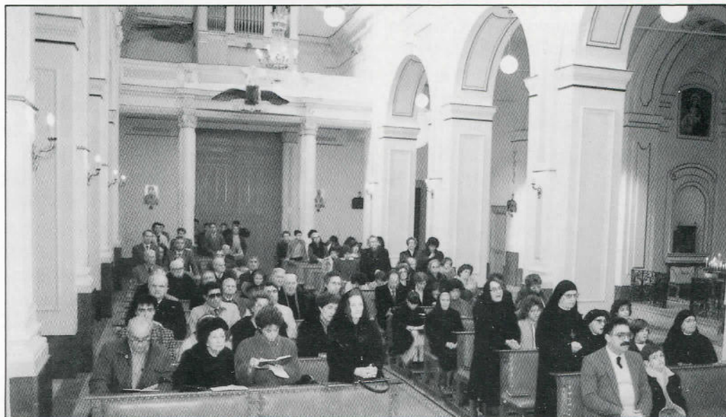
I fedeli presenti alla commemorazione religiosa.