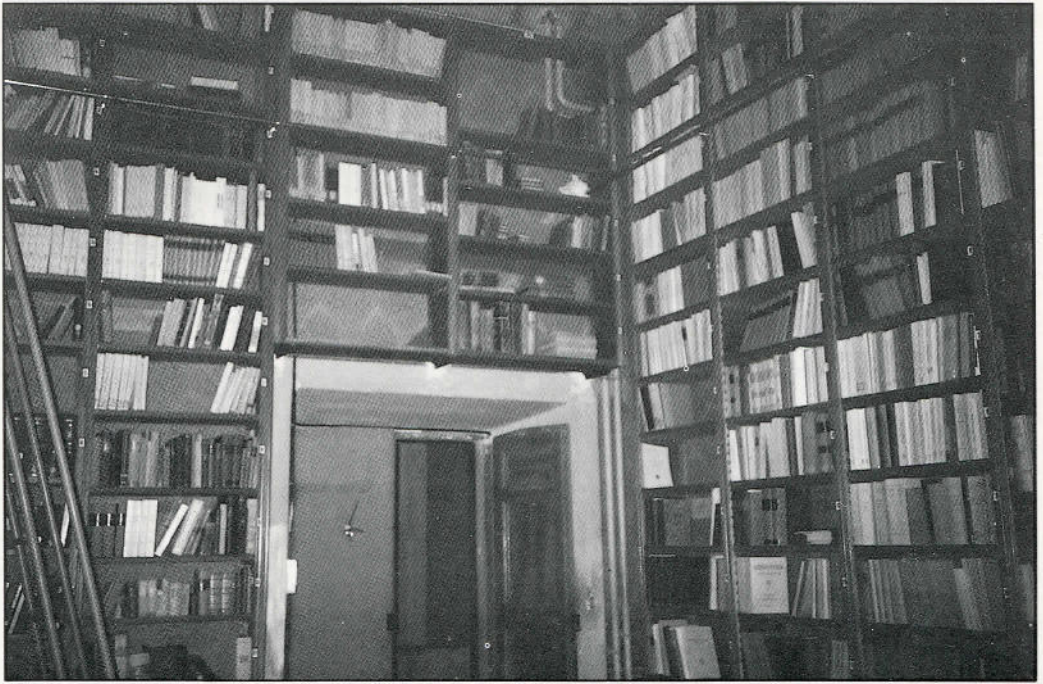
Biblioteca del Collegio Greco (Roma). Visione parziale della sala di lettura "Professore Giuseppe Schirò"

che rispecchiano la natura della scaffalatura si ha una numerazione latina per la segnatura di facciate verticali e segnatura in numeri arabi per i vari piani. La segnatura latina corrisponde alle materie generali, mentre quella araba alle sotto materie delle prime: