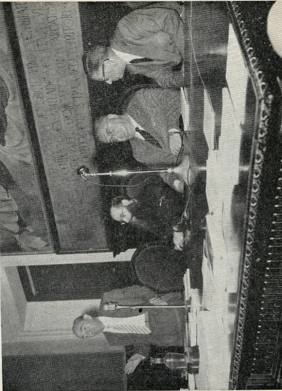
Convegno albanologico a Palermo al Centro Internazionale di Studi Albanesi (Mbledhje në Qendrën Ndërkombtare të Studimeve Shqiptare në Palermë - Dr. Petrota është në skâj kah e mbajta).