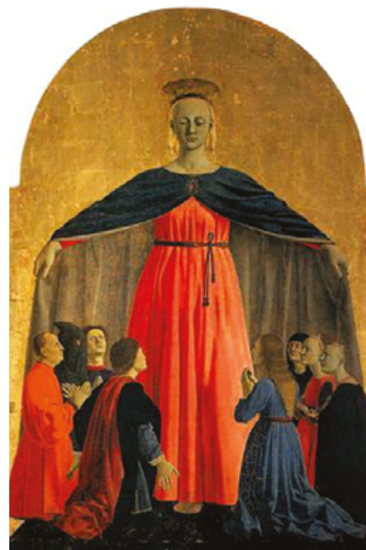
Piero della Francesca, Madonna della Misericordia.

In Occidente si ritiene che Sant'Oddone, abate di Cluny, abbia attribuito alla Madre di Dio il titolo di Madonna della Misericordia , dopo aver convertito un ladro che aveva avuto in visione la Madonna che gli aveva detto di essere la Madre della misericordia, promettendogli il paradiso 2 .