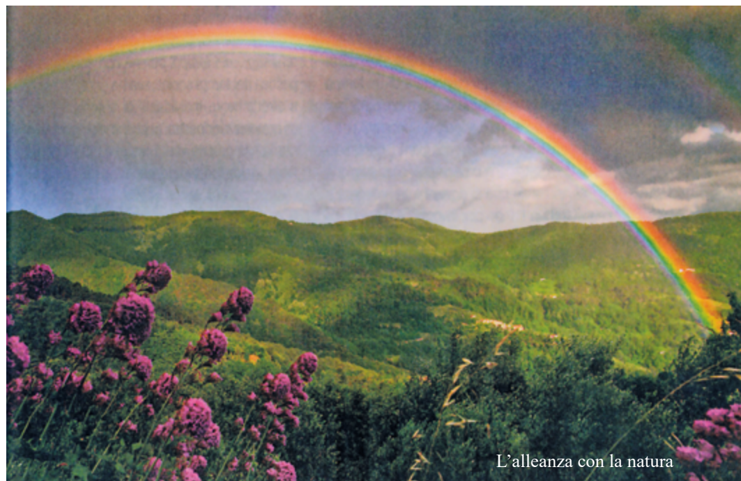
L'alleanza con la natura

In ogni nostra celebrazione del mistero di Dio, sia che cantiamo col salmo " i cieli narrano la gloria di Dio e il firmamento annuncia l'opera sua ", sia che interloquiamo nel dialogo della benedizione del rito romano " Il nostro aiuto è nel nome del Signore - Egli ha fatto il cielo e la terra ", sia in particolare quando invochiamo nella Divina Liturgia