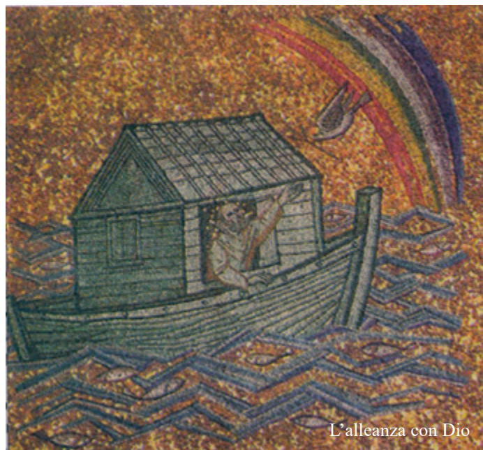
L'alleanza con Dio

Dopo tutte le sollecitazioni che la giornata in sé, con il suo vivo messaggio ecclesiale, con le accurate ed accorate parole del Vescovo e del Papa, con la sua immancabile, variegata sosta conviviale, più che mai attenta alla cura del territorio, i partecipanti hanno seguito ed animato