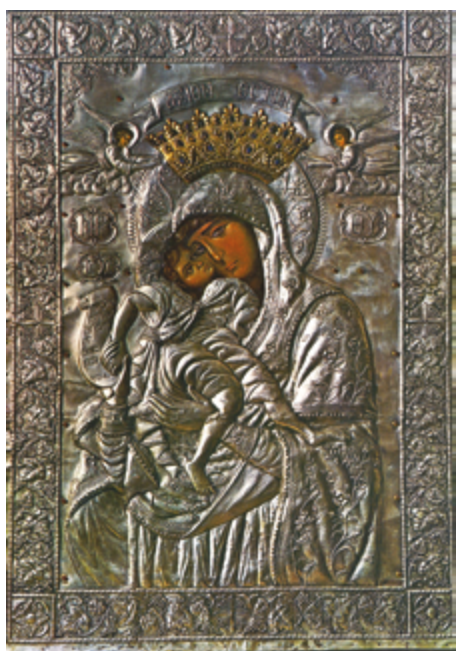
Icona dell'Axion Estin. Santuario della Misericordia, Acquaformosa.

La nostra fede ci insegna e ci assicura che la Madre di Dio ci copre con il suo manto e, nel momento delle tentazioni, ci protegge e ci difende, prega per noi e noi ne siamo liberati: