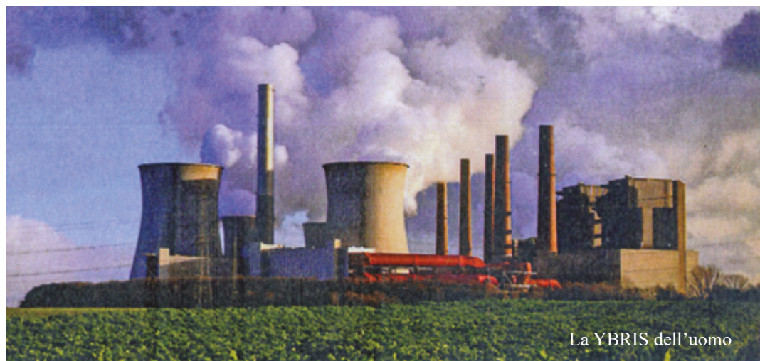
La YBRIS dell'uomo

Una degna amplificazione della “Giornata per la custodia del Creato” si può infine considerare la celebrazione del V Convegno Ecumenico Regionale , che si è articolato in due momenti, rispettivamente di riflessione e di preghiera, nei giorni 20 e 21 ottobre, a Castrovillari, Parrocchia di S. Girolamo, nella Diocesi di Cassano e in Cattedrale a Lungro, sul tema “LA CUSTODIA DEL CREATO E IL CAMMINO ECUMENICO NEL XXI SECOLO. CUSTODIRE IN COMUNIONE” con la partecipazione, accanto al Vescovo Donato, di Mons. Francesco Savino, Vescovo di Cassano, e i contributi ricchi, motivati e convergenti di S.E. Ioannis Tsaftaridis del Patriarcato Ortodosso di Alessandria d’Egitto, e di Mons. Andrea Palmieri, Sottosegretario del Pontificio Consiglio per l’unità dei cristiani.