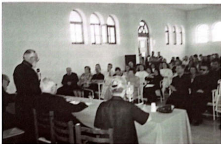
S. COSMO ALBANESE, 27 agosto 1999 - Il vescovo diocesano ringrazia l'arcivescovo di Cosenza-Bisignano, mons. G. Agostino, dopo la relazione tenuta ai partecipanti al Corso di aggiornamento teologico.

S. COSMO ALBANESE - CASA DEL PELLEGRINO 26-27-28 AGOSTO 1999