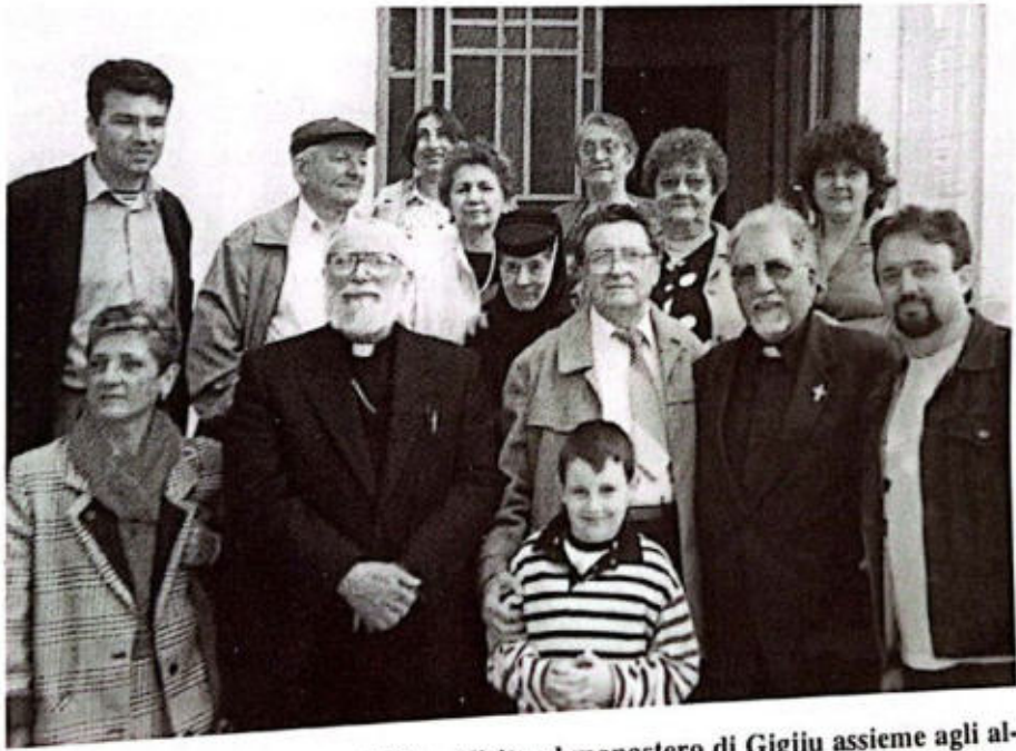
PLOIESHTI, 11 maggio 1999 – Visita al monastero di Gigjiu assieme agli albanesi romeni.

Ho notato molte cose in Romania che ci rinforzano nella speranza e che sono un buon inizio per i nostri futuri rapporti. Ammiriamo il vostro impegno per il rispetto verso le tradizioni ed i vostri antenati i quali sono stati uomini della speranza, onorati e co-