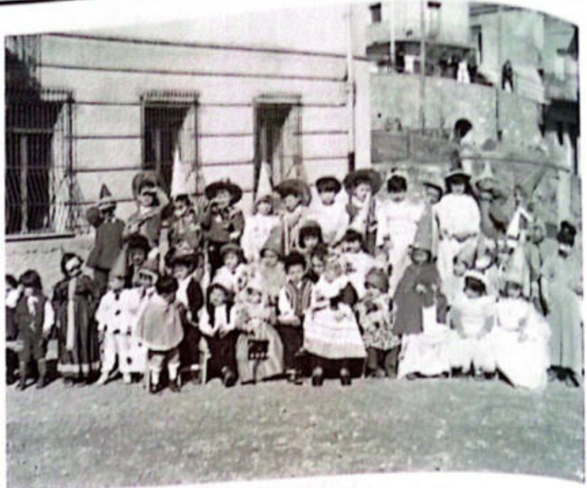
S. COSTANTINO ALBANESE, 15 febbraio 1967 — Bambini durante la festa del Carnevale.

Il dialogo che nasce tra due individualità si integra di nuovi contenuti, il soggetto non è più il singolo, ma la coppia. Questo dialogo inizia nel tempo del fidanzamento e accompagna tutta la vita della coppia perché c'è sempre la necessità di ridiscutere e confermare o modificare comportamenti, ruoli, aspettative.