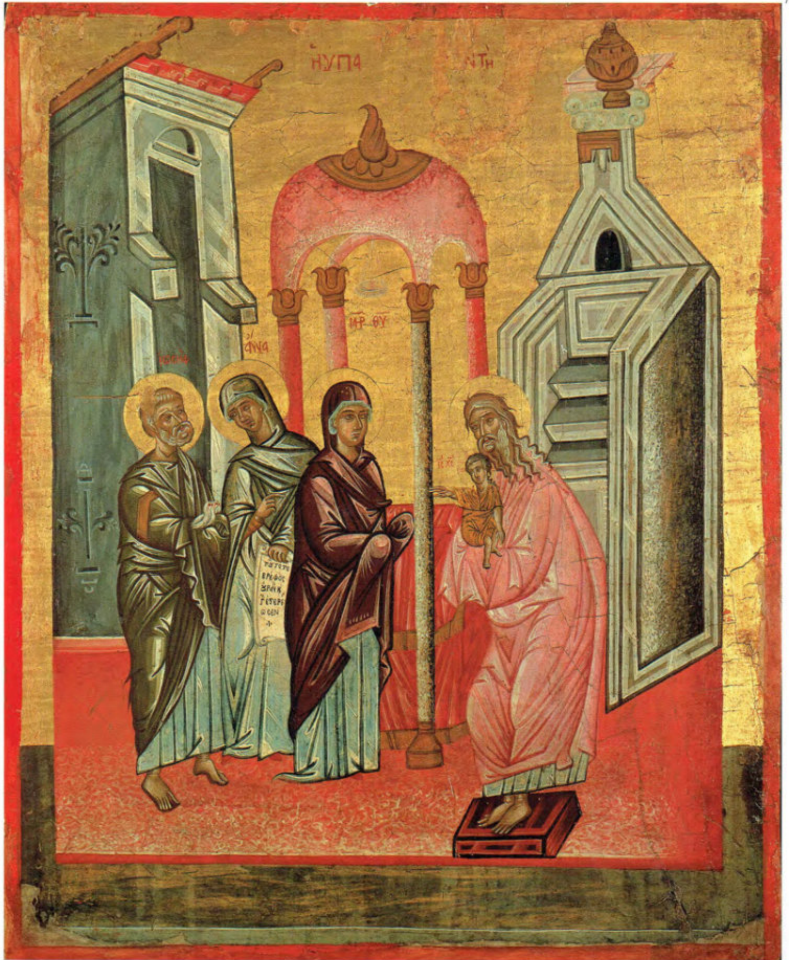
Iconostasi della Ss.ma Annunziata: 9. Presentazione di Gesù al Tempio. Anonimo greco. 1641. Arciconfraternita della Purificazione