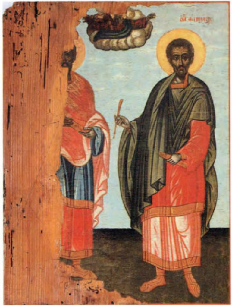
Le Icone "sciolte": T22. Santi Cosma e Damiano. Filotheos Skufos (?). Seconda metà del XVIII secolo. Scuola cretese. Museo Fattori inv. n° 1215