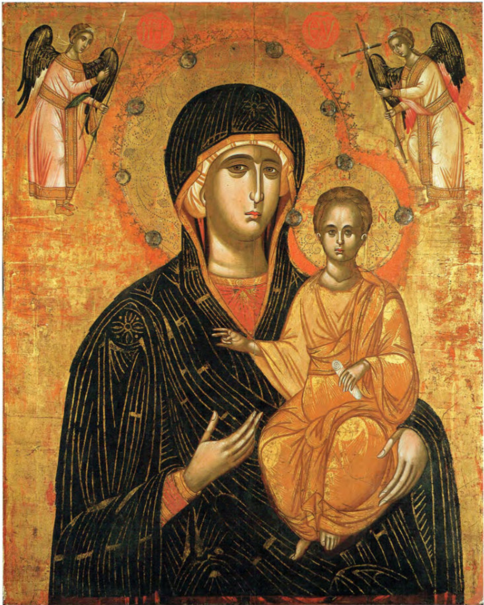
Le Icone "sciolte": A4. Madre di Dio della Passione.

Emanuele Tzanes o scuola (?), XVII secolo. Scuola cretese. Arciconfraternita della Purificazione