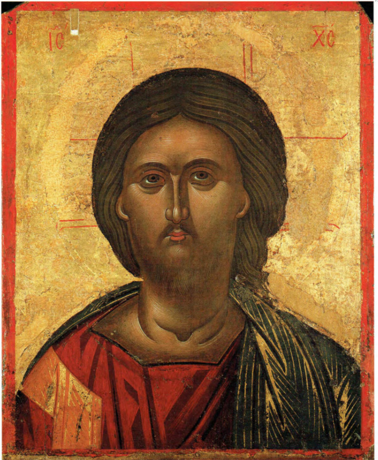
Iconostasi della Ss.ma Annunziata: 13. Cristo. Anonimo greco. XVII secolo. Scuola cretese. Arciconfraternita della Purificazione