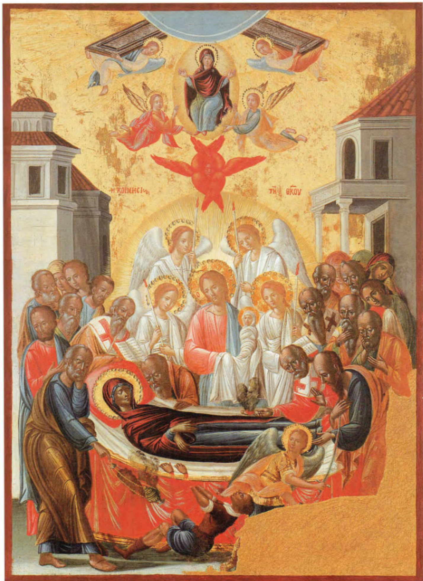
Iconostasi del vecchio Cimitero: 13. Dormizione della Madre di Dio. Scuola ionica. Ultimo quarto del sec. XVIII. Museo Fattori inv. n° 1236