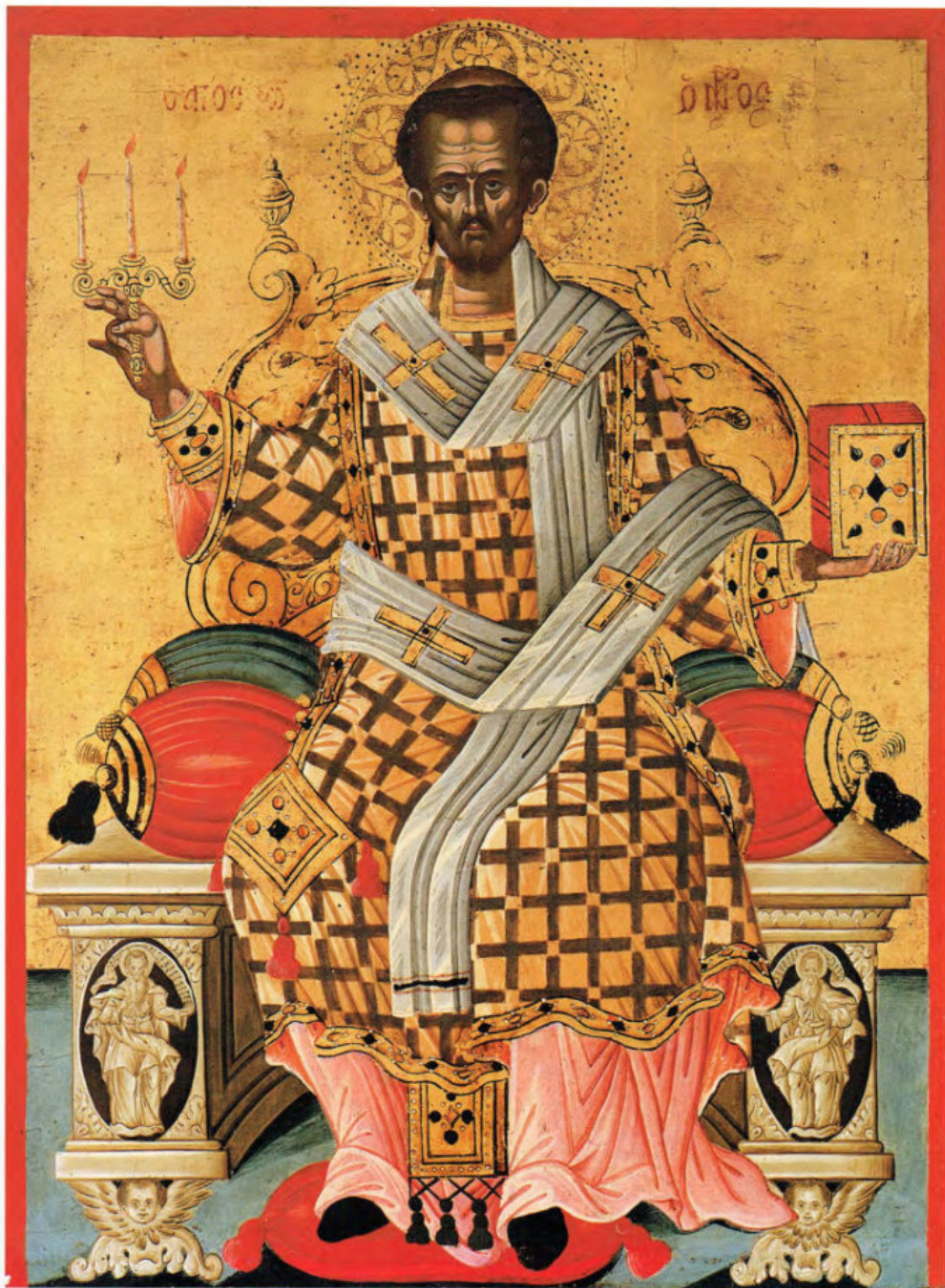
Le Icone "sciolte": T4. San Giovanni Crisostomo.

Teodoro Pulakis (?). Fine del XVII secolo. Scuola cretese. Museo Fattori inv. n° 1239