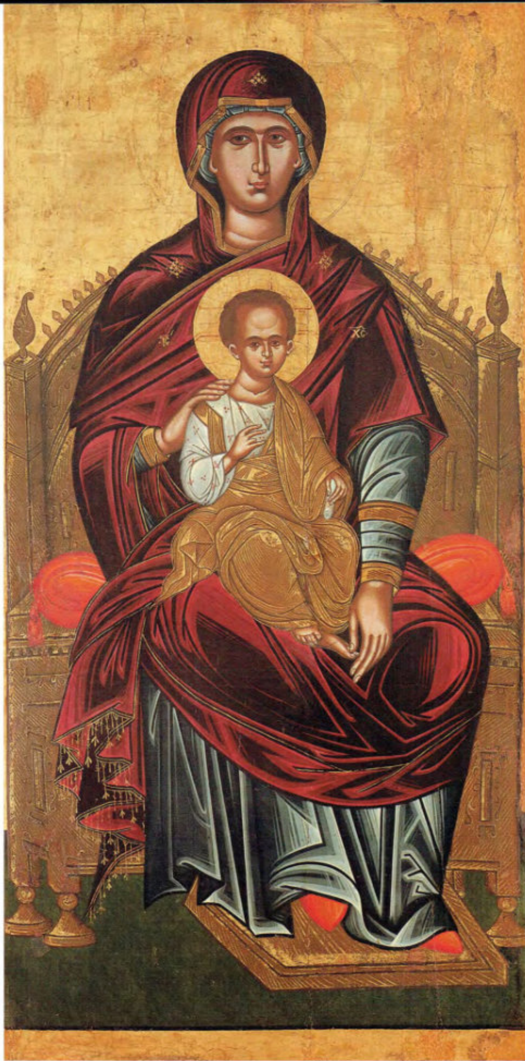
Le Icone "sciolte": T2. Madre di Dio in trono. Scuola cretese, XVII secolo. Museo Fattori inv. n° 1193