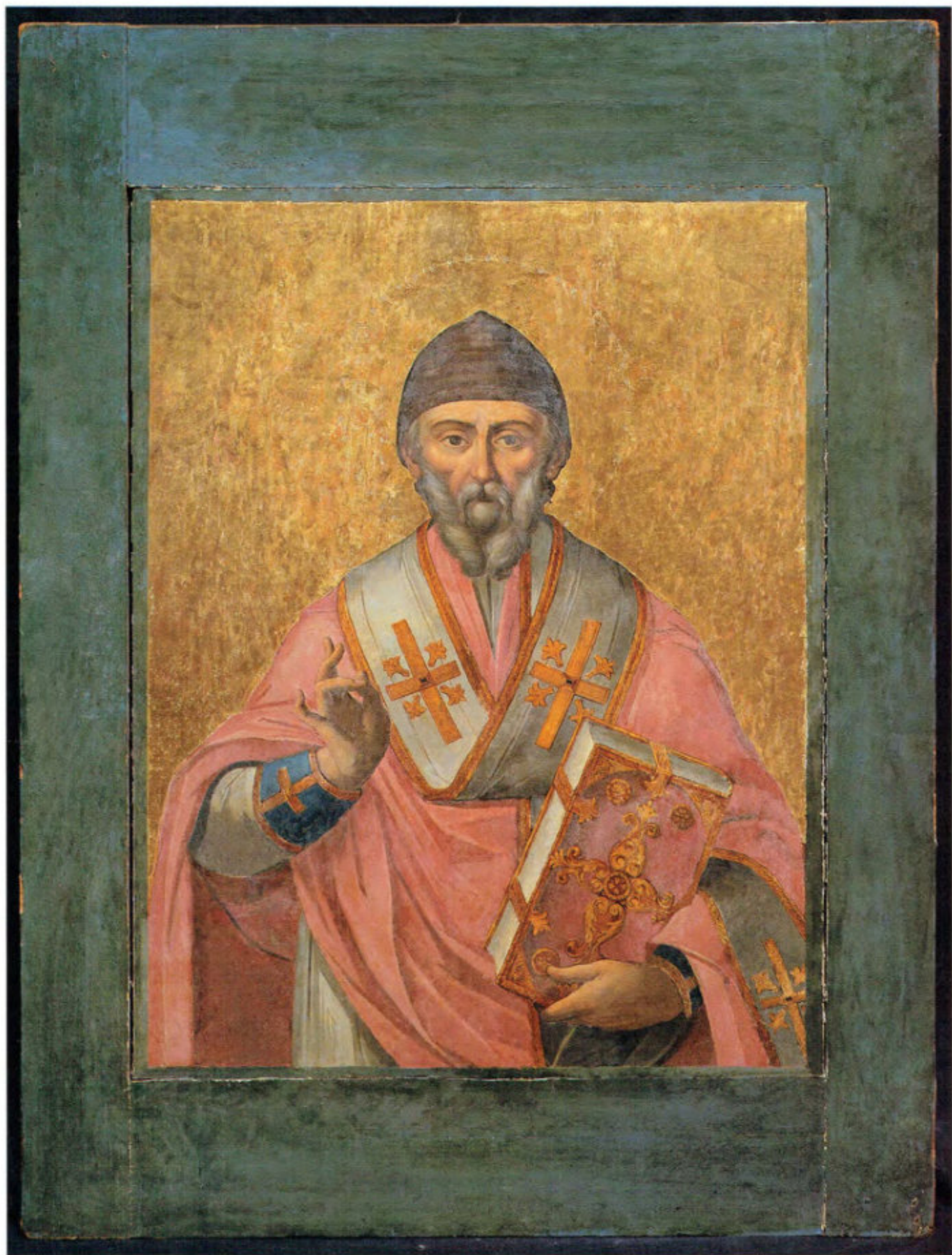
Iconostasi del vecchio Cimitero: 4. Santo Spiridione. Scuola ionica. Seconda metà del sec. XVIII. Museo Fattori inv. n° 1203b