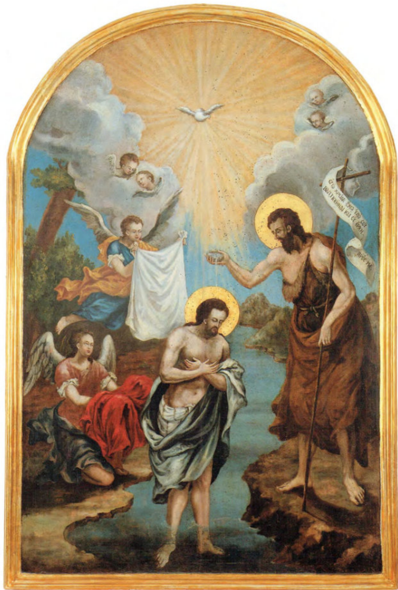
Chiesa della Ss.ma Trinità: 26. Battesimo di Gesù. Spiridon Romas. Livorno, dopo luglio 1766. Museo Fattori inv. n° 1221