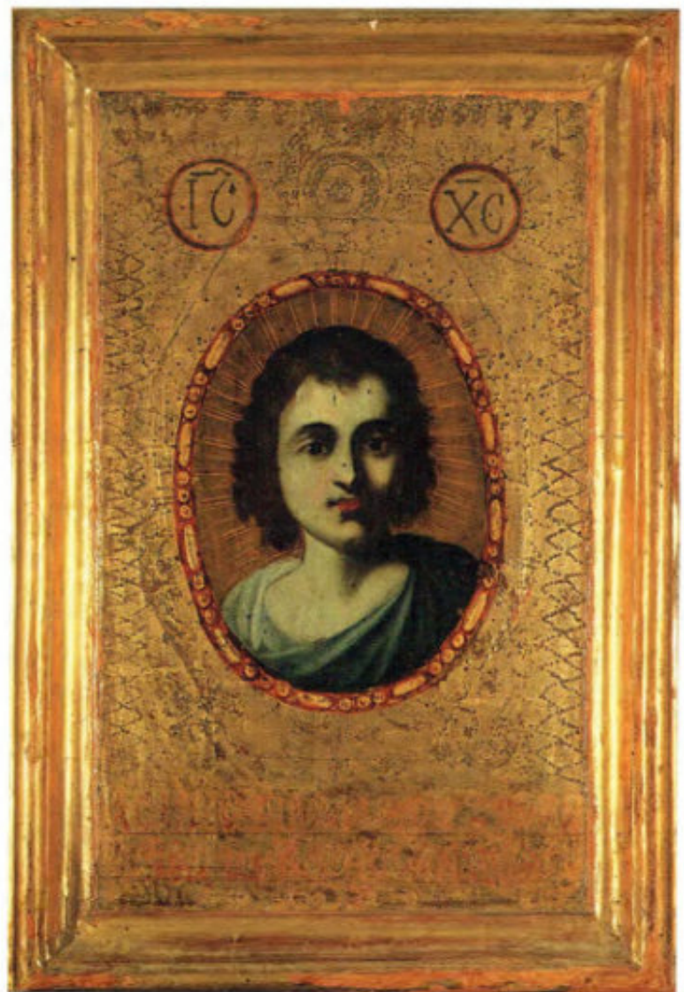
Iconostasi della Ss.ma Annunziata: 20. Cristo Emanuele. Anonimo greco, 1652. Arciconfraternita della Purificazione