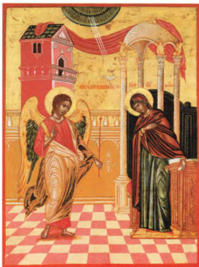
Iconostasi del vecchio Cimitero: 10. Annunciazione. Scuola ionica, Ultimo quarto del sec. XVIII. Museo Fattori inv. n° 1241