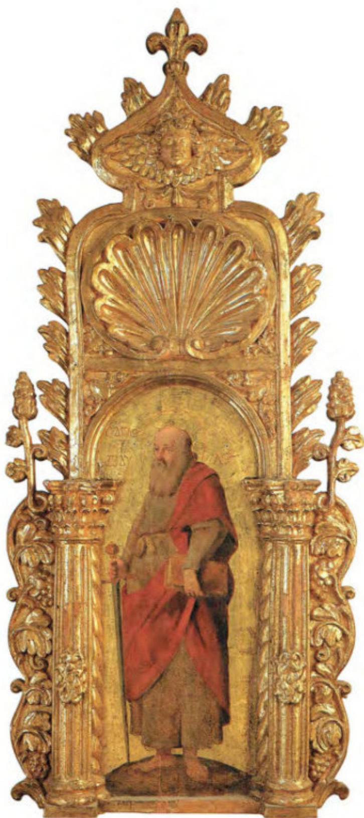
Iconostasi della Ss.ma Annunziata: 23. Pietro e Paolo.

Intaglio: Frabenetos (Thomas Benetos). Creta 1642-43. Pittura: Ignoto. Livorno 1644. Arciconfraternita della Purificazione