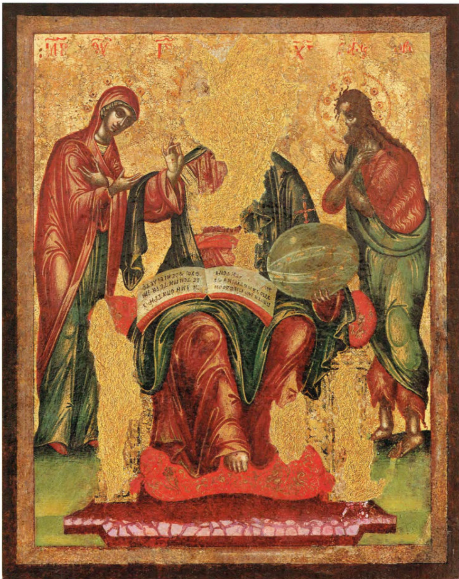
Le icone "sciolte": T24. Cristo in trono con ai lati la Madre di Dio e Giovanni Battista ( Deisis ). Scuola ionica. Ultimo quarto del sec. XVII. Museo Fattori inv. n° 1243