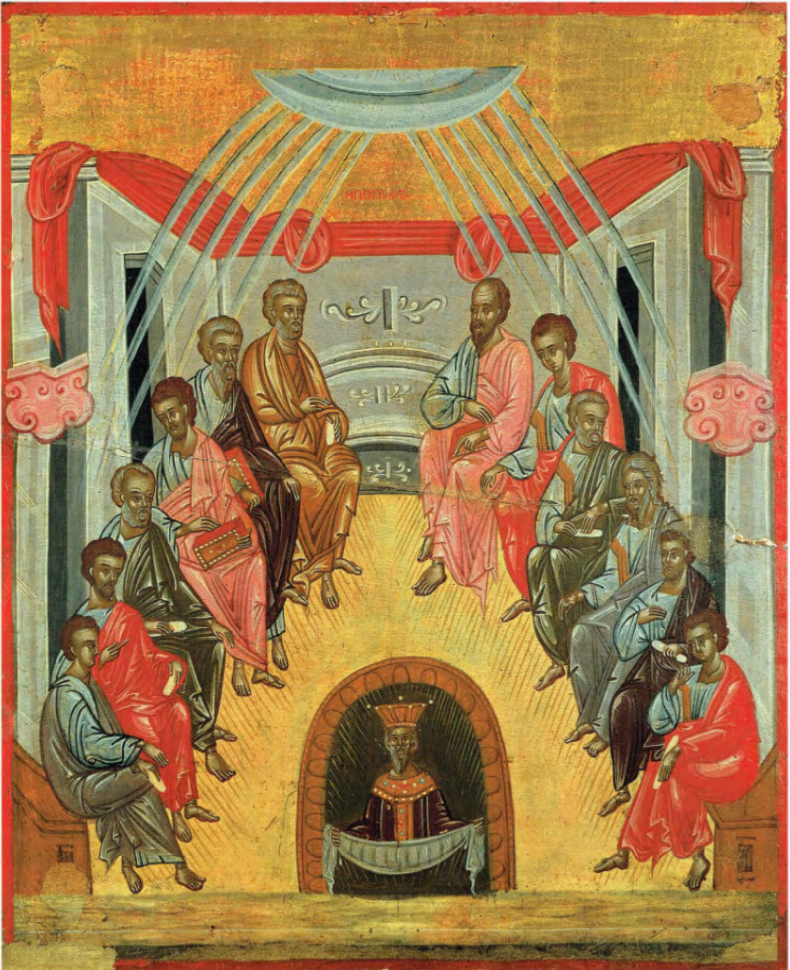
Iconostasi della Ss.ma Annunziata: 18. Pentecoste. Anonimo greco, 1641. Arciconfraternita della Purificazione