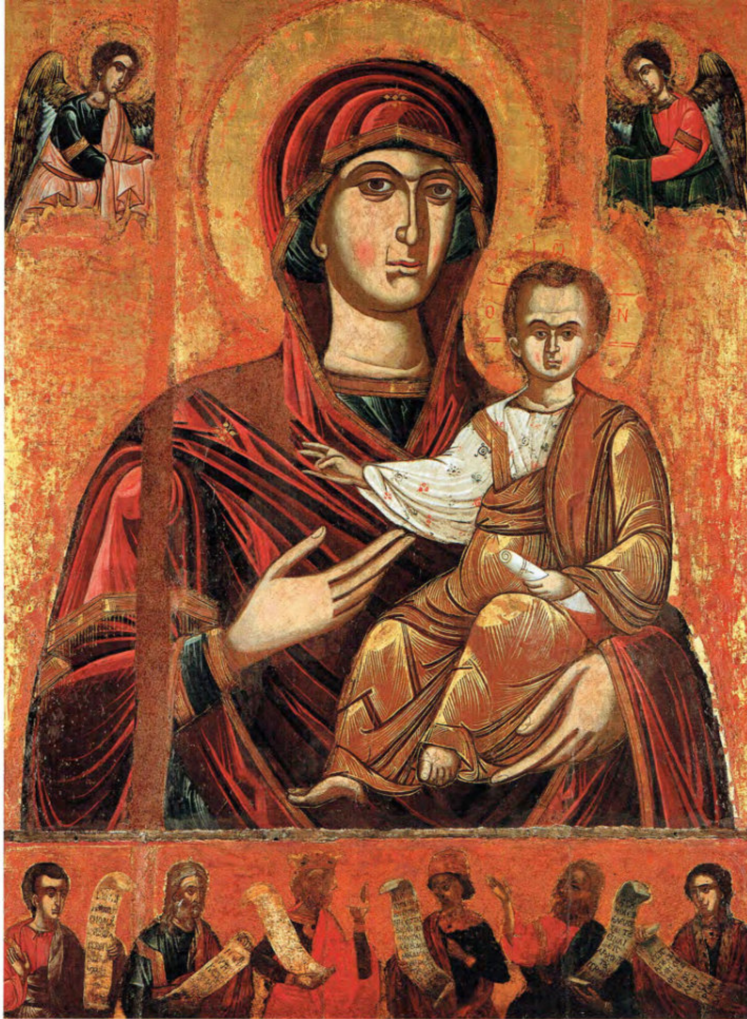
Iconostasi della Ss.ma Annunziata: 2. Madre di Dio Odigitria.

Anthimos Kolas di Zante, monaco sacerdote (ieromonaco). Prima decade del XVII secolo. Scuola macedone. Arciconfraternita della Purificazione