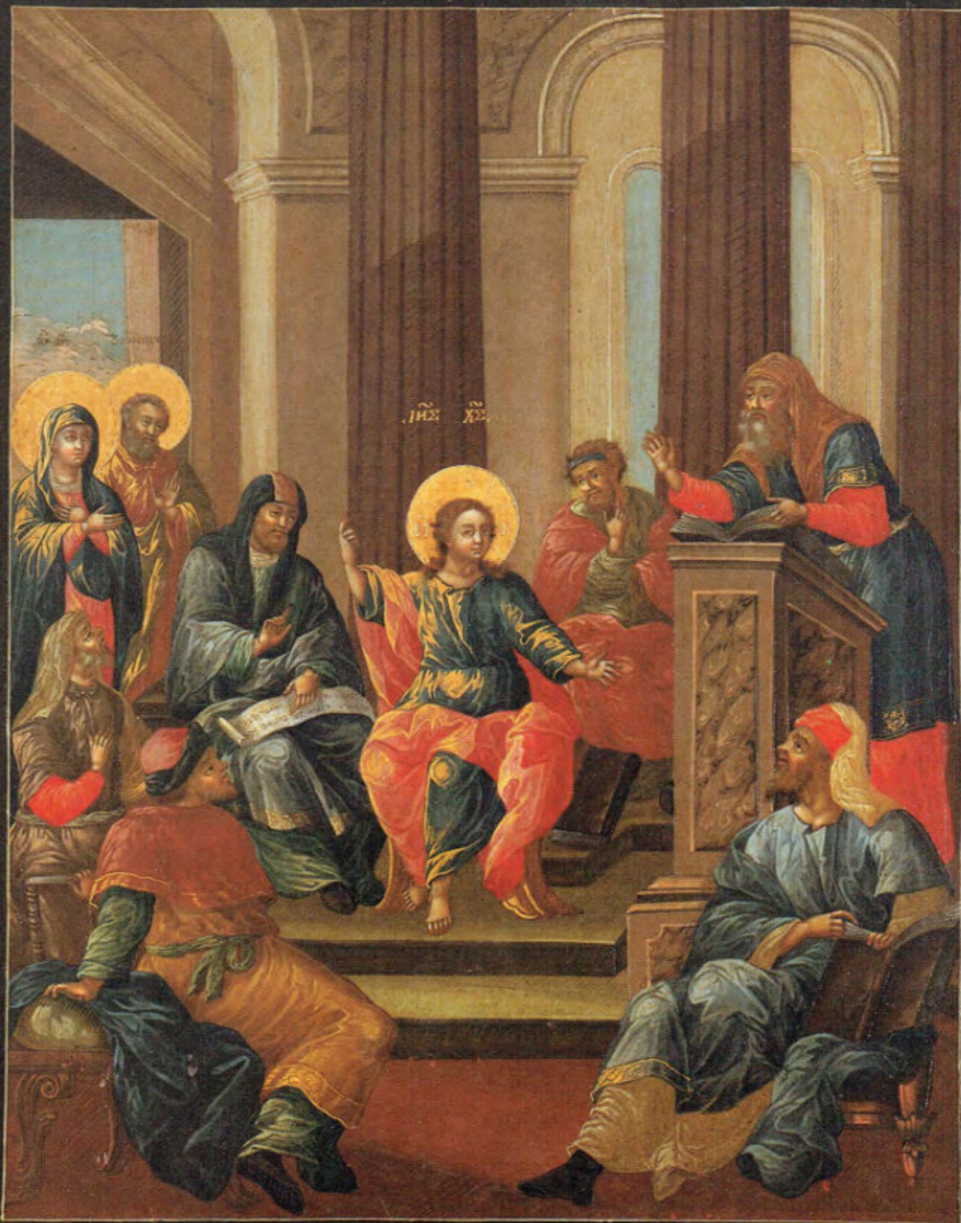
Iconostasi russa: 6. Mezza Pentecoste.

Anonimo russo. Mosca, metà del XVIII secolo. Scuola del Palazzo delle Armi. Museo Fattori inv. n° 1227