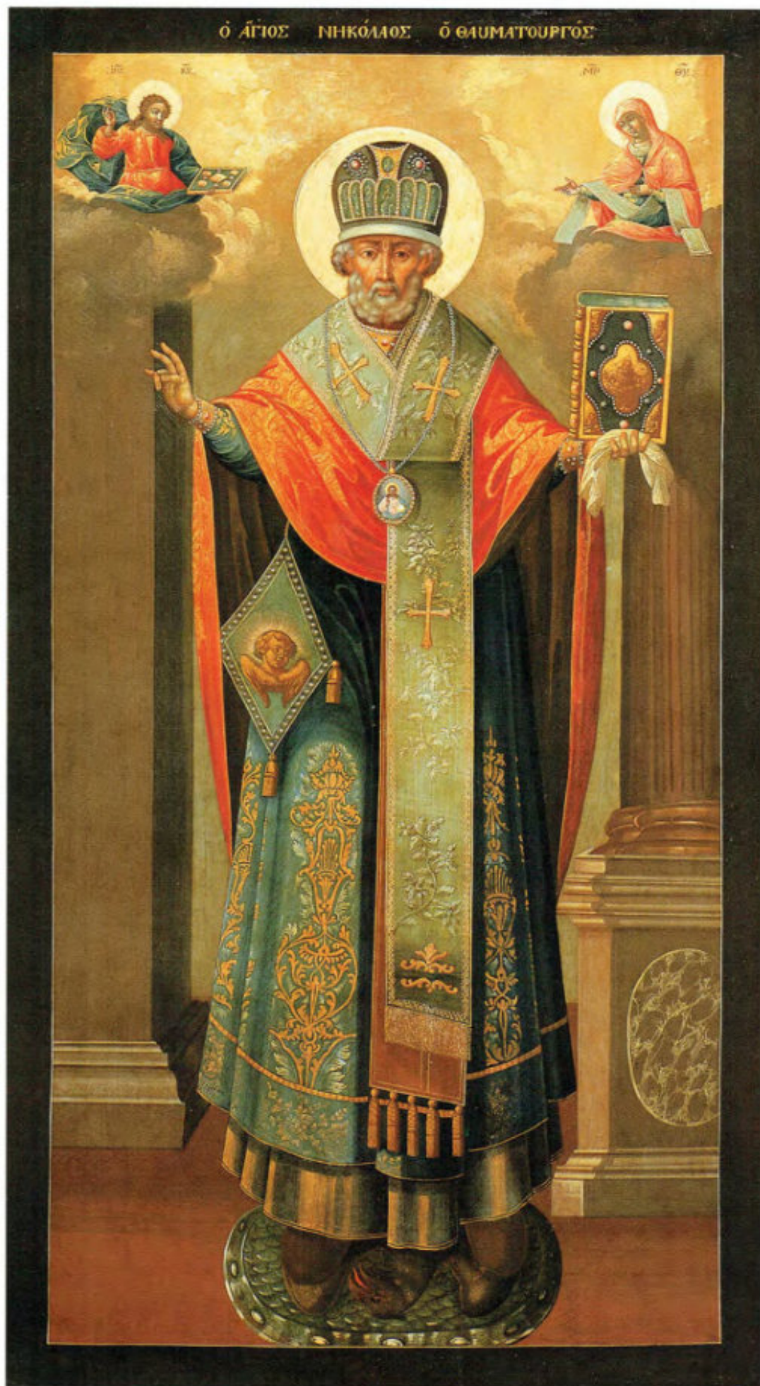
Iconostasi russa: 3. San Nicola il Taumaturgo.

Anonimo russo. Mosca, metà del XVIII secolo. Scuola del Palazzo delle Armi. Museo Fattori inv. n° 1195