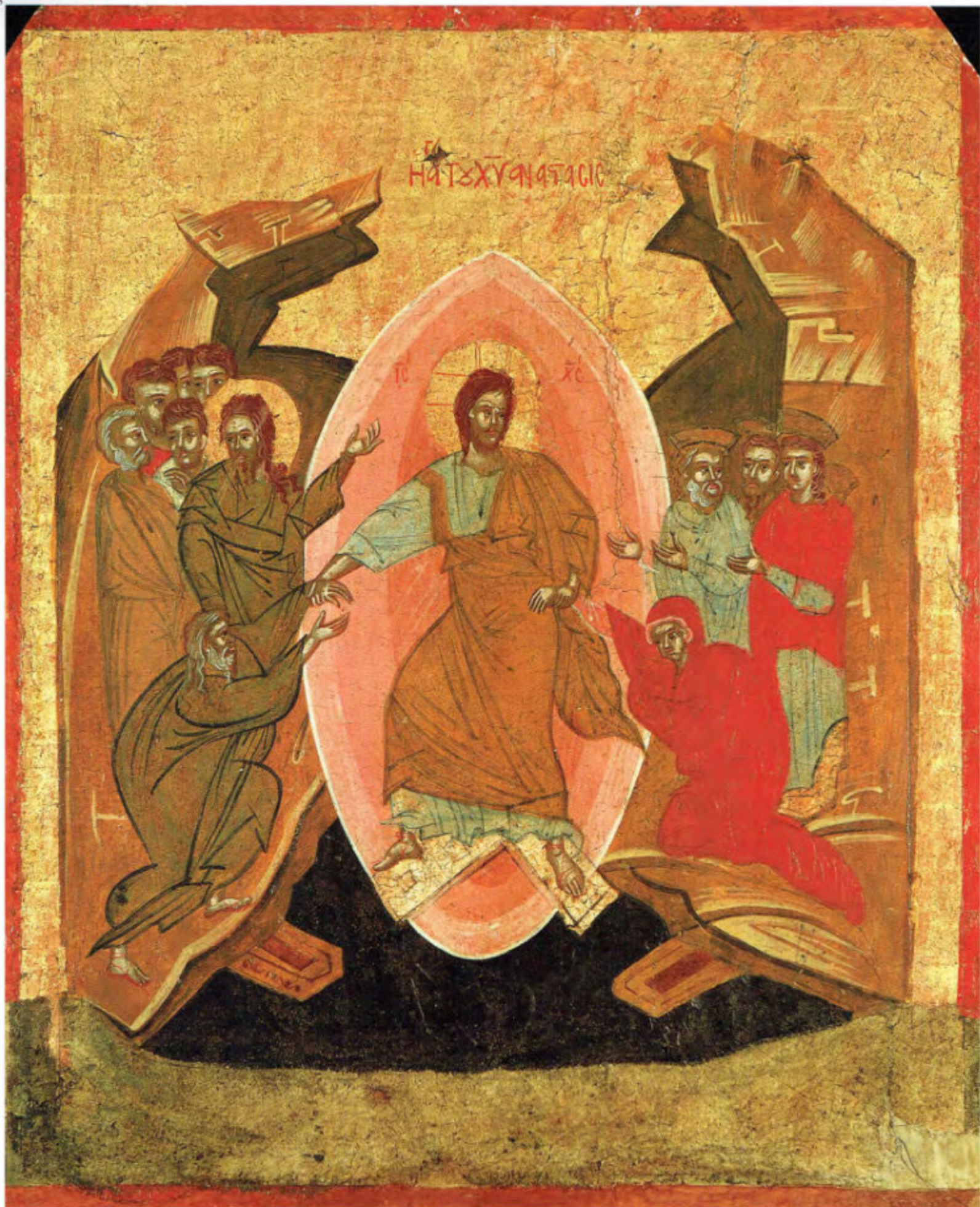
Iconostasi della Ss.ma Annunziata: 16. Resurrezione di Cristo. Anonimo greco. 1641. Arciconfraternita della Purificazione