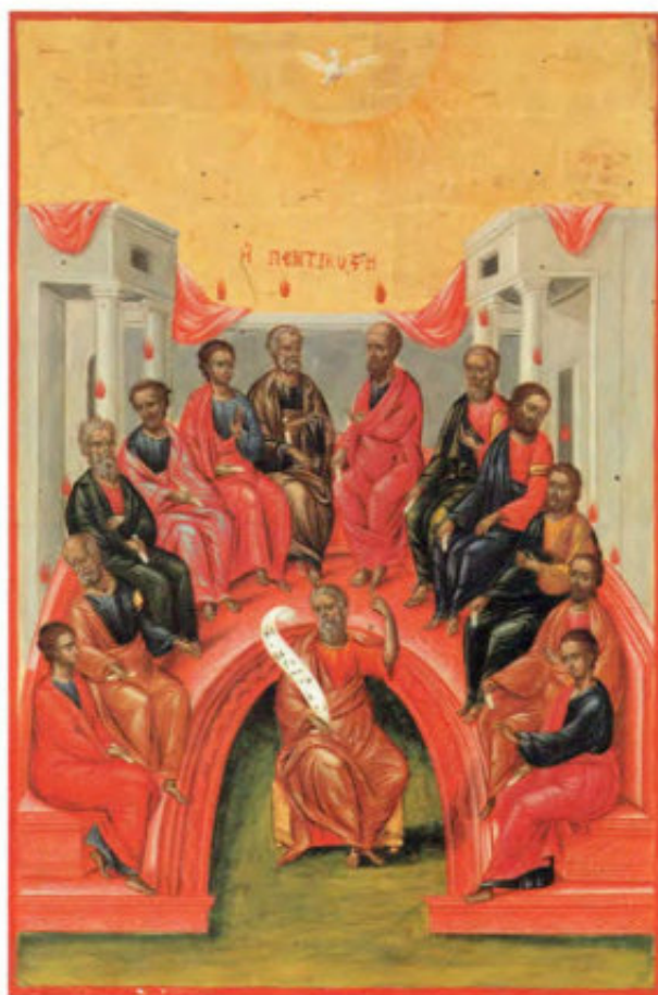
12. Pentecoste. Scuola ionica. Museo Fattori inv. n° 1240