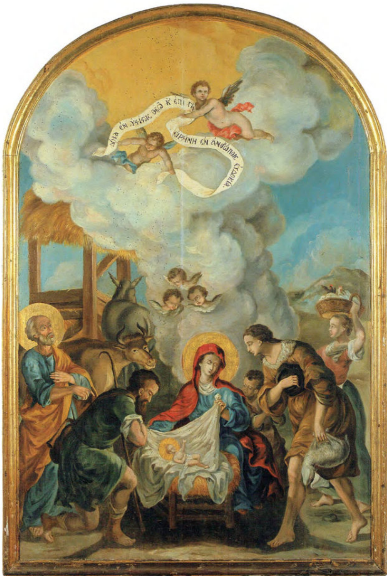
Chiesa della Ss.ma Trinità: 25. Natale (Adorazione dei pastori). Spiridon Romas. Livorno, dopo luglio 1766. Museo Fattori inv. n° 1220