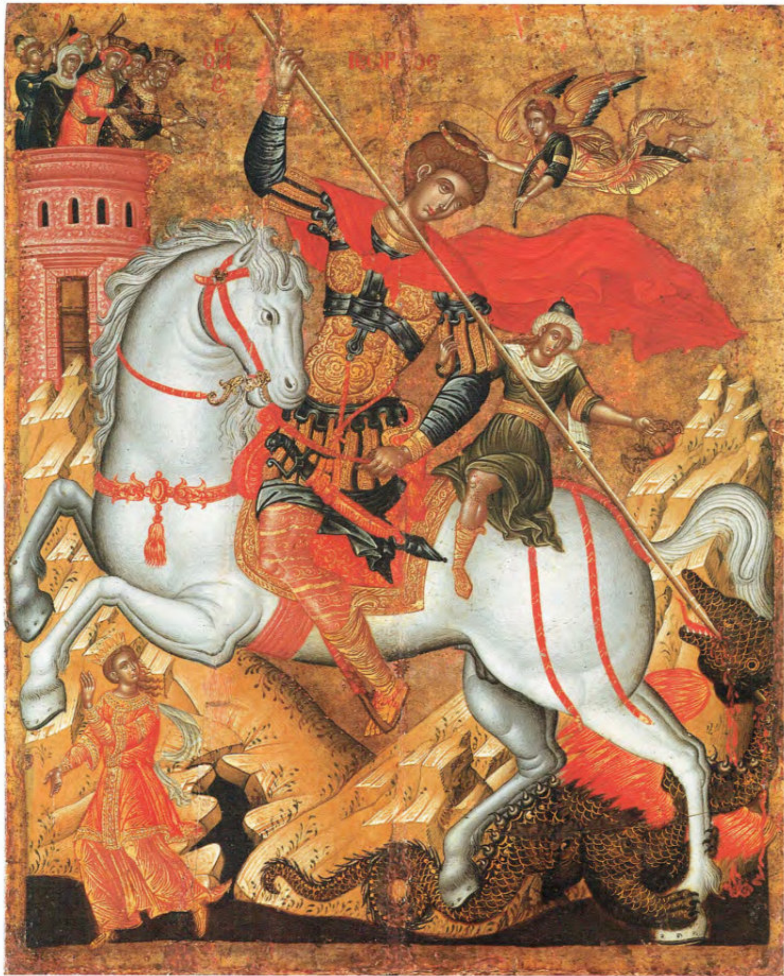
Le icone "sciolte": T10. San Giorgio. Scuola cretese. XVII secolo. Museo Fattori inv. n° 1253