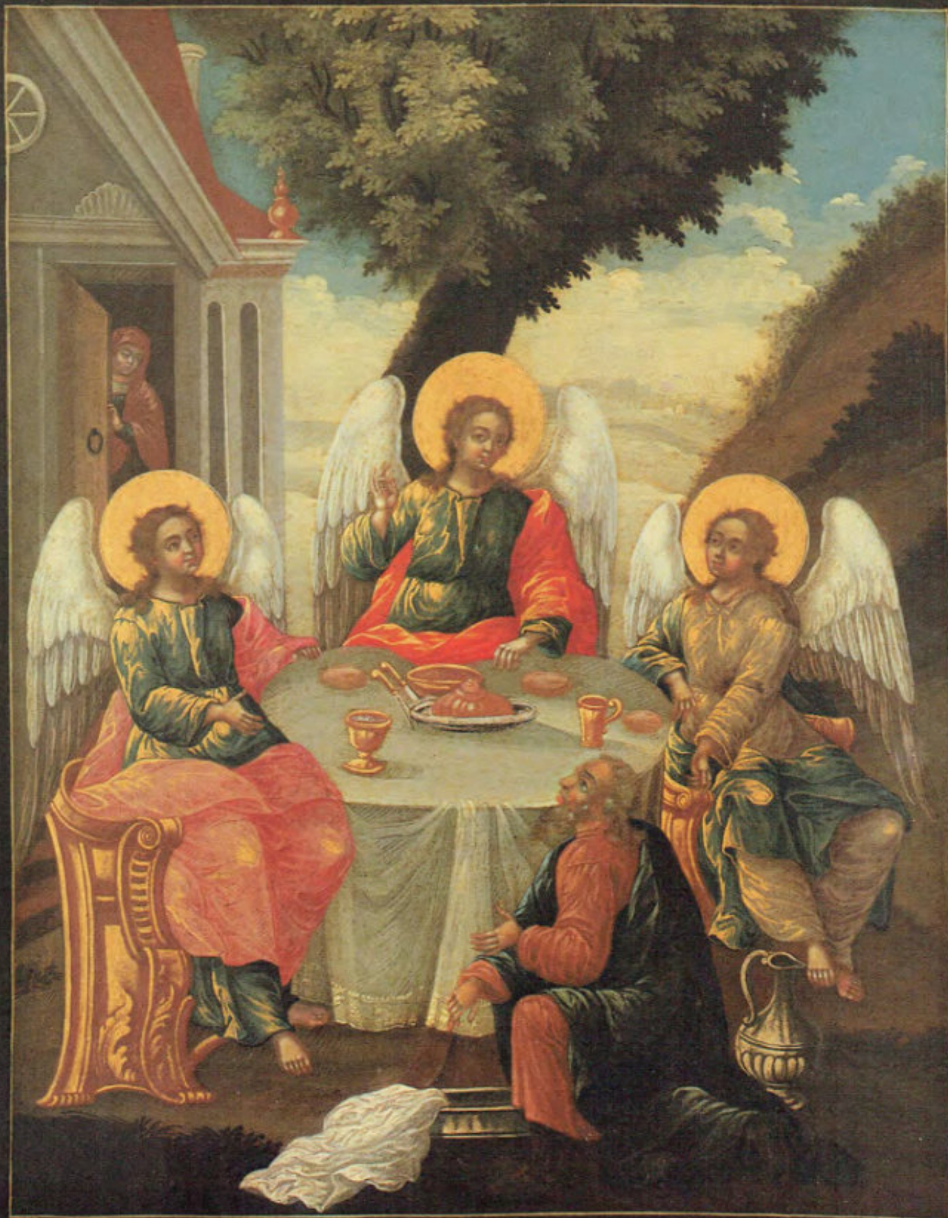
Iconostasi russa: 8. La Santissima Trinità (Pentecoste).

Anonimo russo. Mosca, metà del XVIII secolo. Scuola del Palazzo delle Armi. Museo Fattori inv. n° 1225