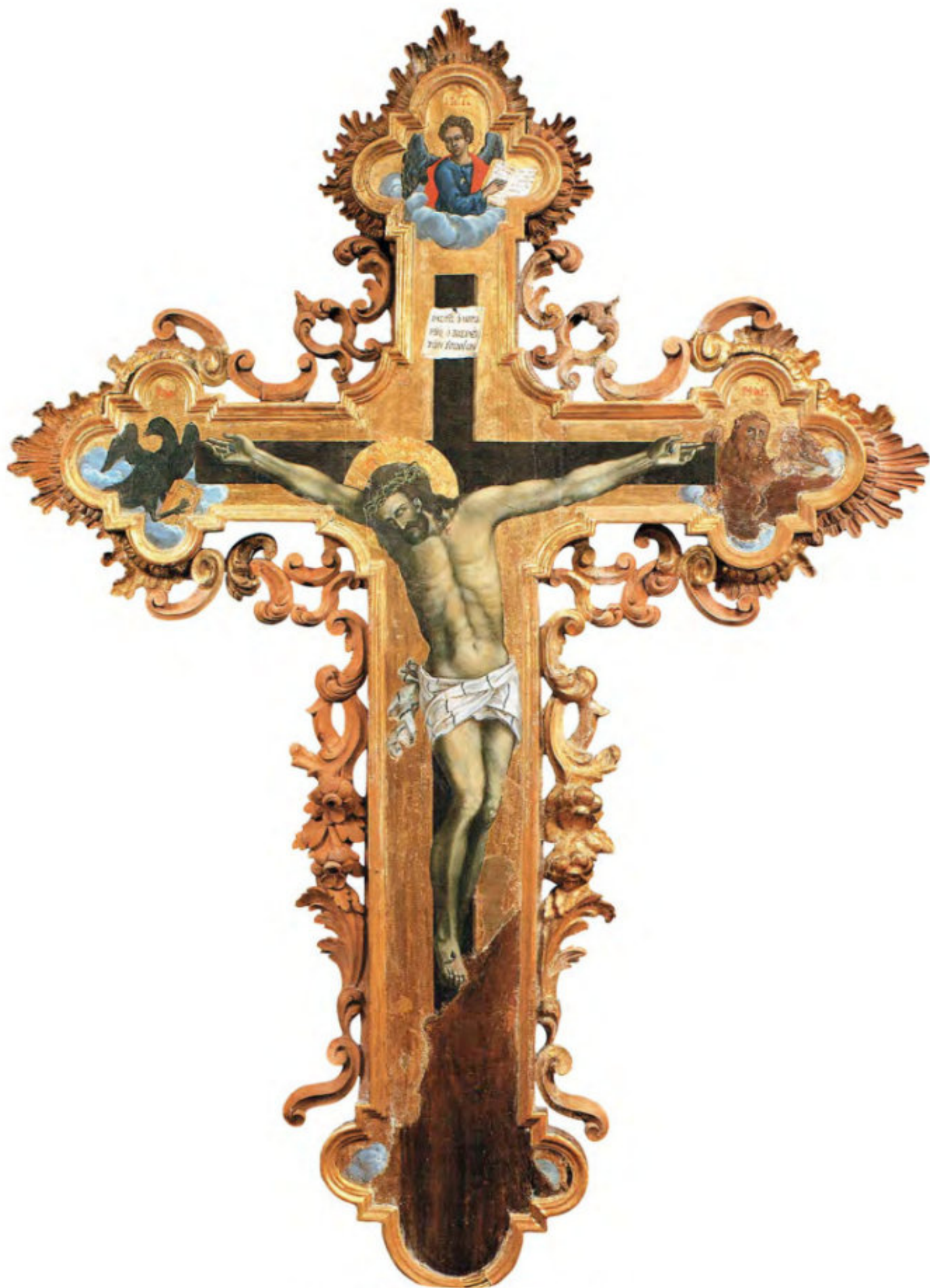
Iconostasi della Ss.ma Trinità: 22. Il Crocifisso.

Intaglio: Anonimo. Pittura: Spiridon Romas. Livorno, 1764-1765. Museo Fattori inv. n° 1260