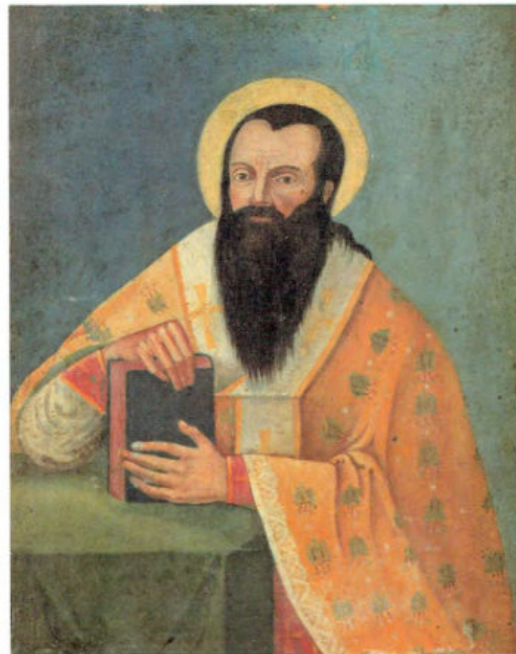
Le icone "sciolte": T12. San Nicola. Gioacchino Valamonte. Livorno, metà XIX secolo. Museo Fattori inv. n° 1285

T13. San Gerasimo. Gioacchino Valamonte. Livorno, metà del XIX secolo. Museo Fattori inv. n° 1286