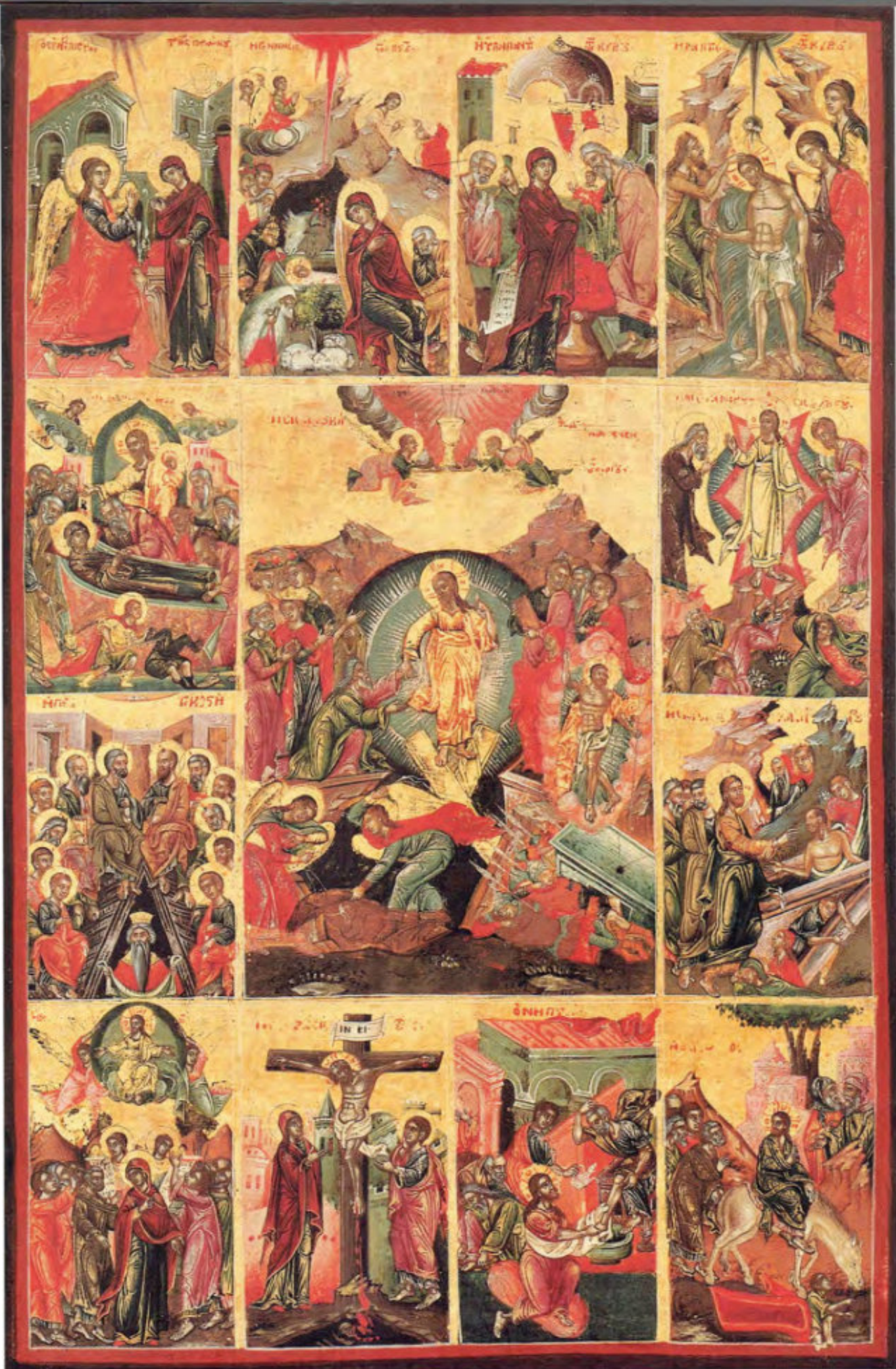
T16. Resurrezione e Dodici grandi feste. Scuola ionica. Fine XVIII secolo. Museo Fattori inv. n° 1233