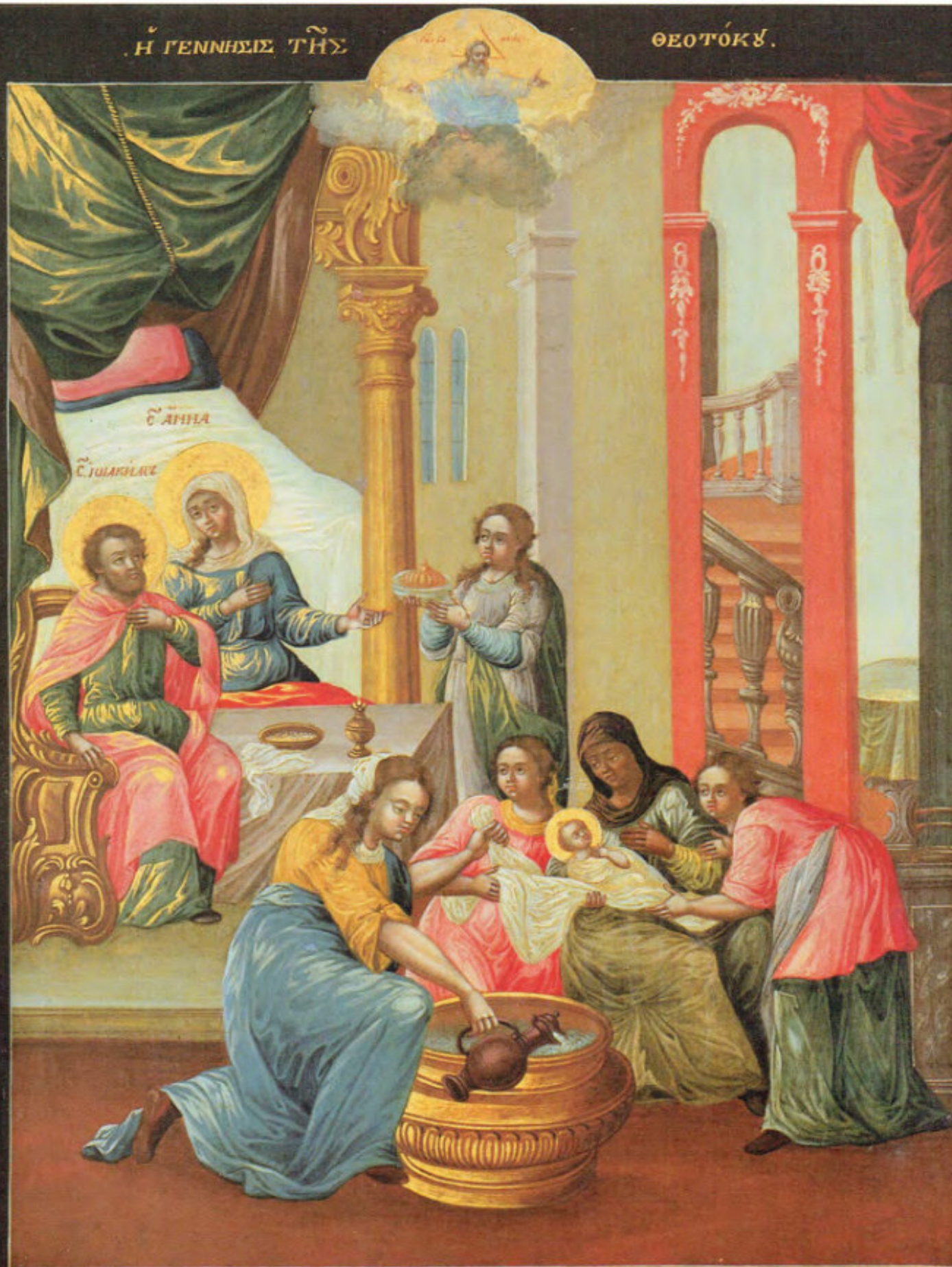
Iconostasi russa: 4. Natività della Madre di Dio.

Anonimo russo. Mosca, metà del XVIII secolo. Scuola del Palazzo delle Armi. Museo Fattori inv. n° 1226