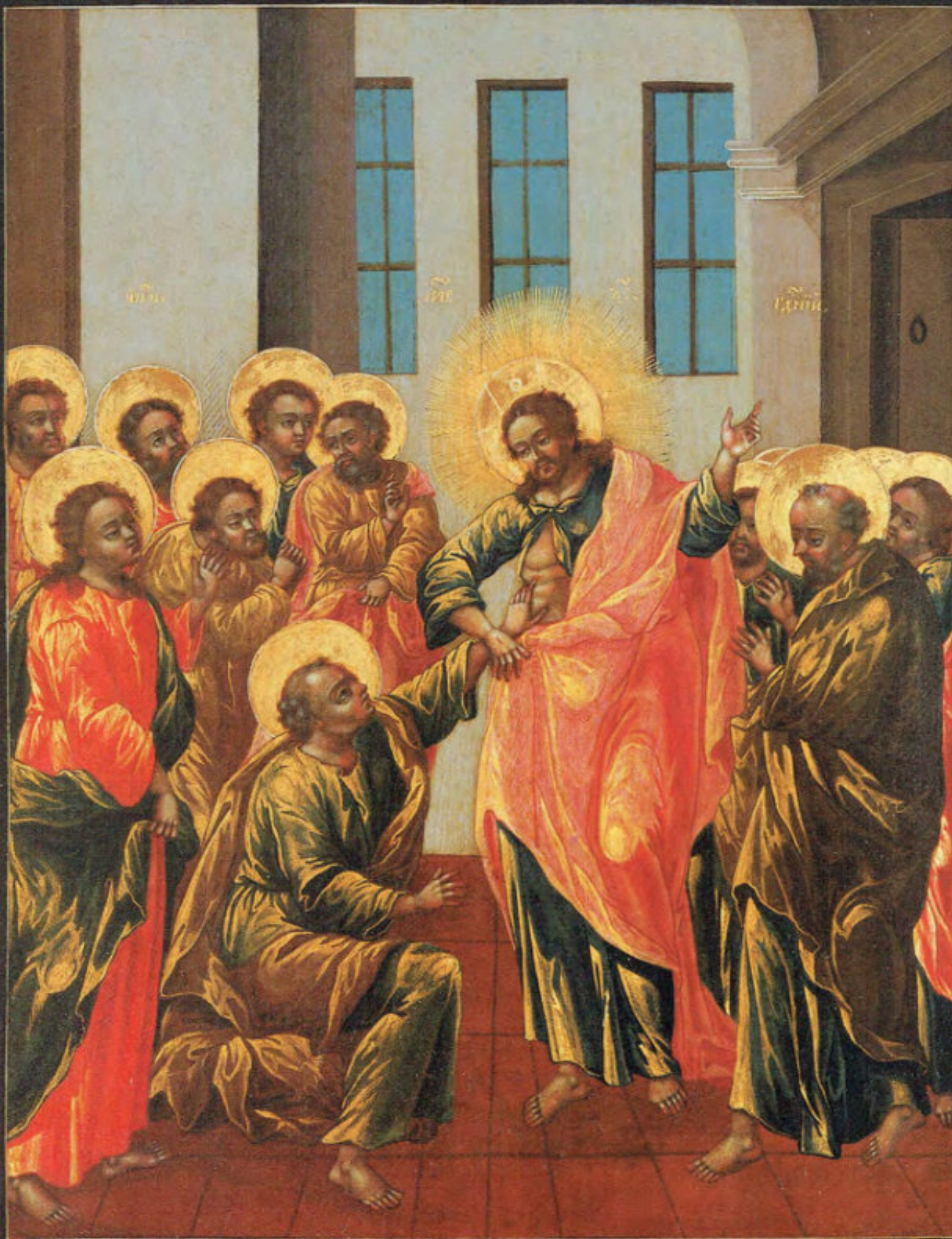
Iconostasi russa: 5. Incredulità di Tommaso.

Anonimo russo. Mosca, metà del XVIII secolo. Scuola del Palazzo delle Armi. Museo Fattori inv. n° 1230