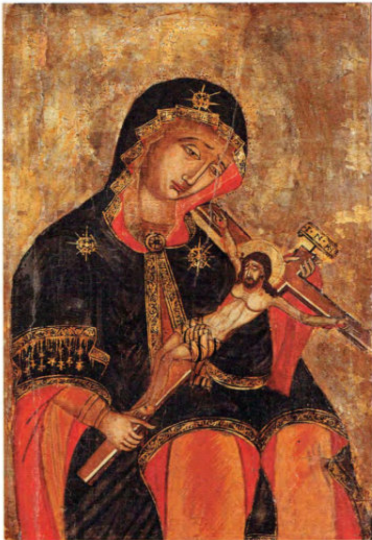
Le Icone "sciolte": T23. Madre di Dio con Crocifisso. Scuola ionica. Seconda metà del sec. XVIII. Museo Fattori inv. n° 1279/b