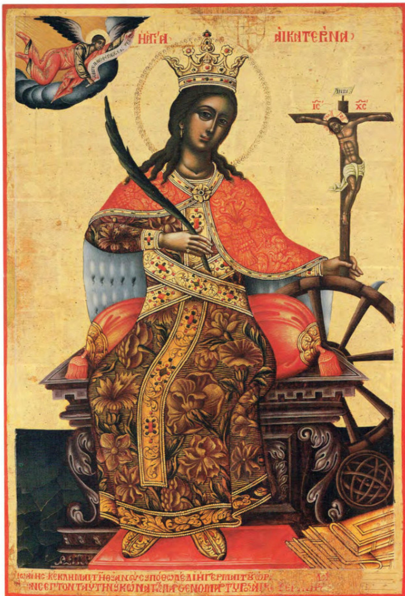
Le Icone "sciolte": T3. Santa Caterina di Alessandria.

Giovanni Cornaros. Ultimo quarto del XVIII secolo. Scuola cretese. Museo Fattori inv. n° 1246