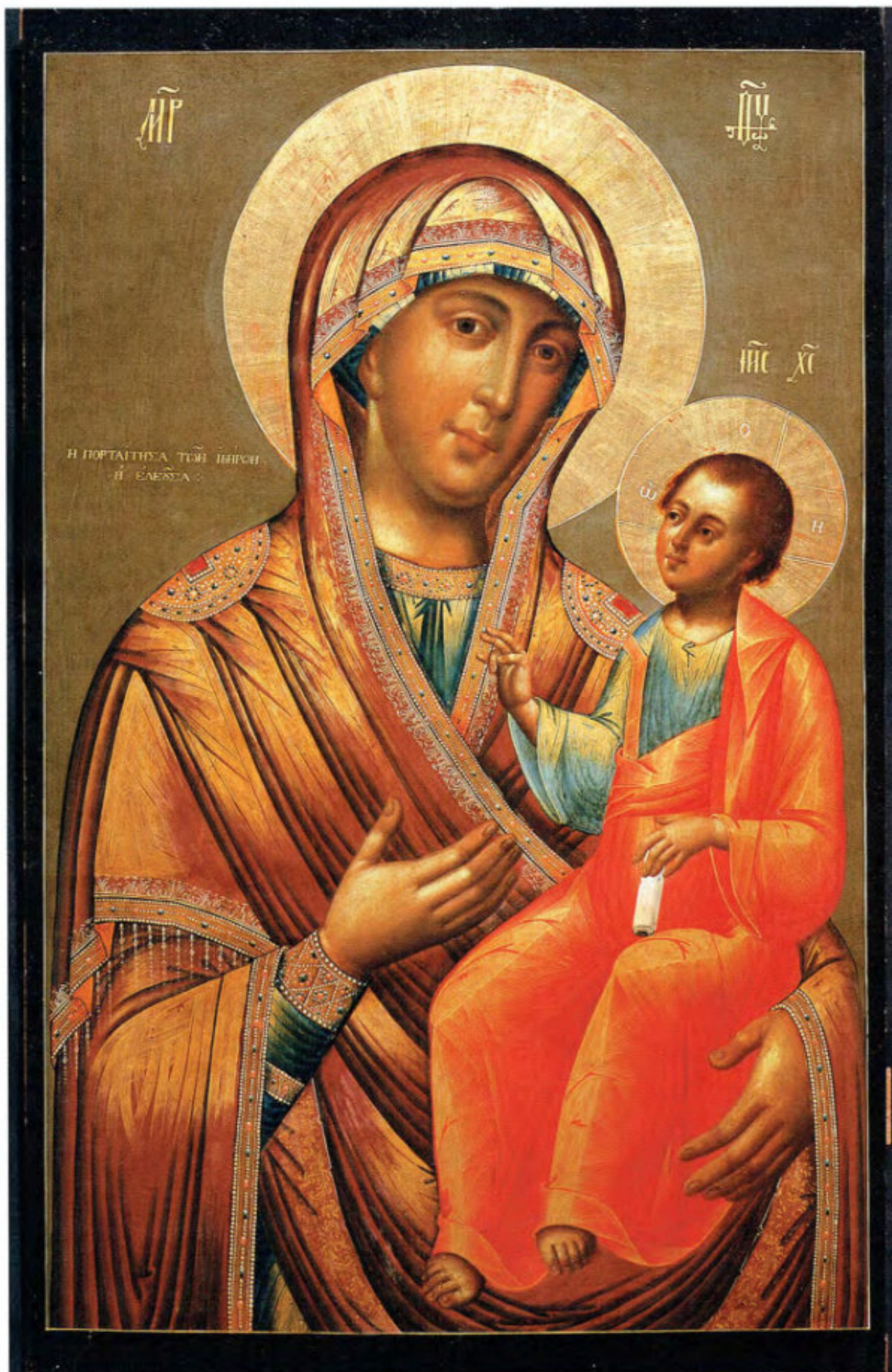
Iconostasi russa: 1. La Madre di Dio Eleousa .

Anonimo russo. Mosca, metà del XVIII secolo. Scuola del Palazzo delle Armi. Museo Fattori inv. n° 1194