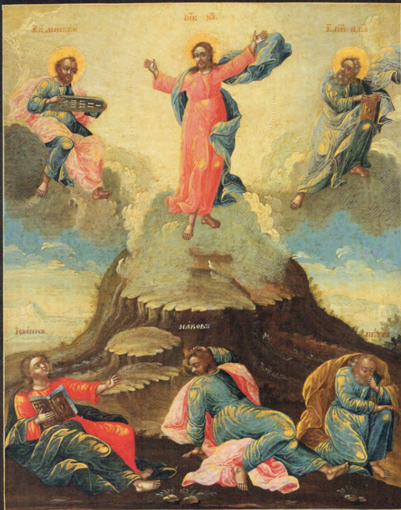
Iconostasi russa: 9. Trasfigurazione.

Anonimo russo. Mosca, metà del XVIII secolo. Scuola del Palazzo delle Armi. Museo Fattori inv. n° 1228