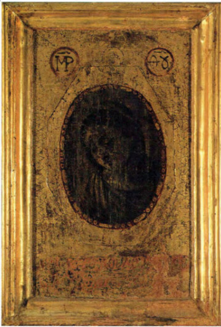
Iconostasi della Ss.ma Annunziata: 6. Vergine Annunziata. Anonimo greco, 1652. Arciconfraternita della Purificazione