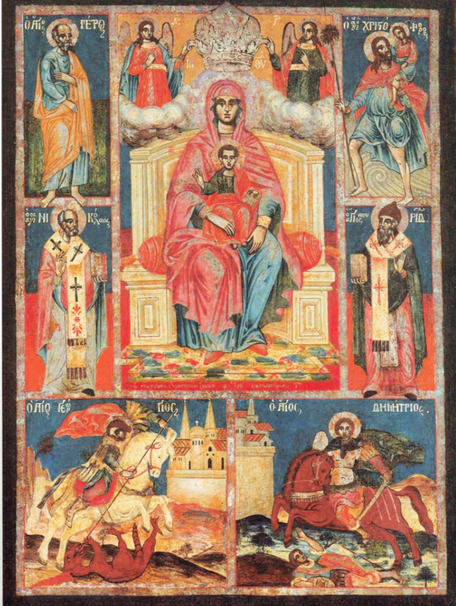
Le icone "sciolte": T6. Madre di Dio in trono e santi. Demetrio Zukis. 10 ottobre 1762. Museo Fattori inv. n° 1251