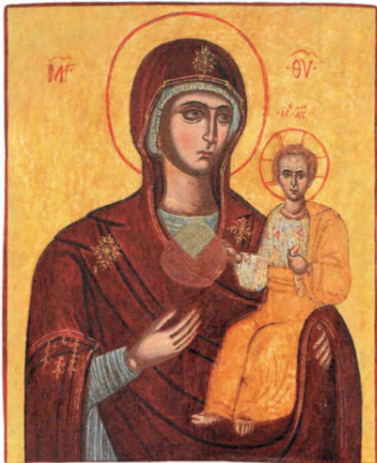
Le Icone "sciolte": T17. Madre di Dio Interceditrice. Scuola ionica. Fine XIX secolo. Museo Fattori inv. n° 1214 T 21. Santa Parasceve. Scuola ionica. XIX secolo. Museo Fattori inv. n° 1245 T18. Santi Boris e Gleb. Fine XVIII secolo. Russia centrale. Museo Fattori inv. n° 1217 T19. Madre di Dio Odigitria. Fine XIX secolo. Popolare. Museo Fattori inv. n° 1216