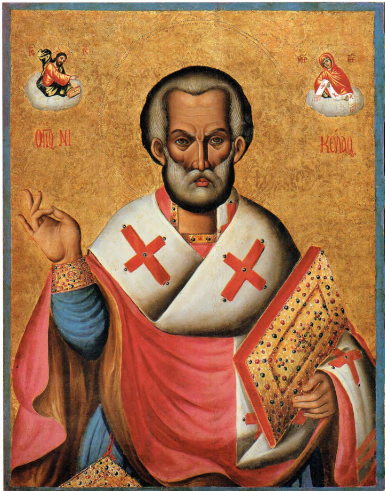
Iconostasi del vecchio Cimitero: 5. San Nicola. Scuola ionica. Seconda metà del sec. XVIII. Museo Fattori inv. n° 1203a