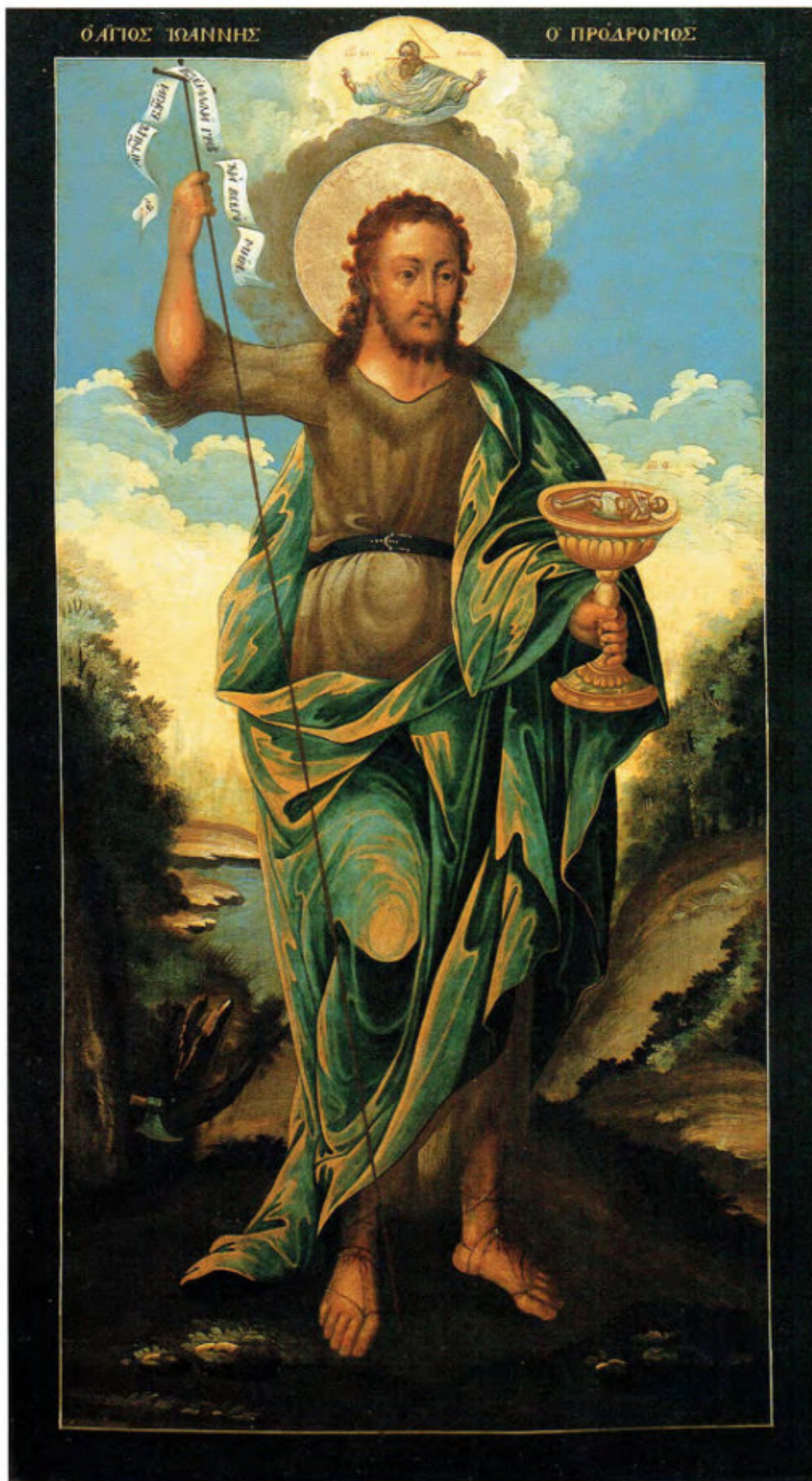
Iconostasi russa: 2. San Giovanni il Precursore.

Anonimo russo. Mosca, metà del XVIII secolo. Scuola del Palazzo delle Armi. Museo Fattori inv. n° 1196