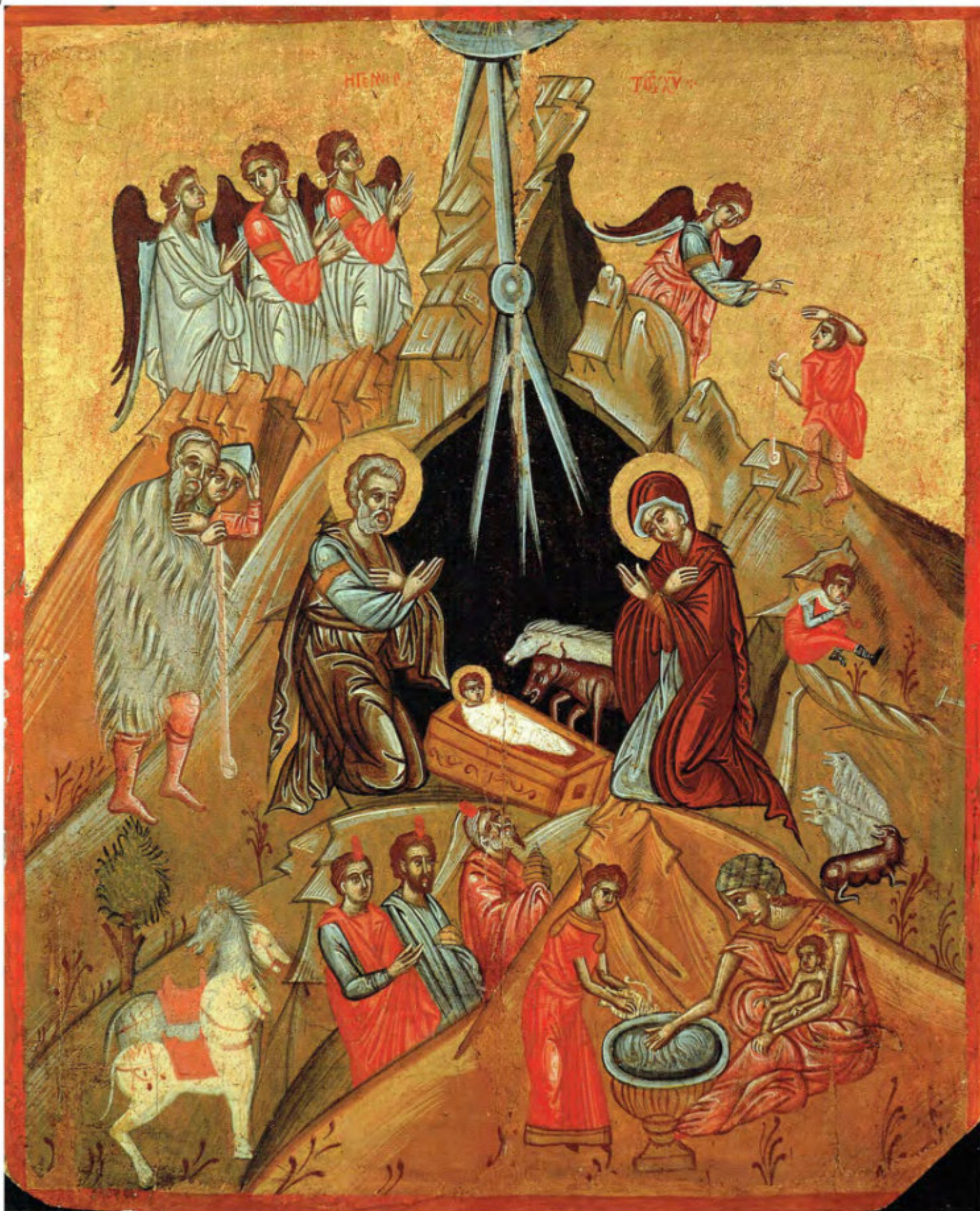
Iconostasi della Ss.ma Annunziata: 8. Natale. Anonimo greco. 1641. Arciconfraternita della Purificazione