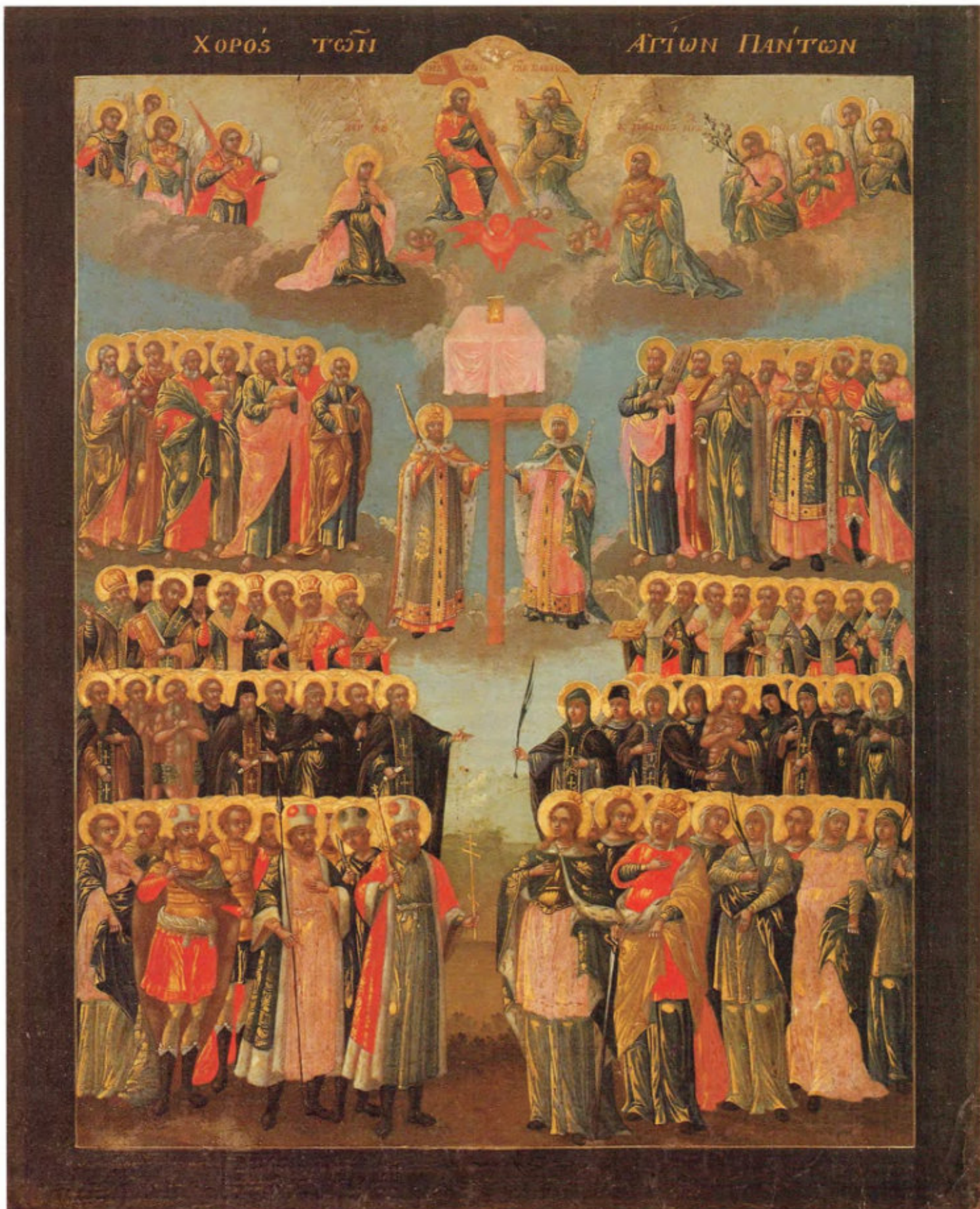
Iconostasi russa: 12. Tutti i Santi.

Anonimo russo. Mosca, metà del XVIII secolo. Scuola del Palazzo delle Armi. Museo Fattori inv. n° 1231