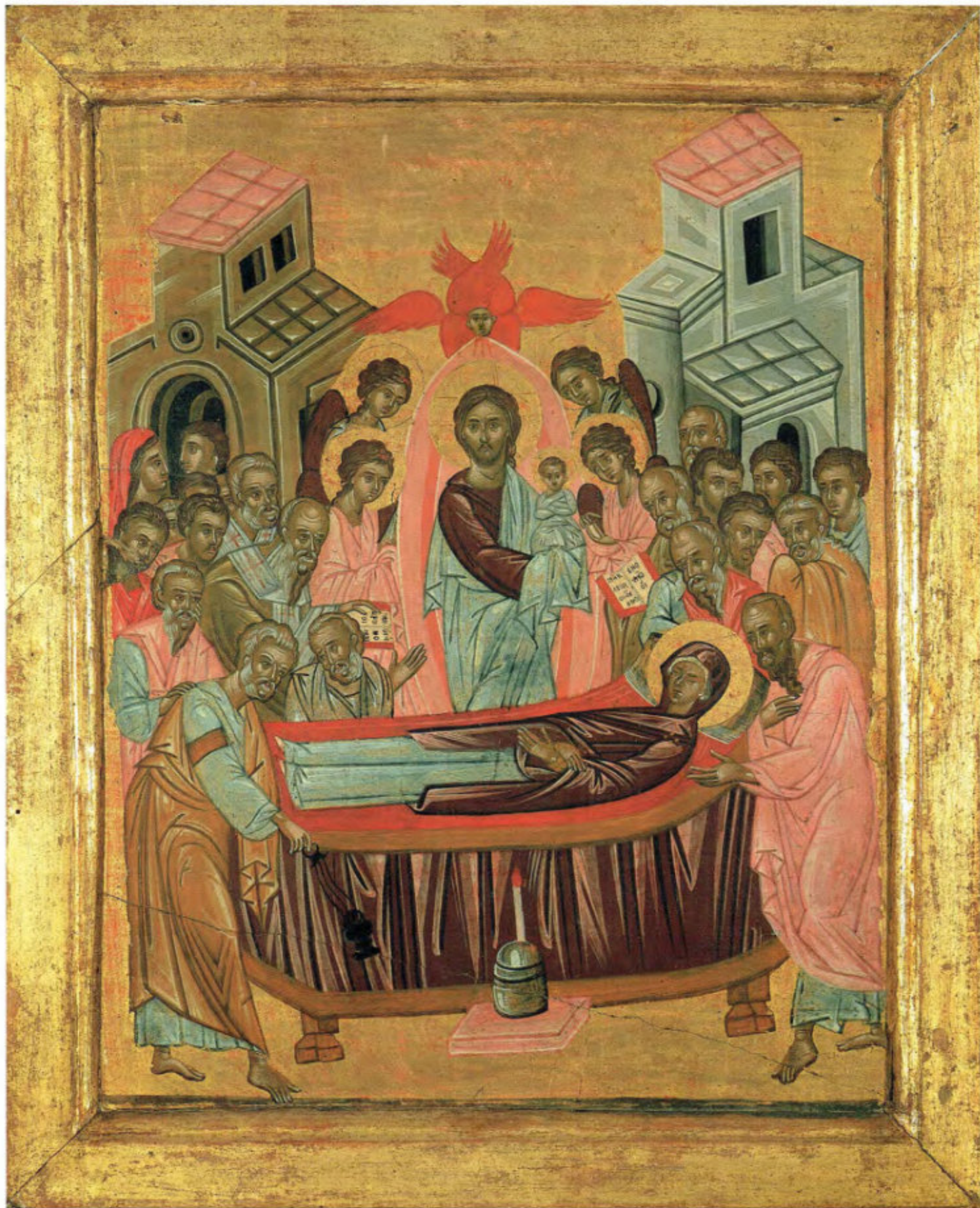
Iconostasi della Ss.ma Annunziata: 19. Dormizione della Madre di Dio. Anonimo greco. 1641. Arciconfraternita della Purificazione