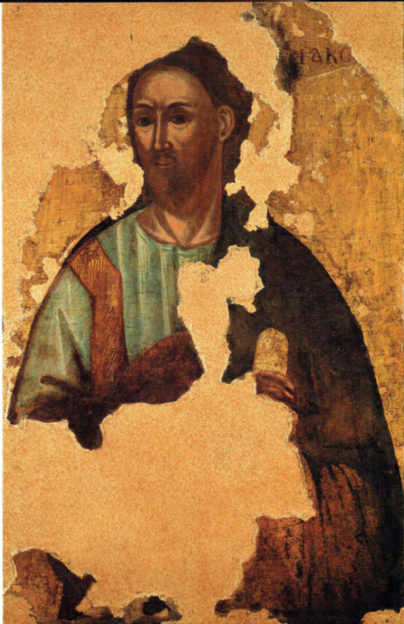
Le Icone "sciolte": A3. San Giacomo Apostolo. Anonimo greco. XVII secolo. Arciconfraternita della Purificazione