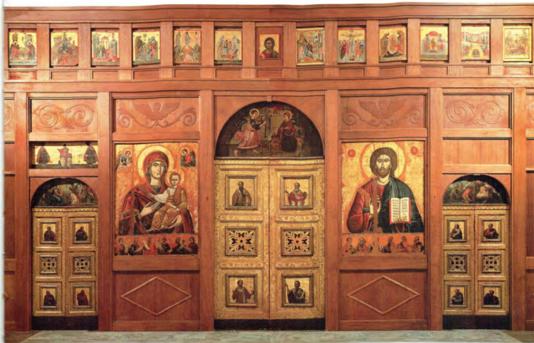
Iconostasi della Ss.ma Annunziata: Le porte. Agostino Wanonbrachen. 1750. Arciconfraternita della Purificazione