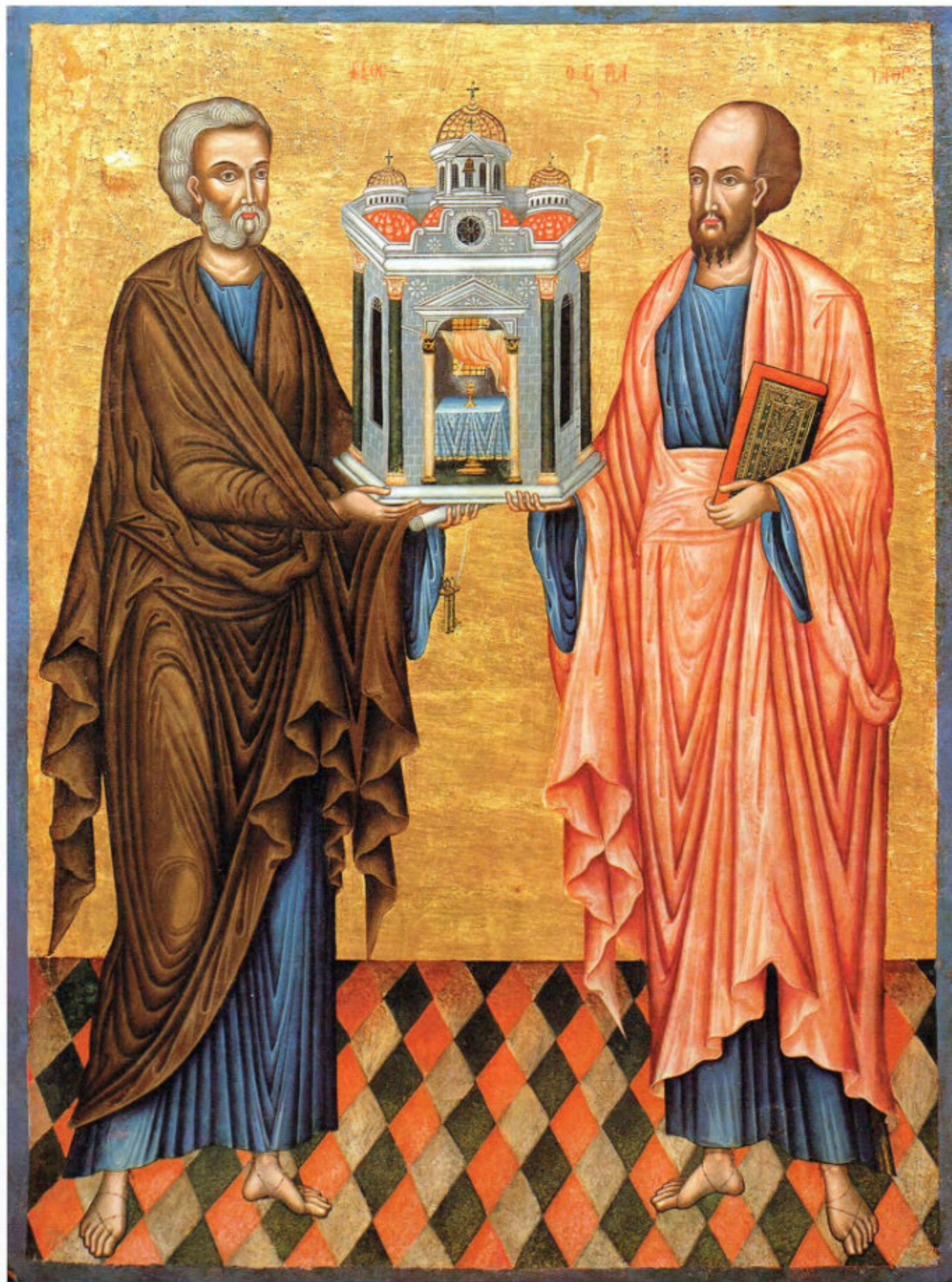
Iconostasi del vecchio Cimitero: 7. Santi Pietro e Paolo. Scuola ionica. Ultimo quarto del sec. XVIII. Museo Fattori inv. n° 1205