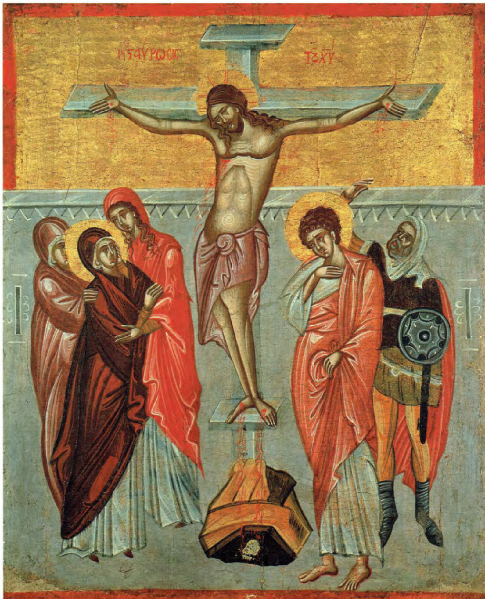
Iconostasi della Ss.ma Annunziata: 15. Crocifissione. Anonimo greco. 1641. Arciconfraternita della Purificazione