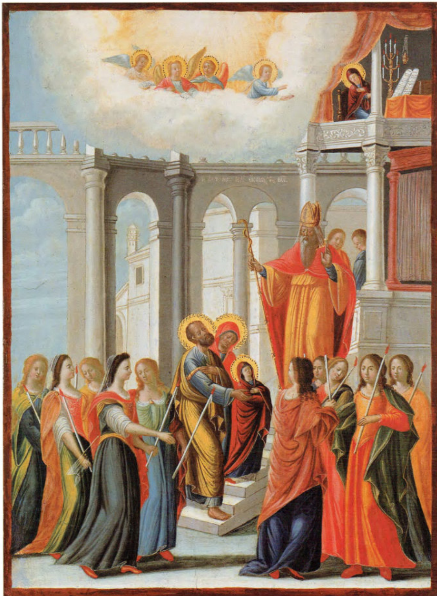
Iconostasi del vecchio Cimitero: 9. Presentazione al Tempio di Maria. Scuola ionica. Ultimo quarto del sec. XVIII. Museo Fattori inv. n° 1237