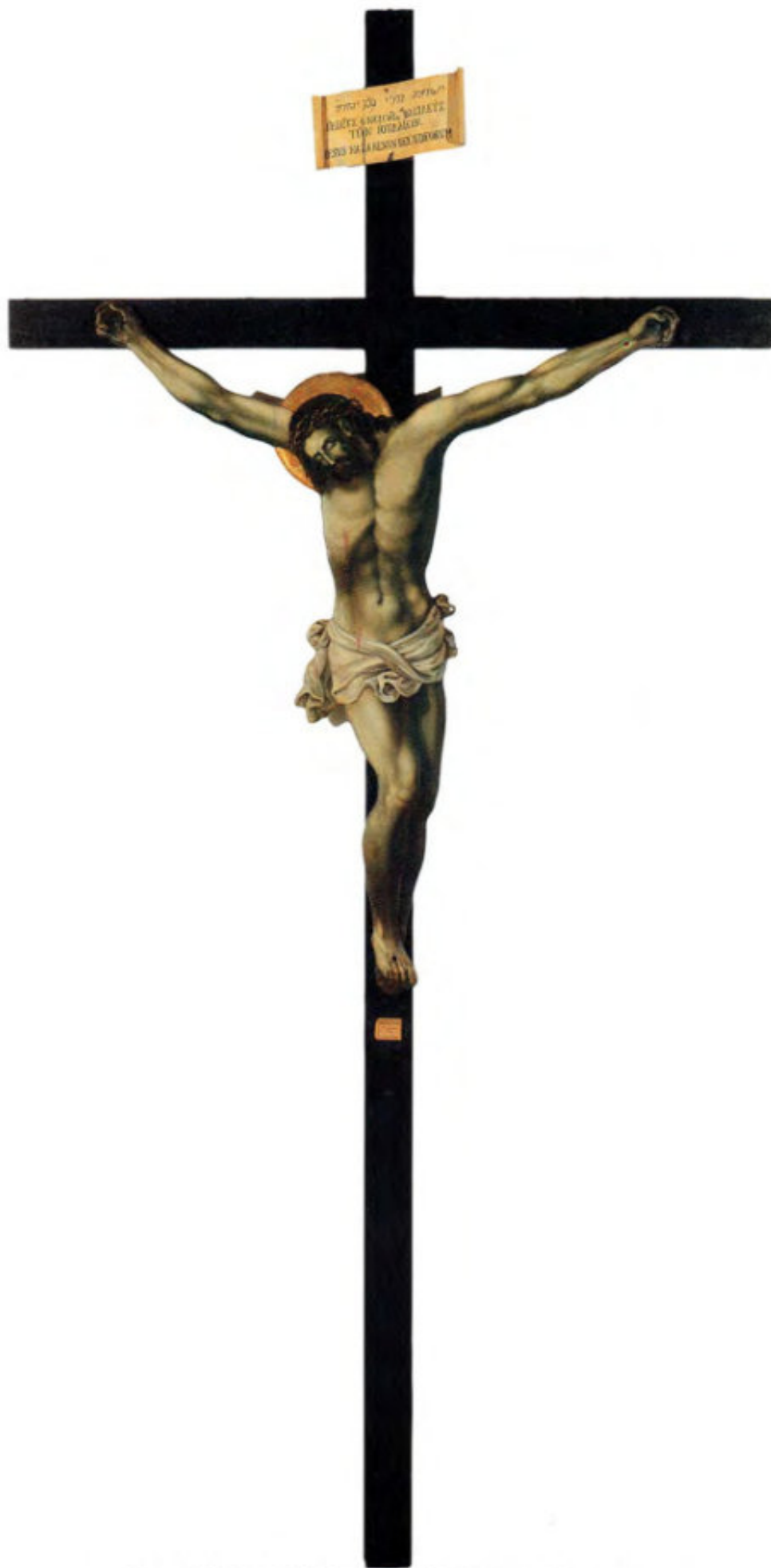
Chiesa della Ss.ma Trinità: 28. Crocifisso dipinto sui due versi. Scuola ionica. Fine XVIII secolo. Museo Fattori inv. n° 1219