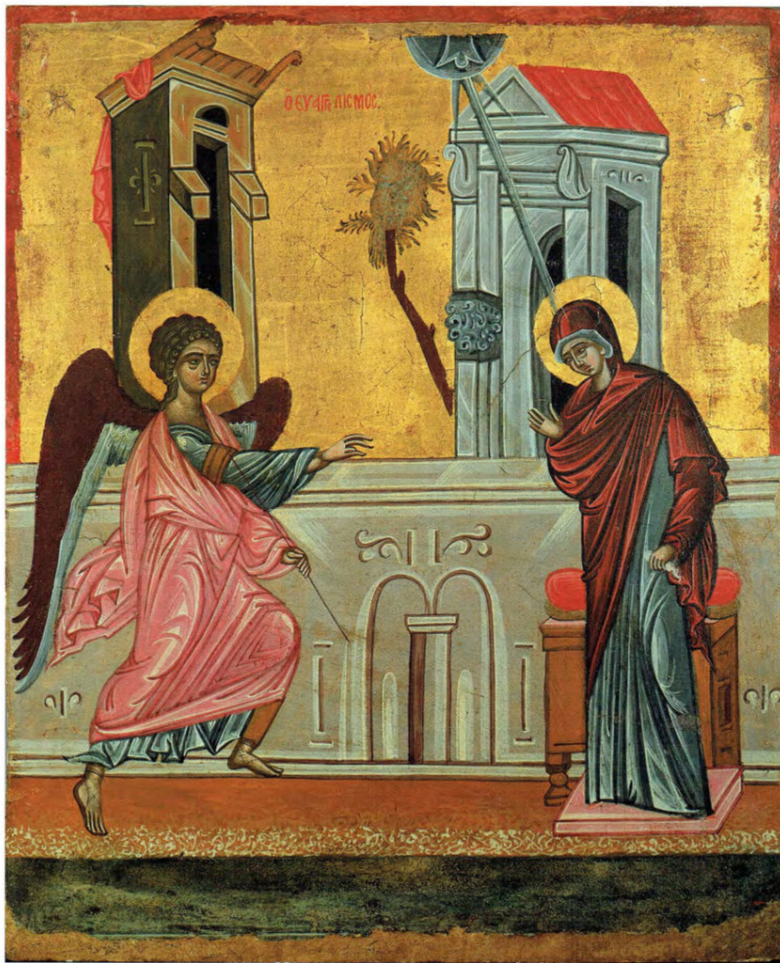
Iconostasi della Ss.ma Annunziata: 7. Annunciazione. Anonimo greco. 1641. Arciconfraternita della Purificazione