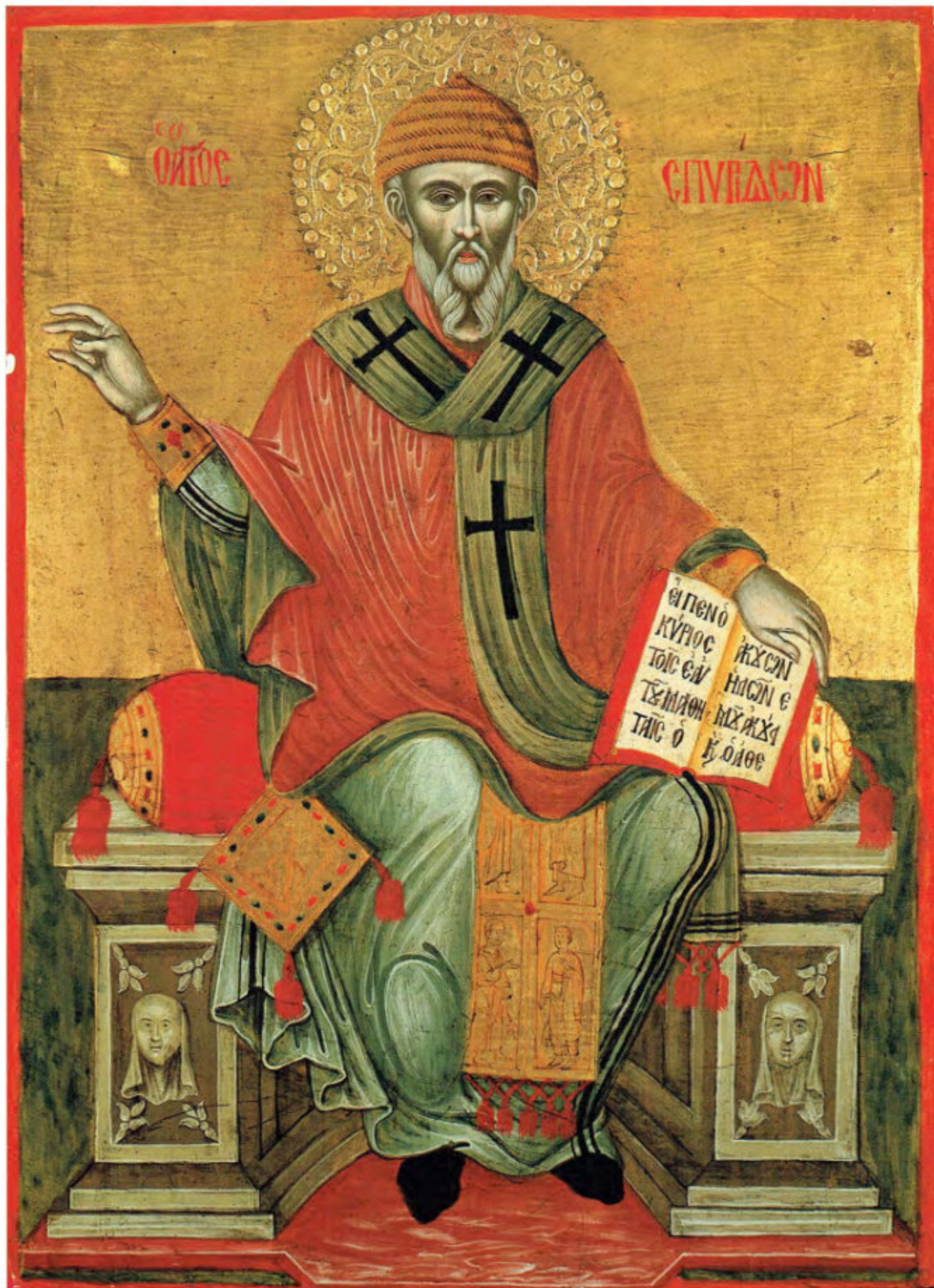
Le Icone "sciolte": A5. Santo Spiridione.

Scuola cretese. XVII secolo. Arciconfraternita della Purificazione