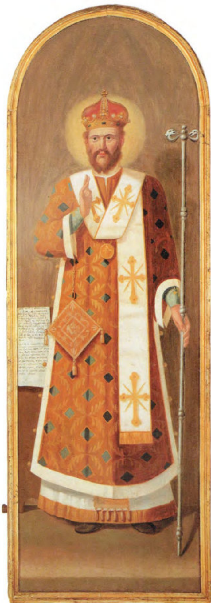
Iconostasi del vecchio Cimitero: 1. La porta del Diakonikòn : San Giovanni il Battista. Scuola ionica. Ultimo quarto del sec. XVIII. Museo Fattori inv. n° 1293 2. La porta della Pròthesis : San Basilio il Grande. Scuola ionica. Ultimo quarto del sec. XVIII. Museo Fattori inv. n° 1292