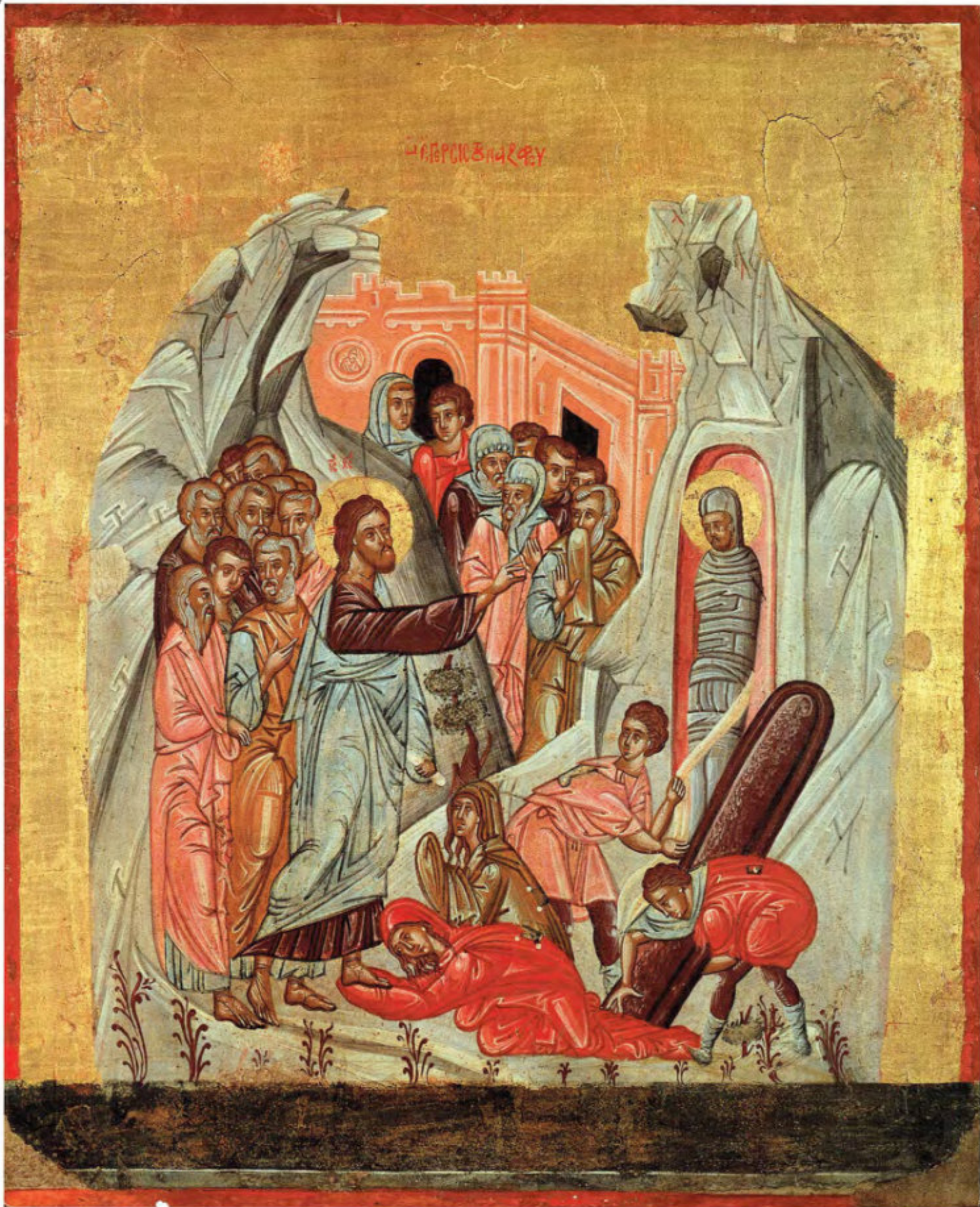
Iconostasi della Ss.ma Annunziata: 12. Resurrezione di Lazzaro. Anonimo greco, 1641. Arciconfraternita della Purificazione