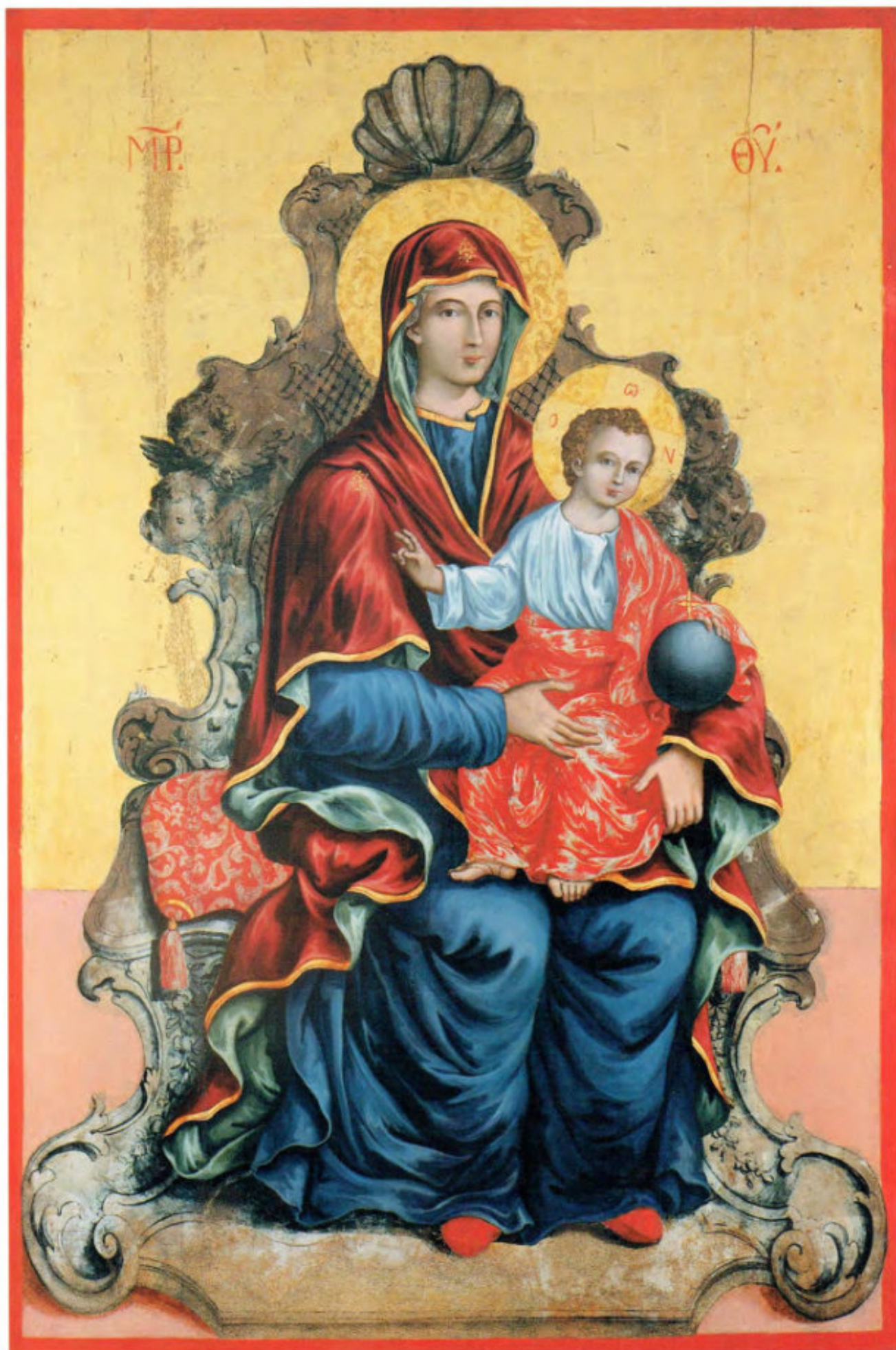
Iconostasi della Ss.ma Trinità: 2. Madre di Dio in trono. Spiridon Romas. Livorno, 1764. Museo Fattori inv. n° 1277