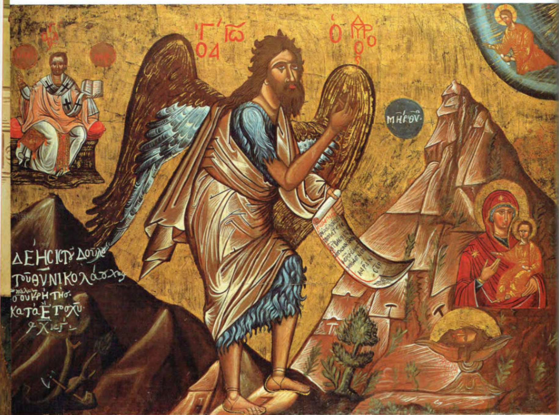
Le Icone "sciolte": A2. San Giovanni Battista con la Madre di Dio Odigitria e san Nicola in trono. Anonimo cretese. 1623. Arciconfraternita della Purificazione

Anthimos Kolas di Zante (?). Prima metà del XVII secolo. Arciconfraternita della Purificazione