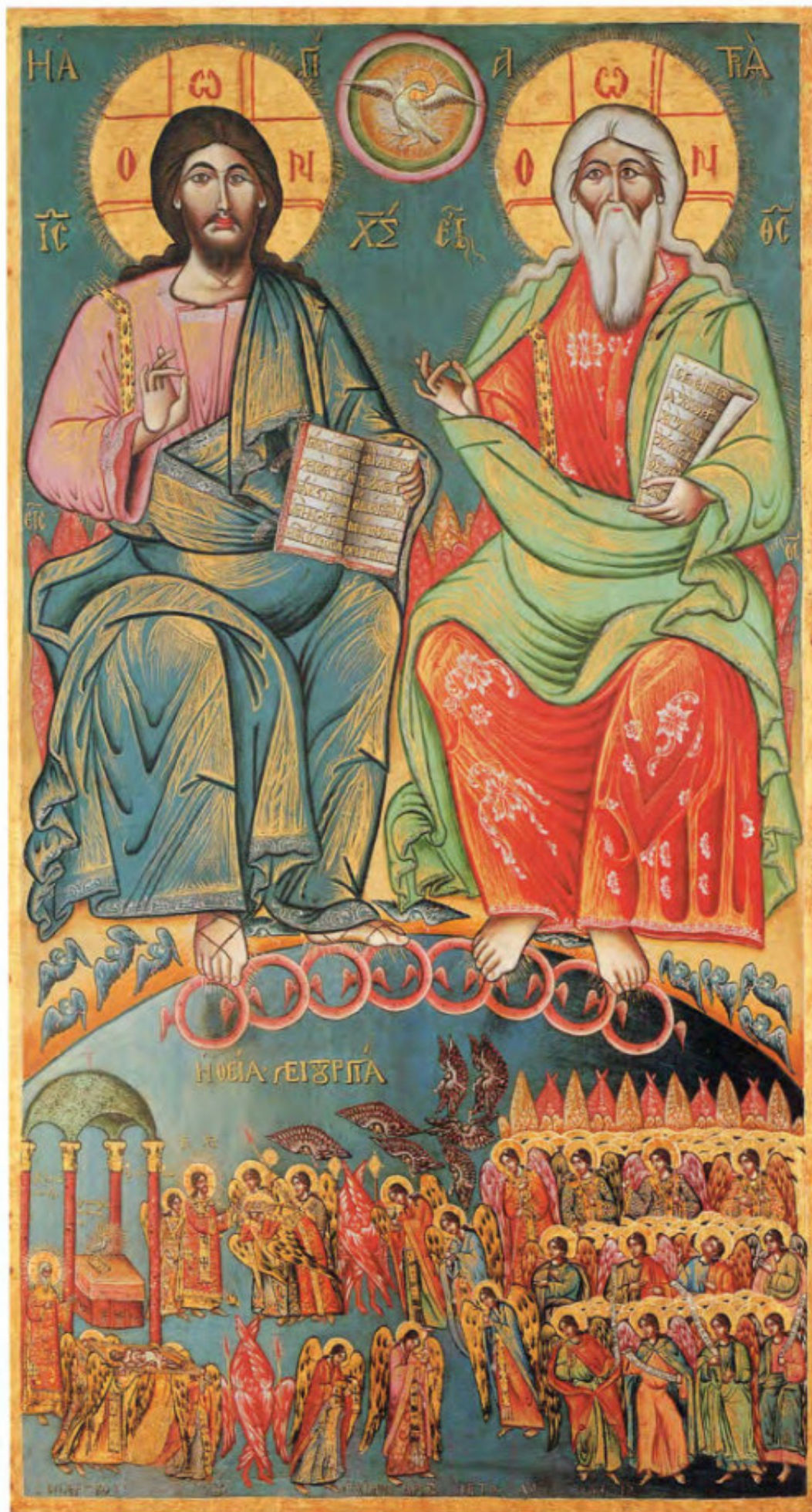
Chiesa della Ss.ma Trinità: Ss.ma Trinità del Nuovo Testamento. Archimandrita Mosè di Creta, Livorno, 1761, 12 novembre, Museo Fattori inv. n° 1198