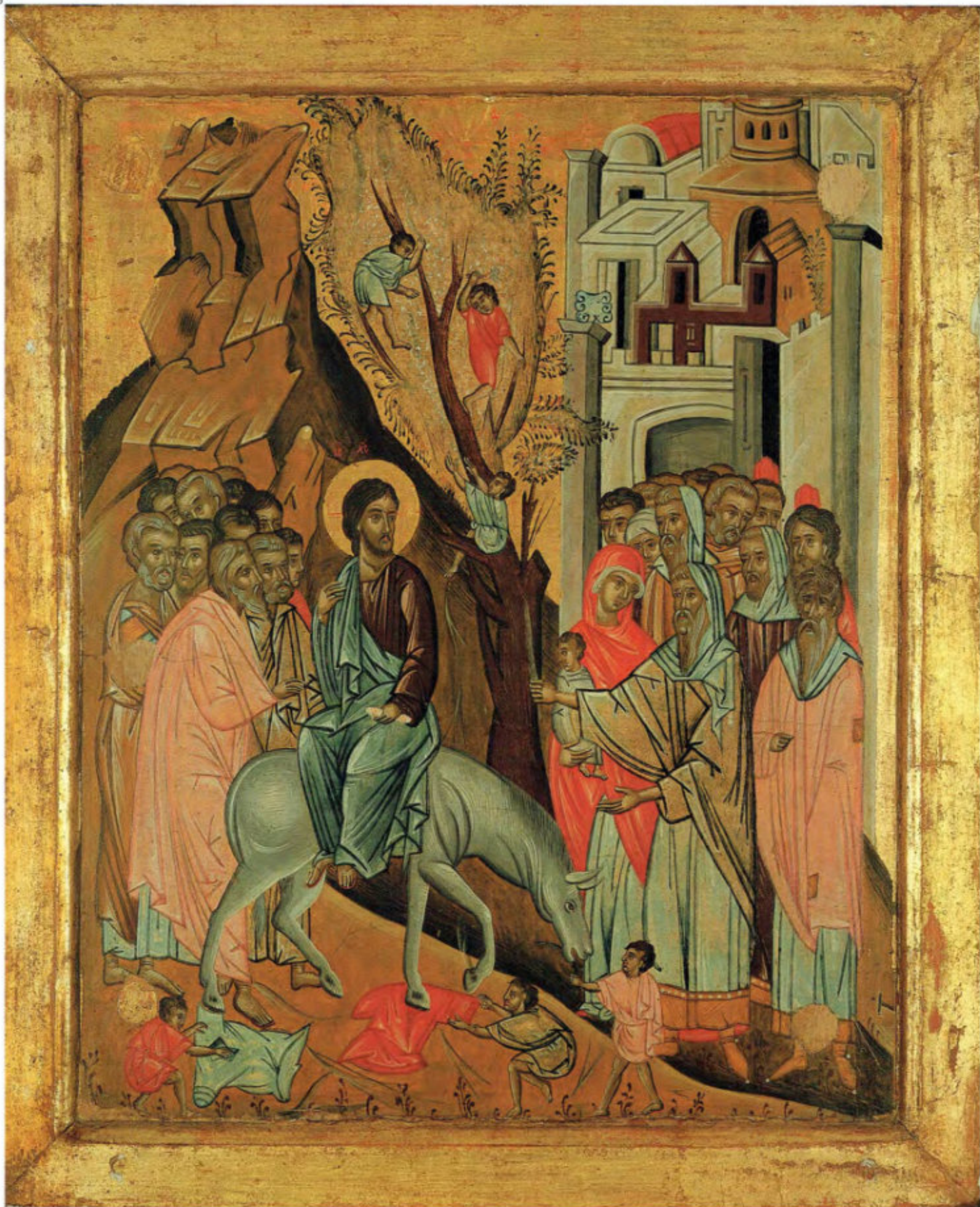
Iconostasi della Ss.ma Annunziata: 14. Ingresso a Gerusalemme. Anonimo greco. 1641. Arciconfraternita della Purificazione