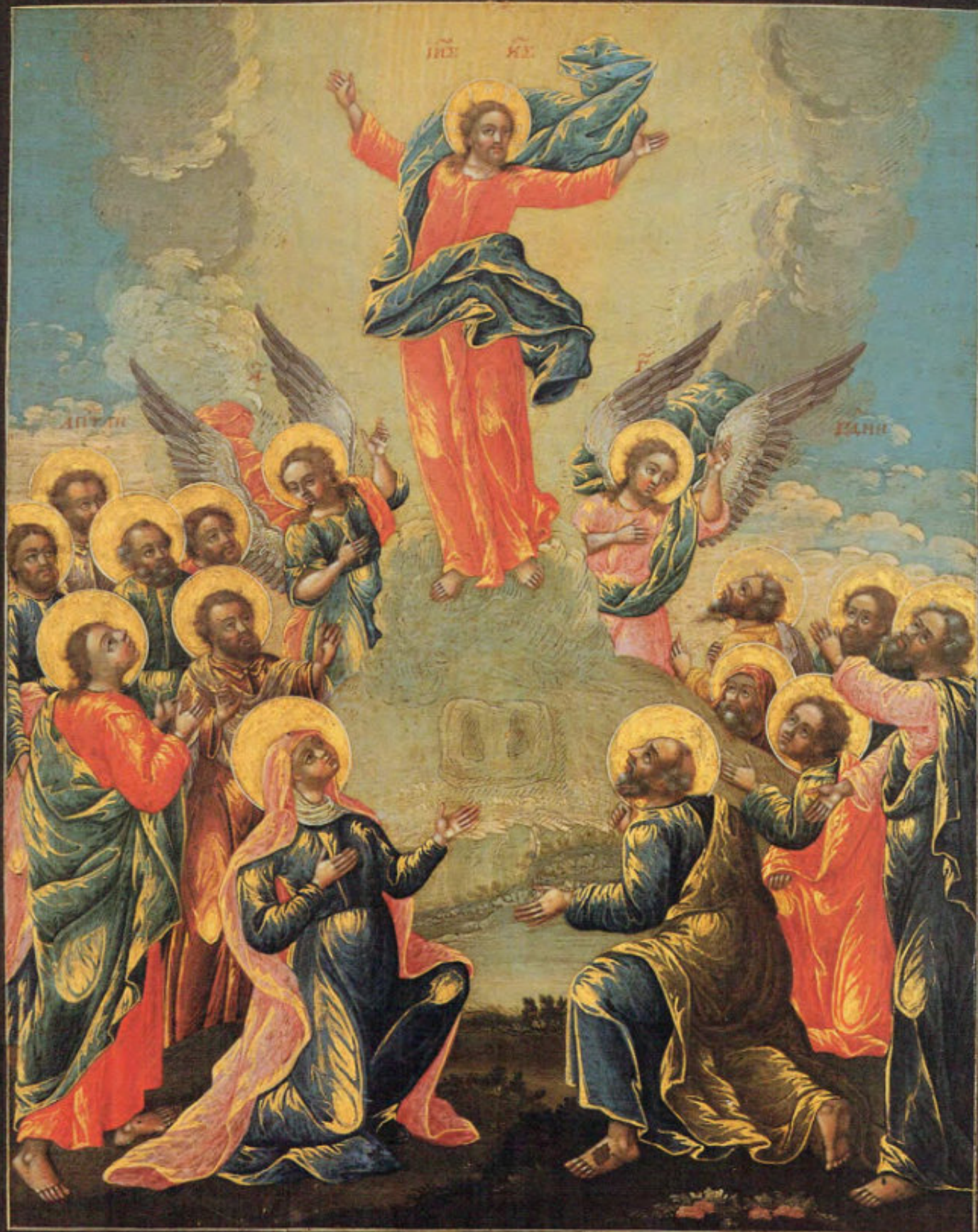
Iconostasi russa: 7. Ascensione.

Anonimo russo. Mosca, metà del XVIII secolo. Scuola del Palazzo delle Armi. Museo Fattori inv. n° 1223