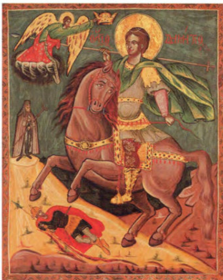
Le Icone "sciolte": T5. San Bessarione. Atanasio di Kalarite in Epiro, 10 febbraio 1796. Scuola ionica. Museo Fattori inv. n° 1235 T7. Sant'Eustachio. XIX secolo. Popolare. Museo Fattori inv. n° 1248 T8. San Demetrio. Scuola cretese. XVIII secolo. Museo Fattori inv. n° 1234 T9. San Demetrio. Fine XVIII inizi XIX secolo. Popolare. Museo Fattori inv. n° 1252