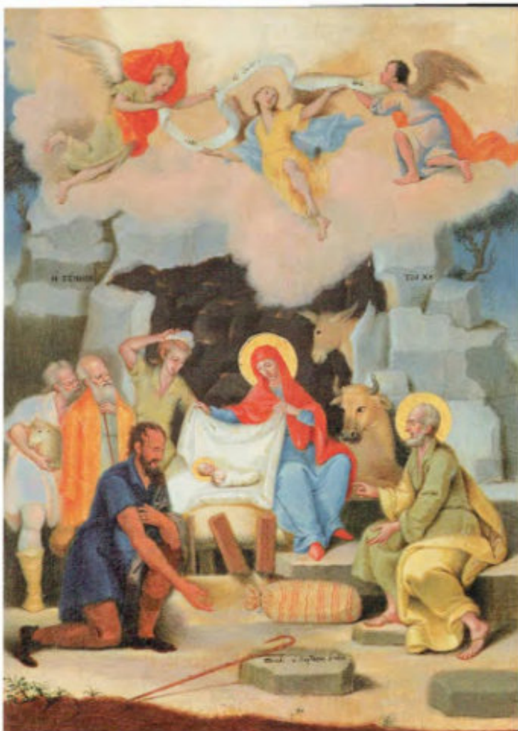
Iconostasi del vecchio Cimitero: 11. Natale (Adorazione dei pastori). Spiridon Venturas, Ultimo quarto del sec. XVIII. Museo Fattori inv. n° 1288