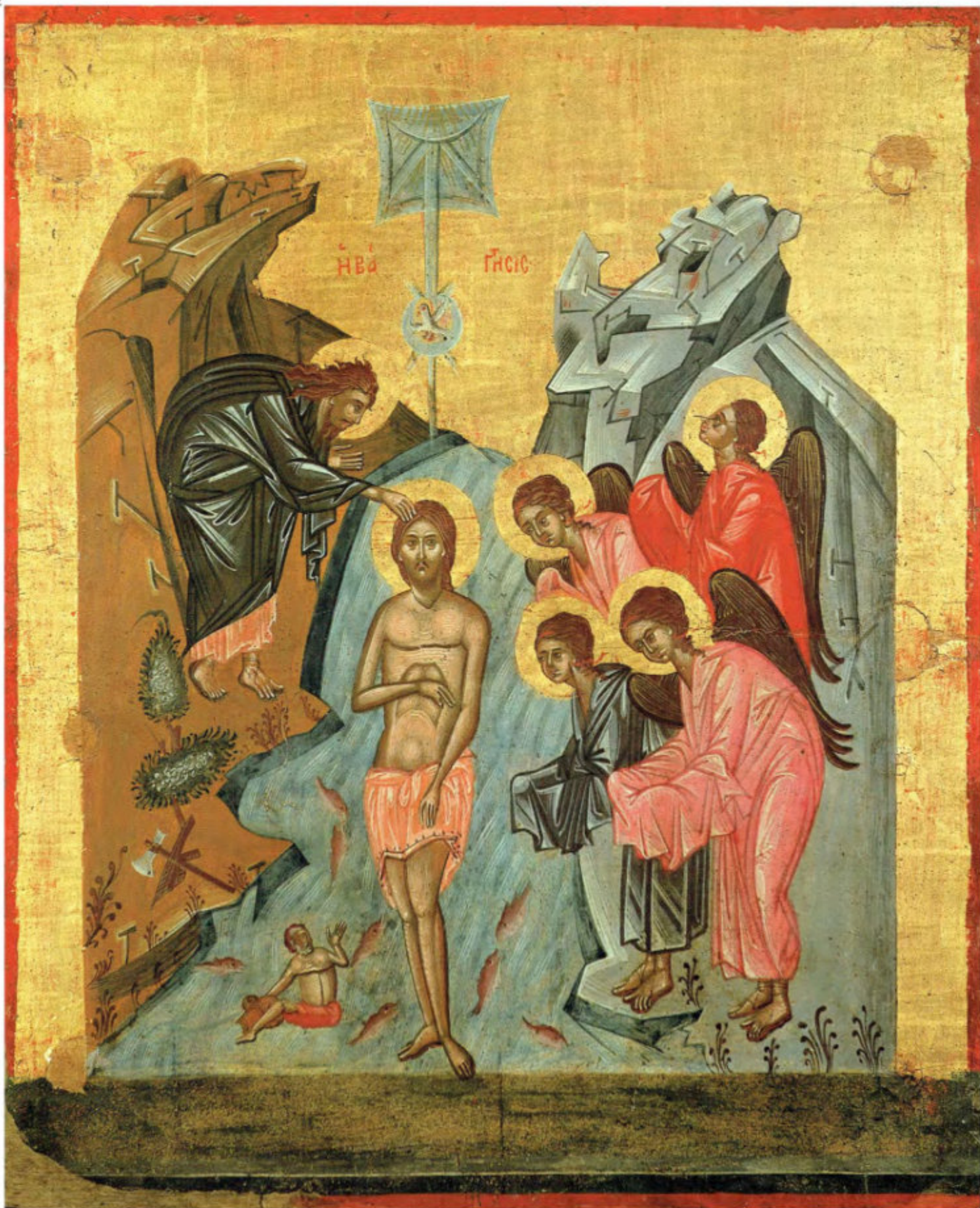
Iconostasi della Ss.ma Annunziata: 10. Battesimo del Signore. Anonimo greco, 1641. Arciconfraternita della Purificazione