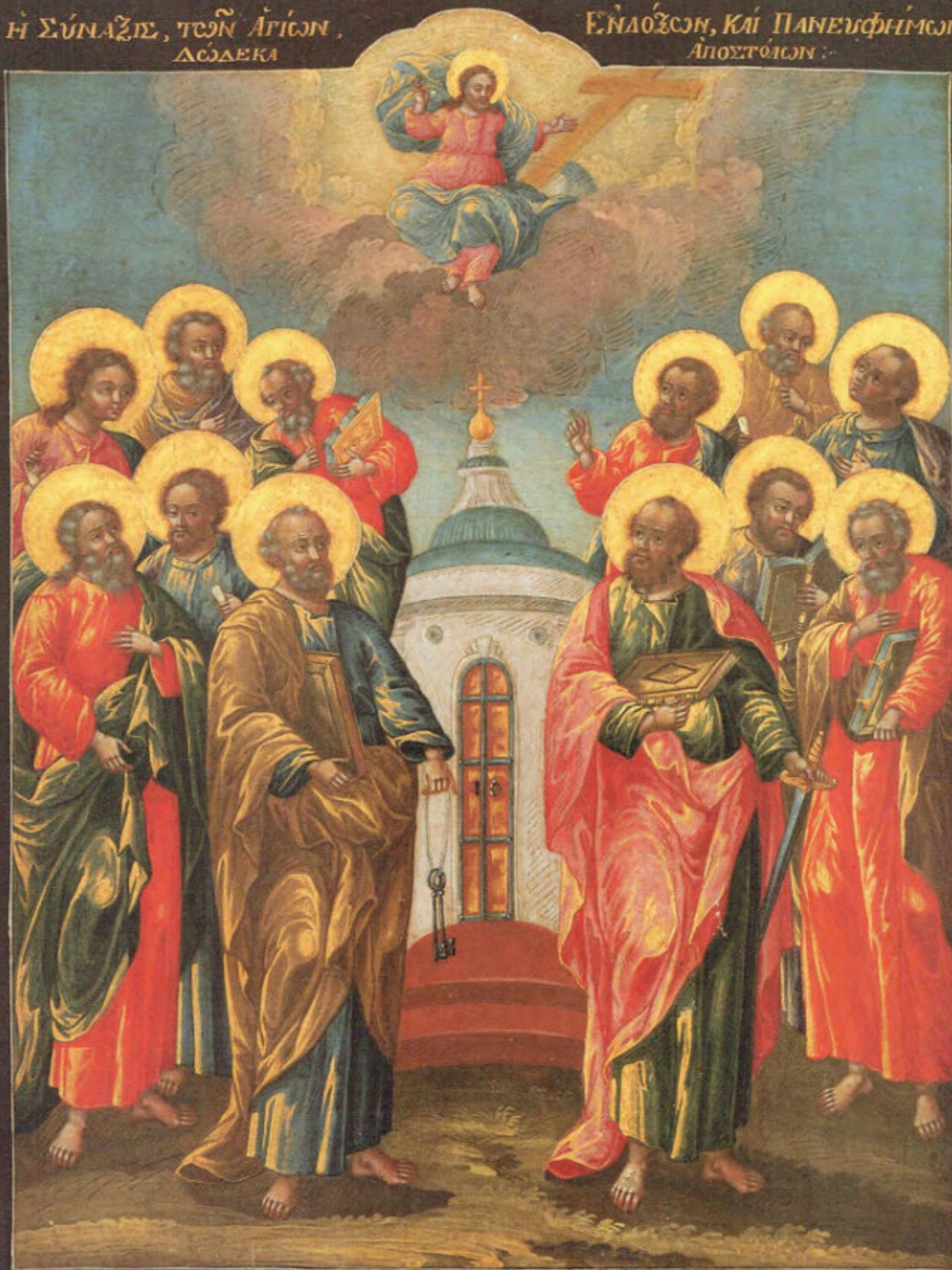
Iconostasi russa: 11. Assemblea degli Apostoli.

Anonimo russo. Mosca, metà del XVIII secolo. Scuola del Palazzo delle Armi. Museo Fattori inv. n° 1229