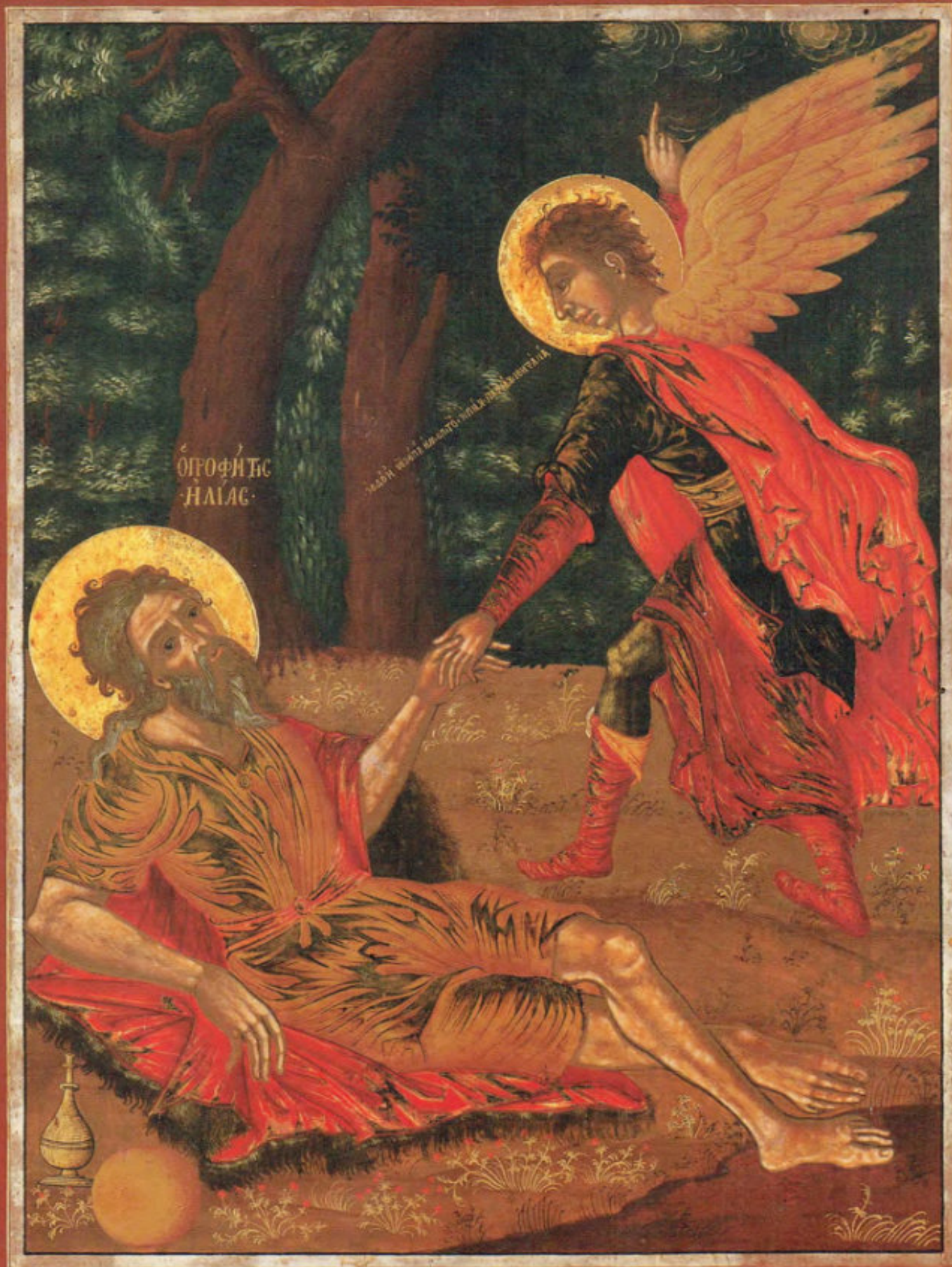
Le Icone "sciolte": T11. Il profeta Elia. Asterio di Kalarite in Epiro. 1766. Museo Fattori inv. n° 1232