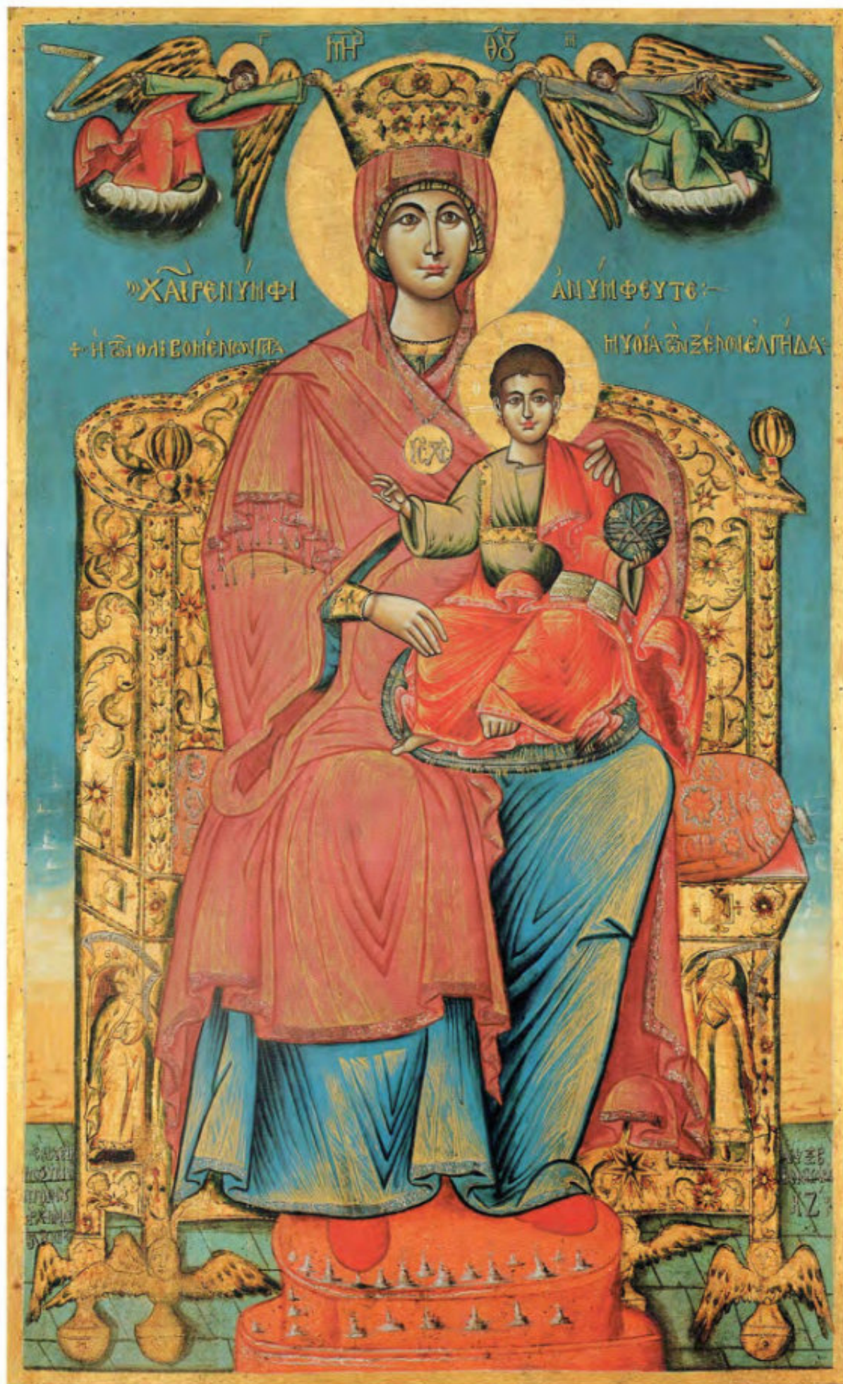
Chiesa della Ss.ma Trinità: Madre di Dio in trono.