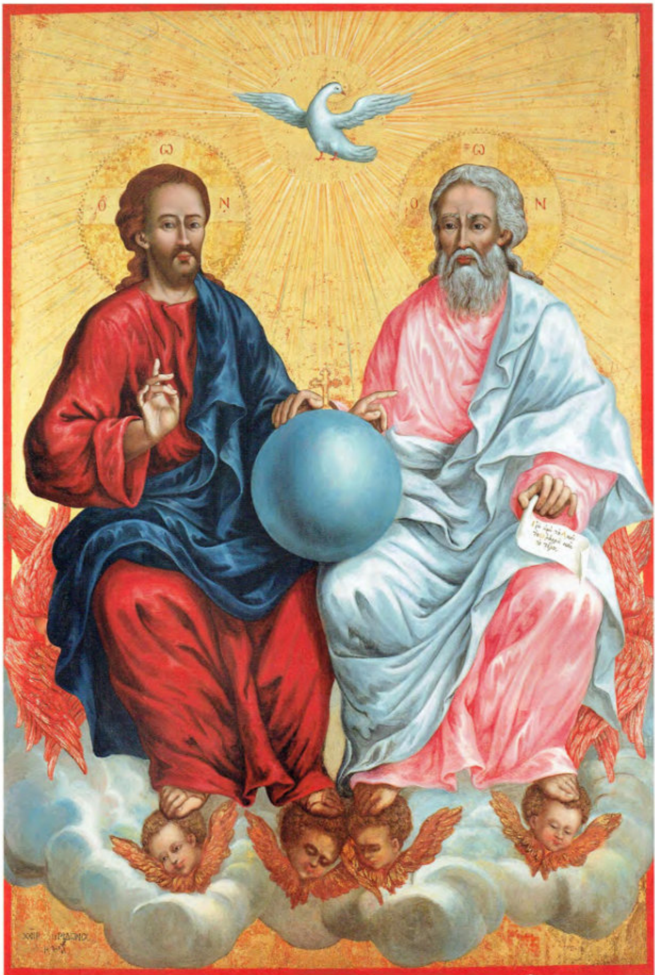
Iconostasi della Ss.ma Trinità: I. Ss.ma Trinità del Nuovo Testamento. Spiridon Romas. Livorno, 1764. Museo Fattori inv. n° 1278