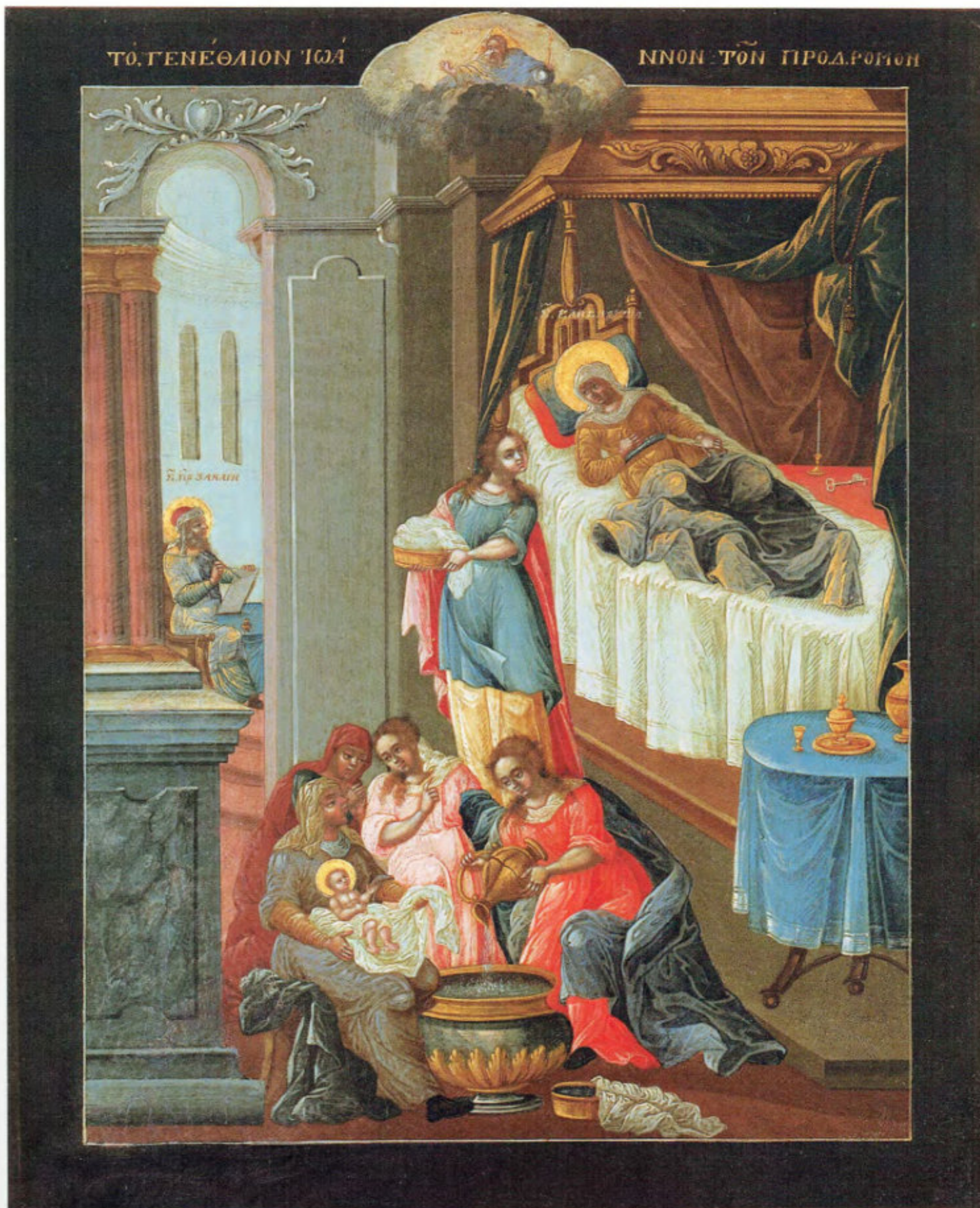
Iconostasi russa: 10. Nascita di Giovanni Battista.

Anonimo russo. Mosca, metà del XVIII secolo. Scuola del Palazzo delle Armi. Museo Fattori inv. n° 1224