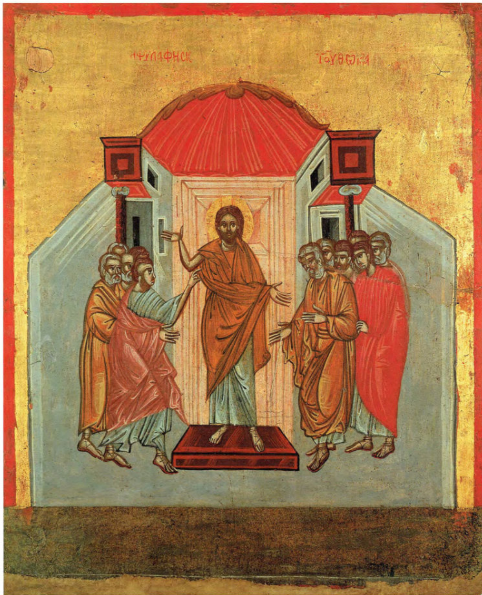
Iconostasi della Ss.ma Annunziata: 17. Incredulità di Tommaso. Anonimo greco. 1641. Arciconfraternita della Purificazione