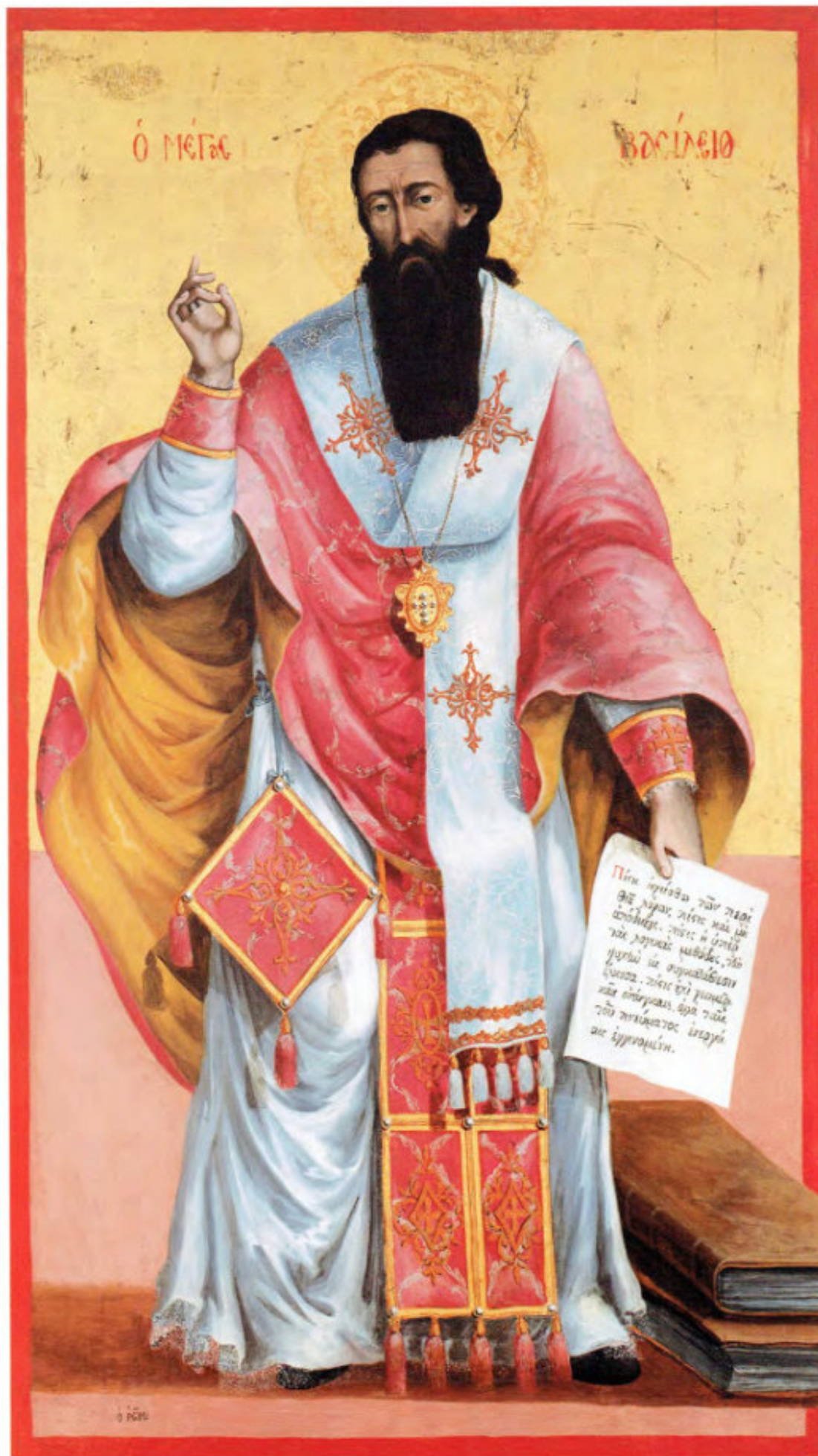
Iconostasi della Ss.ma Trinità: 4. San Basilio. Spiridon Romas. Livorno, 1764. Museo Fattori inv. n° 1275