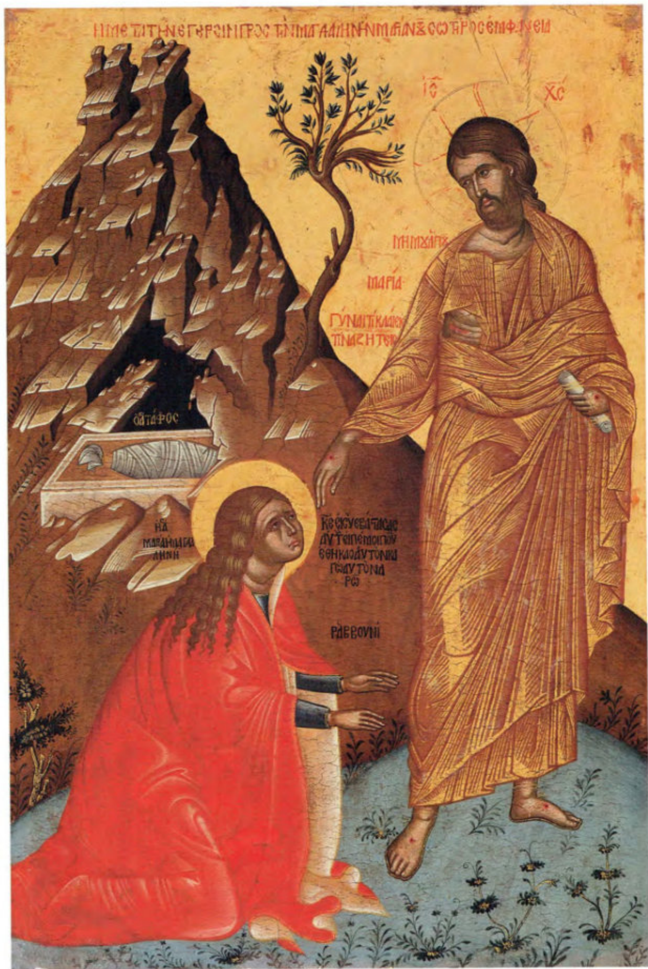
Le icone "sciolte": T1. Noli me tangere ( Non mi toccare ). Scuola cretese. XVII secolo. Museo Fattori inv. n° 1247