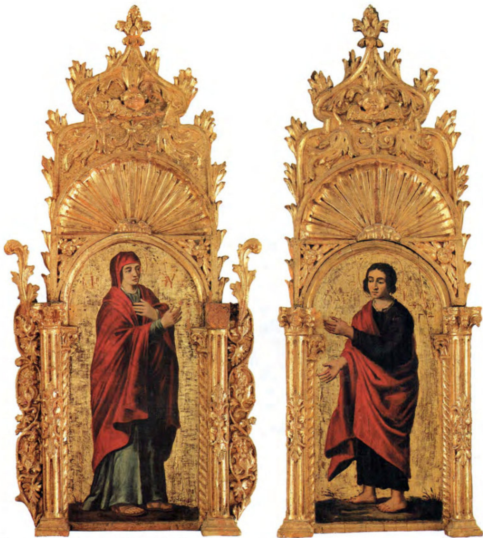
Iconostasi della Ss.ma Annunziata: 22. Madre di Dio e Giovanni Evangelista.

Intaglio: Frabenetos (Thomas Benetos), Creta 1642-43. Pittura: Anonimo cretese, Livorno 1644. Arciconfraternita della Purificazione