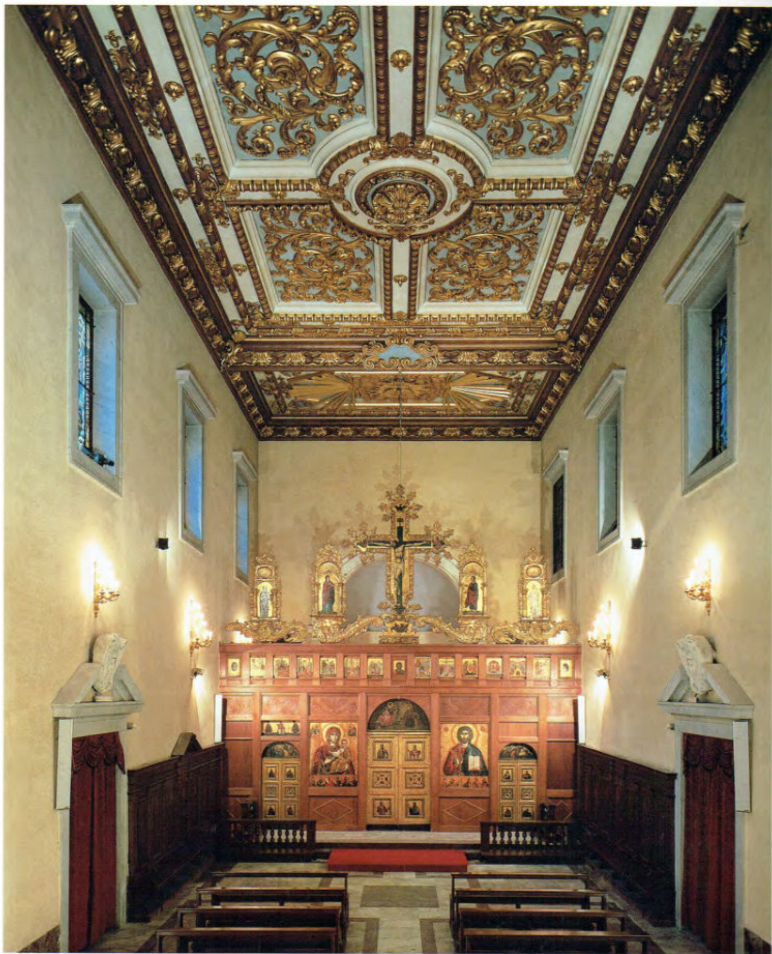
Iconostasi della Ss.ma Annunziata, oggi