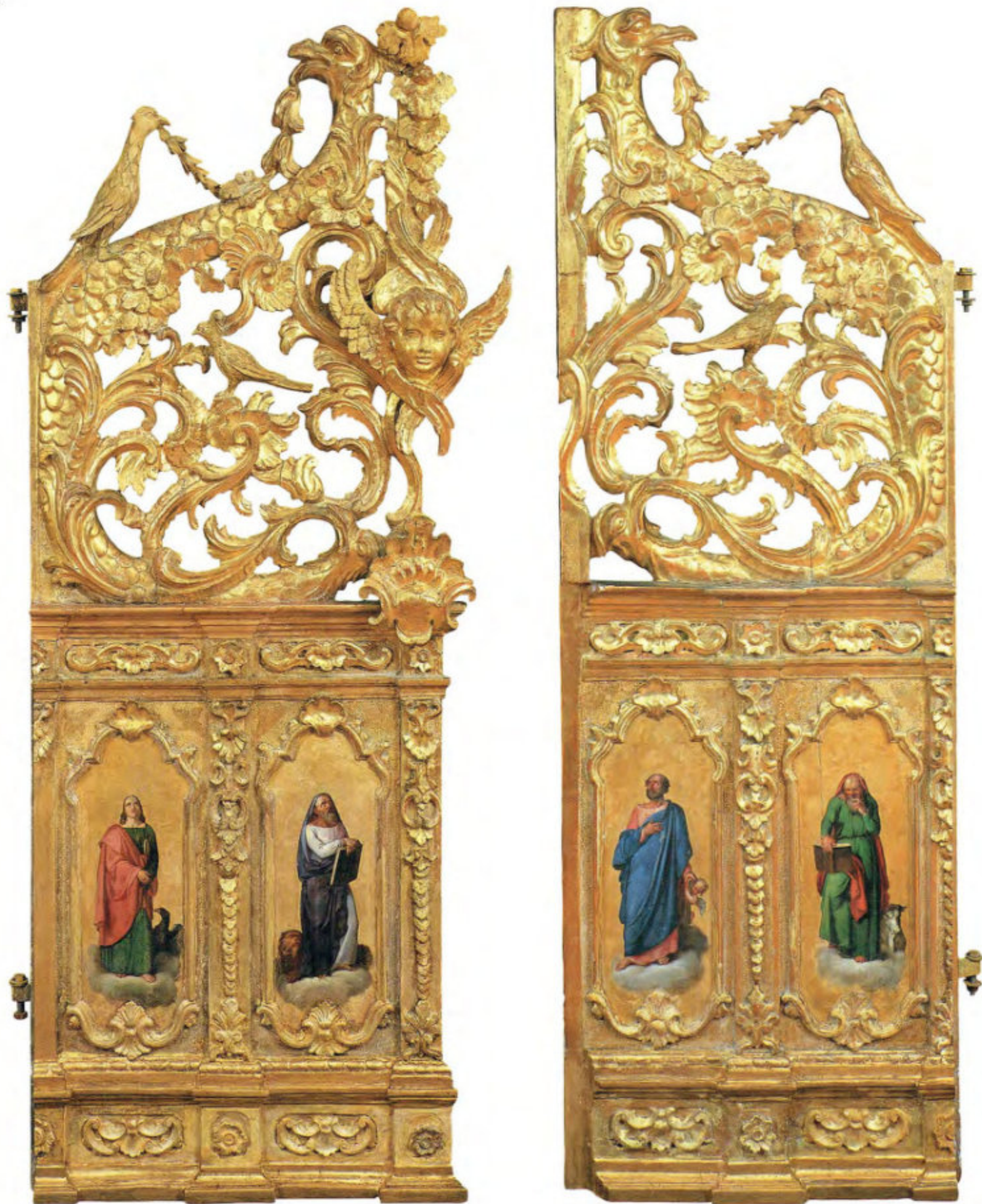
Iconostasi della Ss.ma Trinità: 5 e 6. La porta bella.

Spiridon Romas. Livorno, 1765-1766. Intaglio di autore ignoto. Figure di Evangelisti. Museo Fattori inv. n° 1281