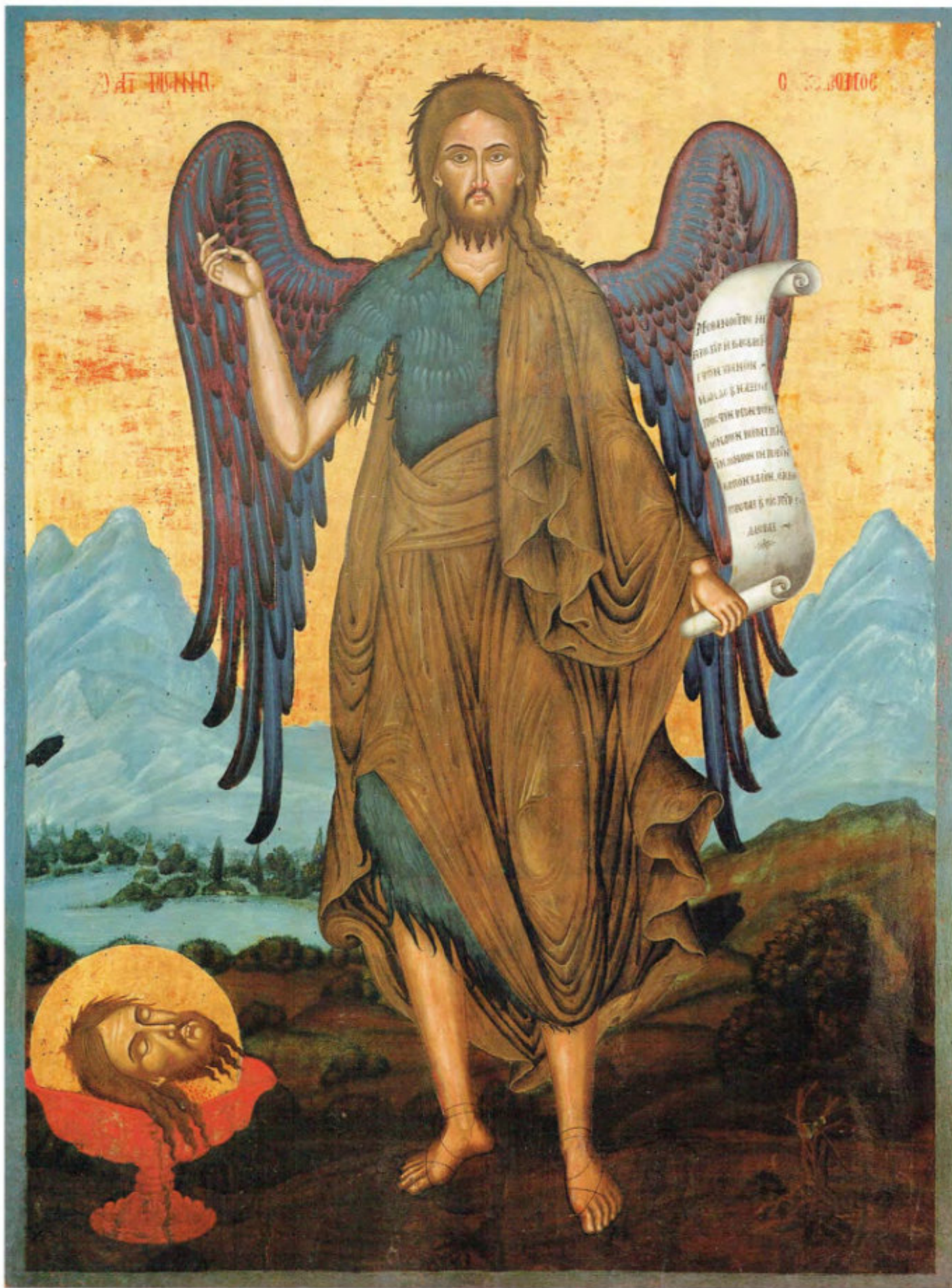
Iconostasi del vecchio Cimitero: 6. San Giovanni Battista.

Scuola ionica. Ultimo quarto del sec. XVIII. Museo Fattori inv. n° 1202