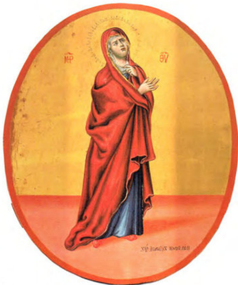
Iconostasi della Ss.ma Trinità: 23. Madre di Dio. Benédictos Lullis, monaco. Livorno, post 1767 (?). Museo Fattori inv. n° 1259