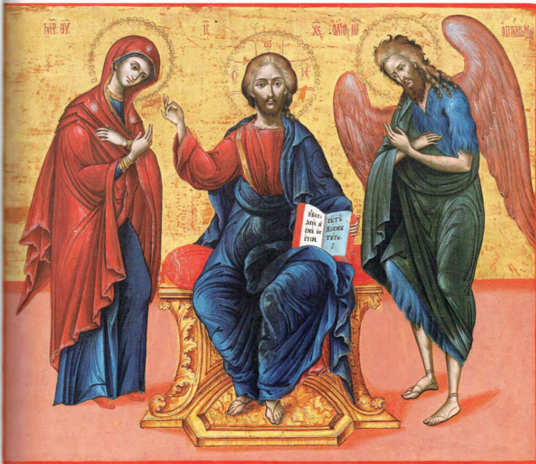
Le icone "sciolte": T20. Cristo in trono con ai lati la Madre di Dio e Giovanni Battista ( Deisis ). Scuola cretese. Fine XVIII secolo. Museo Fattori inv. n° 1238