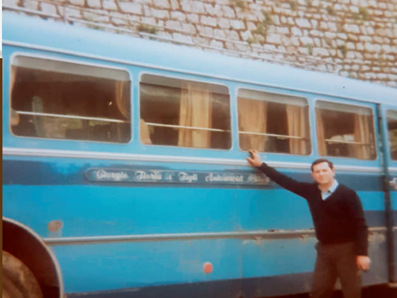
Anni sessanta, autobus ed autista della ditta Floria fotografati di fronte alle scuole elementari.