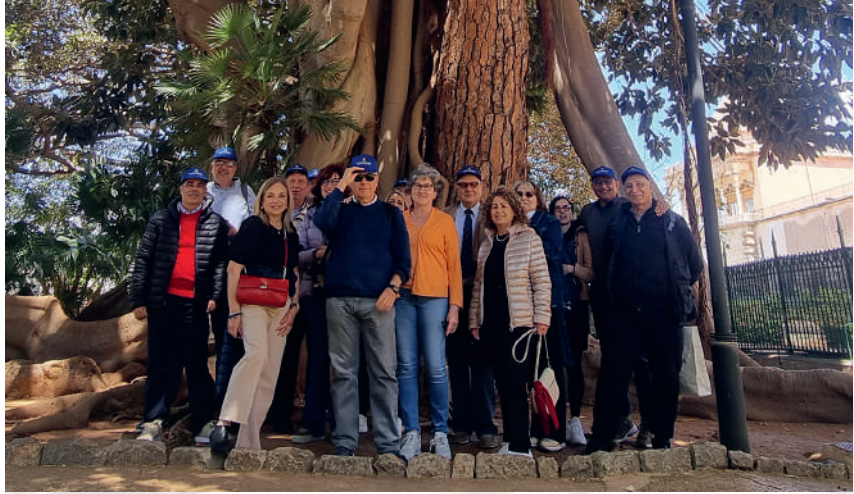
99esimo corso AUC a Palermo con le consorti

plemento, nel luglio del 1981, ognuno di noi ritornò nel proprio ambiente con un nuovo bagaglio di informazioni, di emozioni e di relazioni che sicuramente hanno arricchito e formato il nostro carattere. "Avanti è la vita", motto dell'8° Reggimento Guastatori del Genio nonché marcia musicale concertistica, ci ricorda di guardare sempre avanti nella vita con coraggio, speranza e armonia. I contatti si persero di nuovo! Allora, non esistevano ancora i telefonini ed i computer, né tantomeno Facebook o WhatsApp, e mantenere i contatti con i commilitoni ed amici era quasi impossibile. Le telefonate si facevano con il telefono di casa, per chi lo possedeva, o dalle cabine con i telefoni a gettoni e costavano abbastanza, specialmente quelle in teleselezione. I legami, con una cartolina, spedita al momento dal vicino tabaccaio, erano i più appropriati e tracciavano un indelebile segno di affetto per la persona a cui scrivevi.