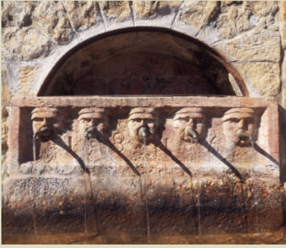
Quando alla Fontana Vecchia l'acqua scorreva da tutti i "cannoli"