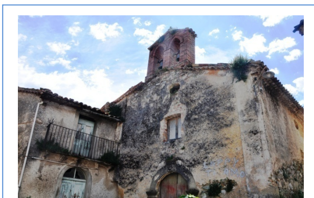
Vista da Nord-Ovest

Per quanto concerne la parete principale del fabbricato accanto alla chiesa, essa presenta un portale, con arco a tutto sesto, molto semplice, così come l'apertura rettangolare del timido balcone sorretto da graziose mensole, sul quale vi è una ringhiera in ferro battuto con alcuni ornamenti simili a quelli presenti nei parapetti di altri edifici, della stessa epoca, presenti soprattutto a San Benedetto Ullano.