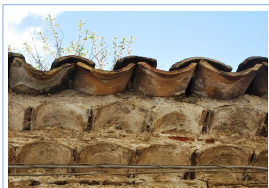
Cornicione "a romanella"

Ad ogni modo, sia lo stravagante prospetto principale della chiesa che quello dell'edificio al suo fianco sono formalmente e, soprattutto, storicamente interessanti, rappresentando il gusto, il linguaggio e il modo di costruire di un'epoca e inoltre ci consentono di avere tante altre informazioni. La facciata della prima ha un portale con arco a tutto sesto in materiale tufaceo, lavorato con motivi simili a quelli di altri palazzi presenti a San Benedetto Ullano e nei centri circostanti. Il campanile a due spioventi, in laterizi, formato da due archi a sesto acuto, ciascuno dei quali contiene una campana, è anch'esso interessante e possiede un certo