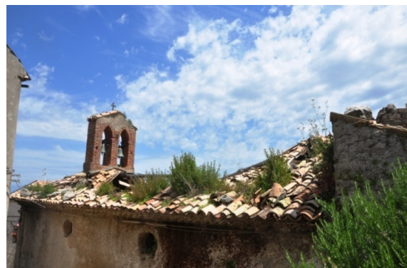
Vista verso Nord-Est