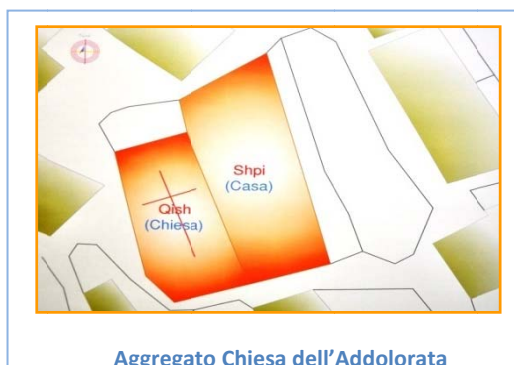
Aggregato Chiesa dell'Addolorata

Ogni luogo urbano ha una conformazione unica, soggetta a processi dinamici che possono essere naturali e/o artificiali, interessando, soprattutto, la realtà costruita, ossia la morfologia e l'architettura. Ciò nonostante, ogni luogo ha un proprio spirito, che è possibile percepire percorrendo gli spazi ( L'occhio che guarda questi luoghi immagina il loro passato, sente attraverso la pelle consumata dal tempo l'anima che li avvolge. , Roberto Peregalli). Quindi, solo "vivendo" all'interno di un determinato luogo si può avvertire l'esclusiva atmosfera e sentire il sapore del suo spirito. Per questo e, soprattutto, per poter meglio penetrare e comprendere l'urbanistica e l'architettura dei nuclei urbani arbëreshë, da tantissimi anni, mi reco personalmente nelle varie comunità: in tal modo, oltre che approfondire i miei studi e verificare i dati filologici raccolti tra archivi e biblioteche, tento di completare il lavoro di ricerca e classificazione di questi centri considerati minoritari.